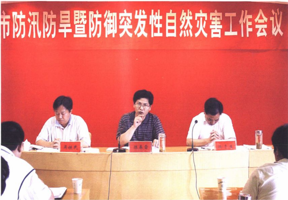
市领导作防汛防旱减灾动员部署