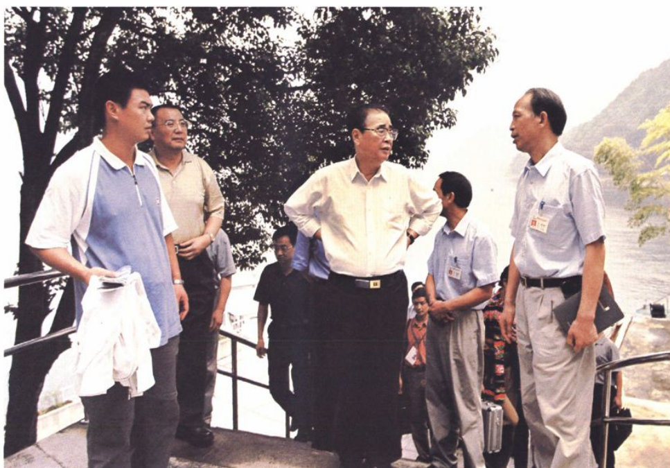
2003年9月原全国人大常委会委员长李鹏视察新安江电厂