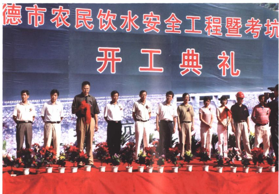
2005年开始实施农民饮水安全工程