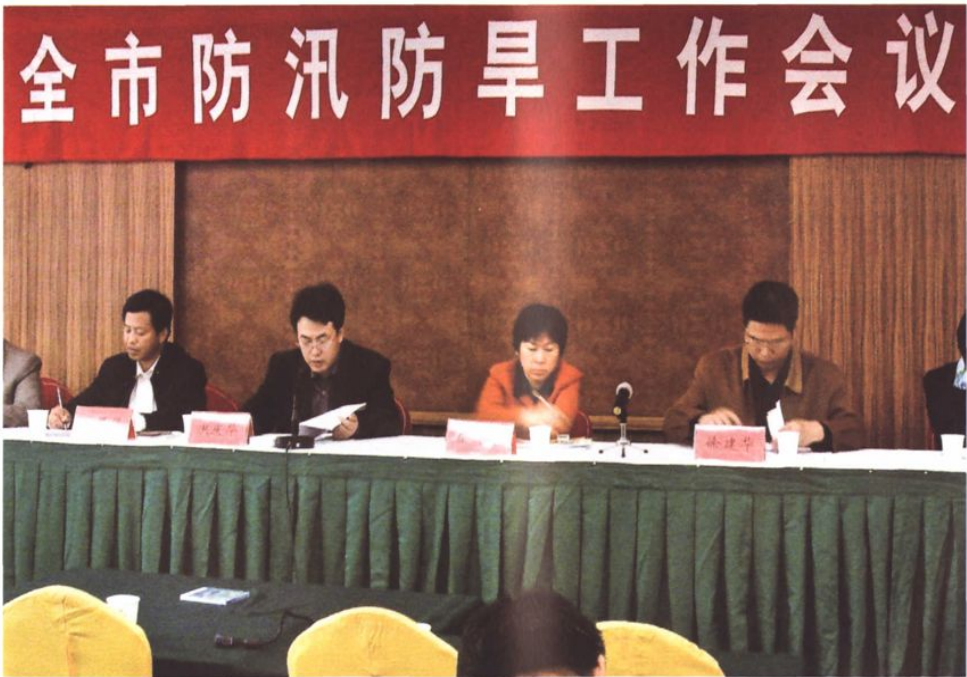
市委市政府部署防汛防台抗旱工作