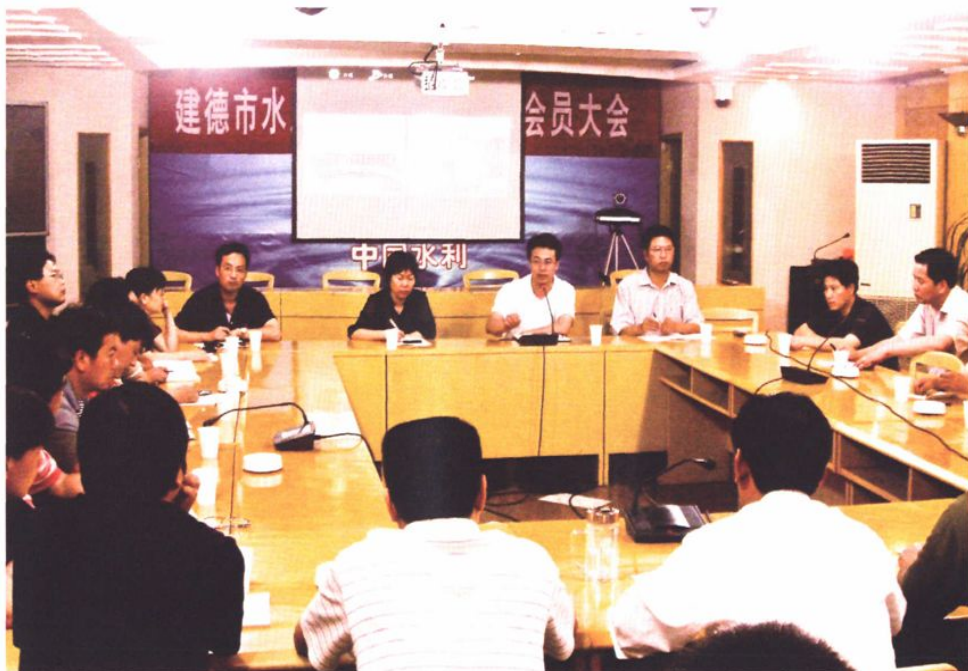
市防汛指挥部紧急部署防汛防台工作