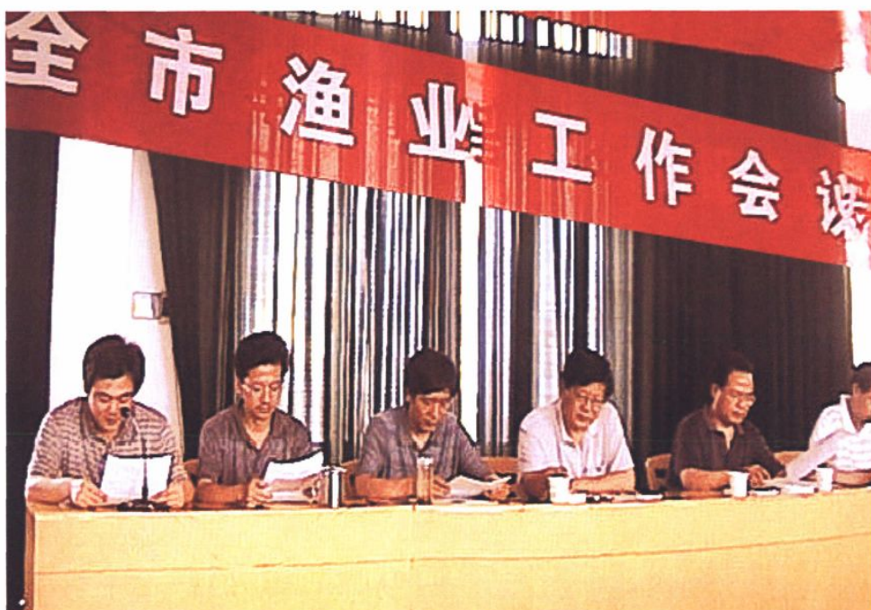
2003年全市渔业工作会议召开