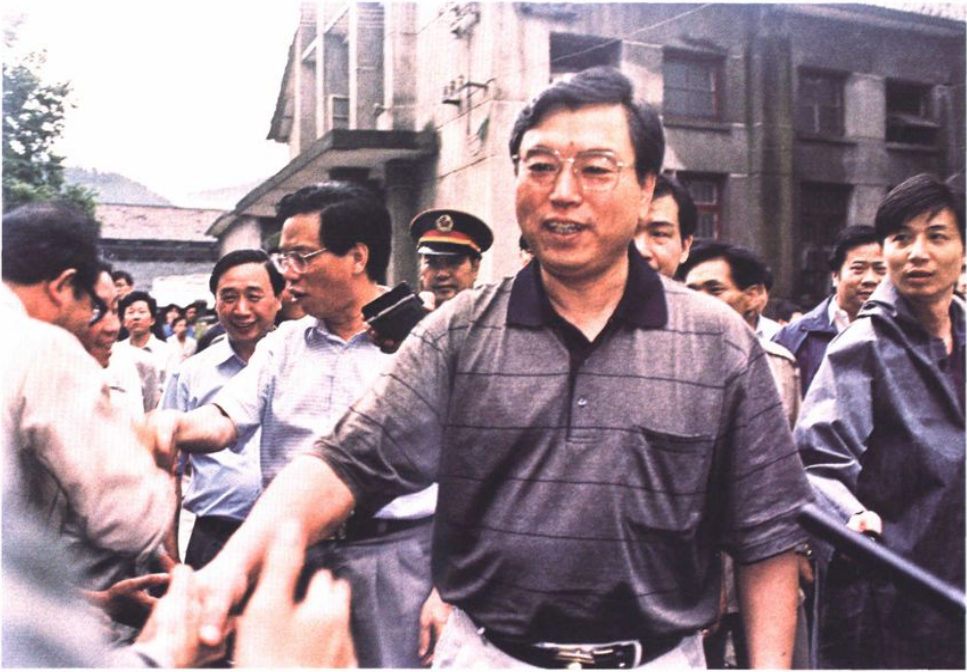
1999年省委张德江书记在我市指挥抗洪慰问受灾群众