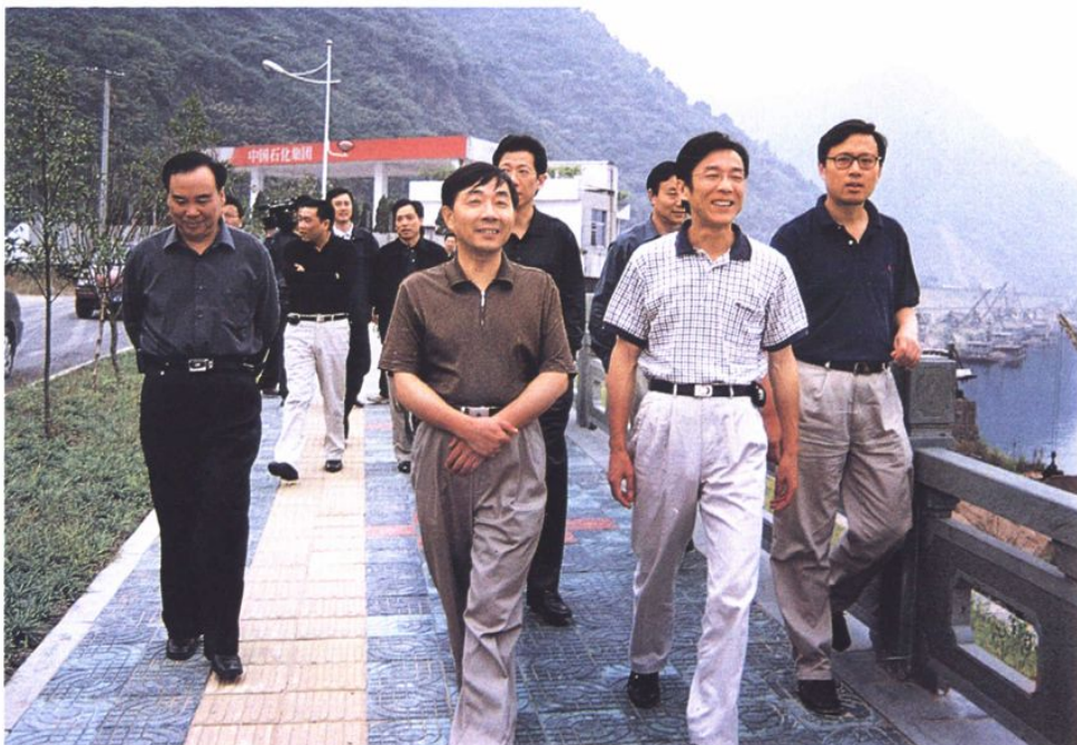
2002年省水利厅张金如厅长检查城防工程建设工作