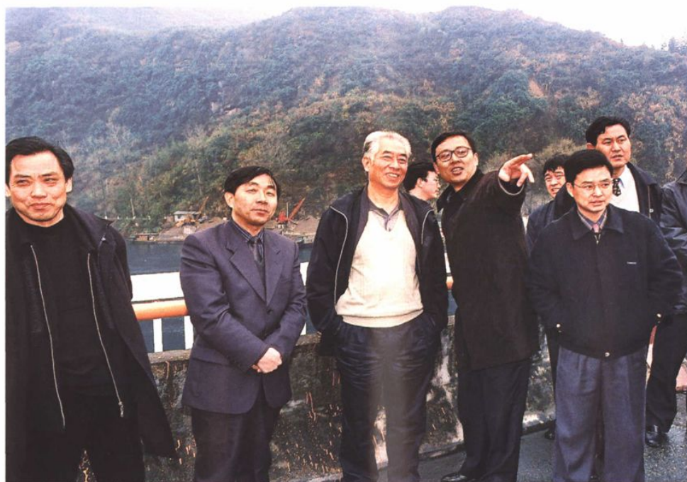
2001年水利部汪恕诚部长视察建德城防工程