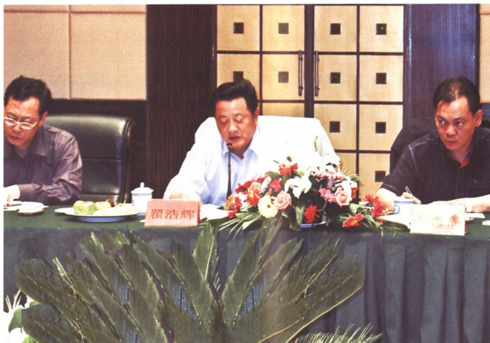
2006年水利部翟浩辉副部长检查防汛工作