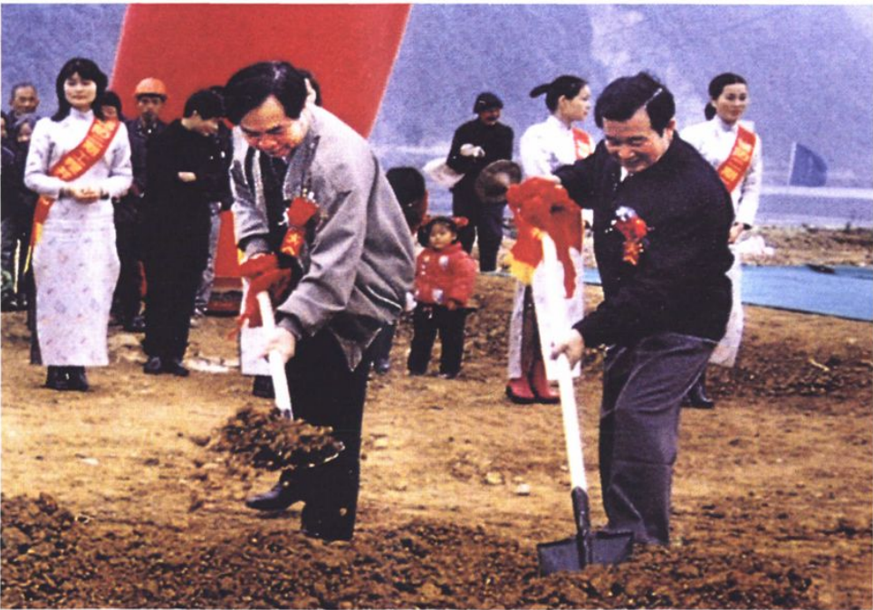
2000年章猛进副省长为建德城防工程开工奠基