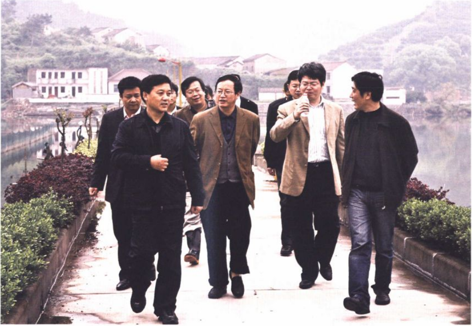
省水利厅陈川厅长到三都蹲点调研