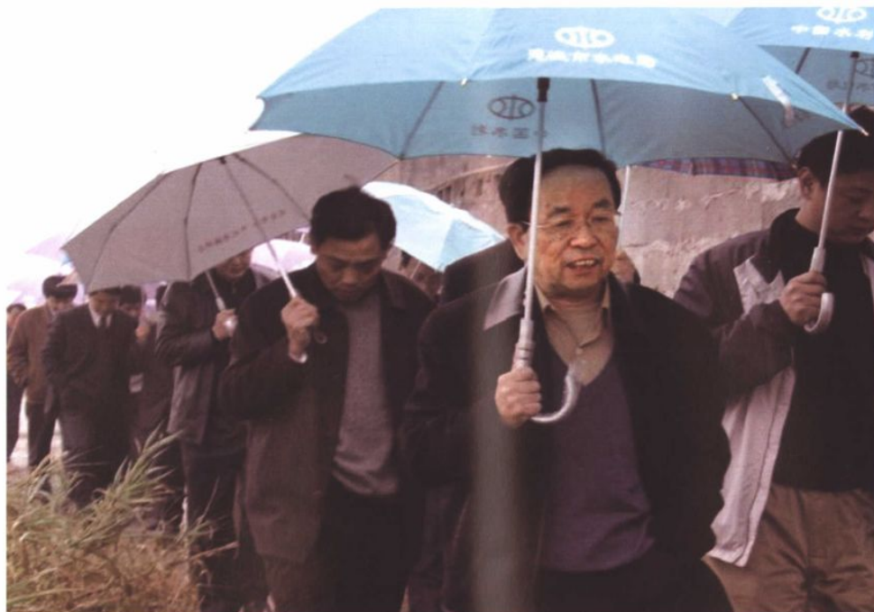
2004年水利部张春园副部长视察水利移民工作