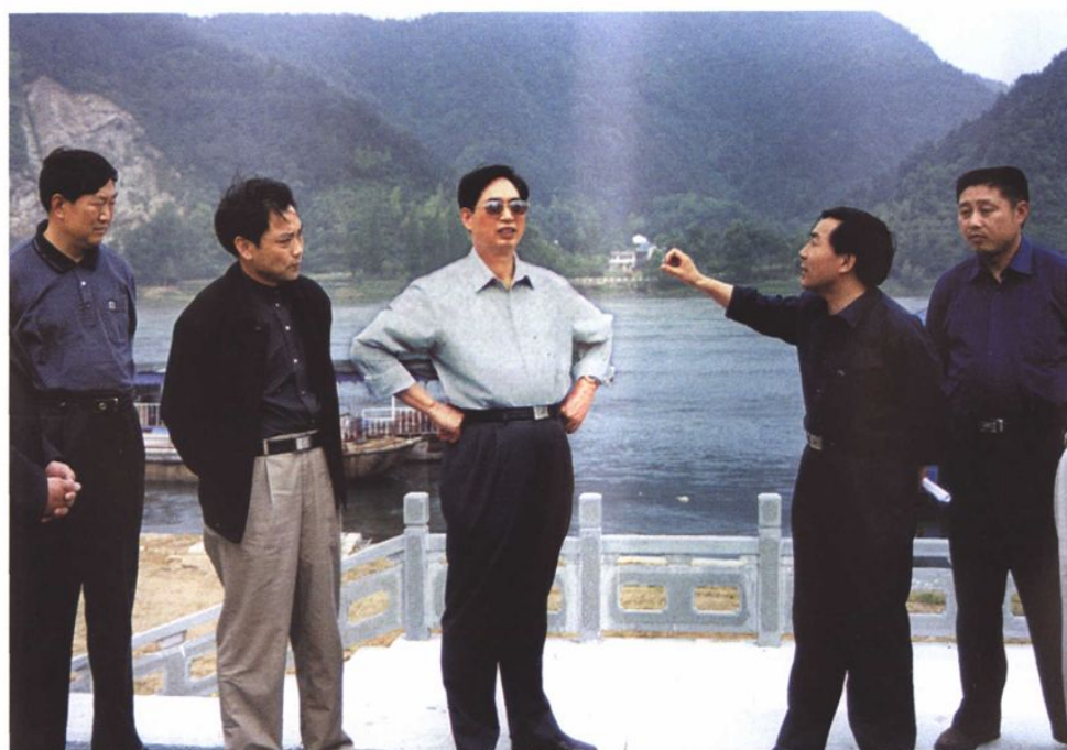
2002年武警部队政委徐永清上将视察城防工程