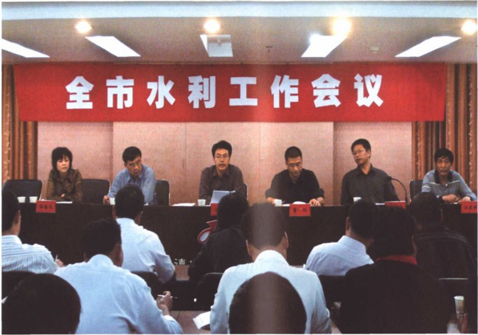
市委市政府研究部署水利工作