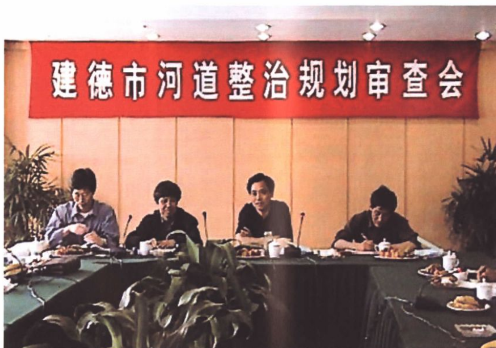
规划为先 依法治水