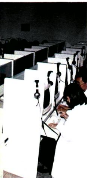
商洛地区卫生学校多媒体教室