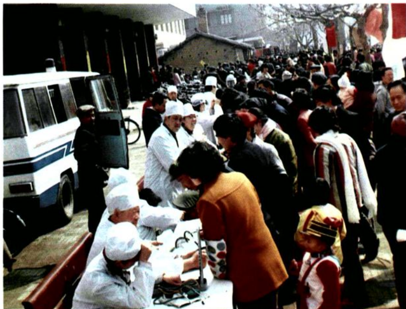
医务人员下乡巡回医疗