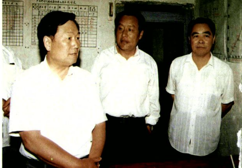
1997年6月14日,卫生部副部长孙隆椿在商洛地区卫生局局长程达富、洛南县卫生局局长吕长兴的陪同下,视察洛南县农村卫生工作。