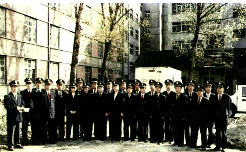
◀商洛地区卫生防疫站卫生 监督人员