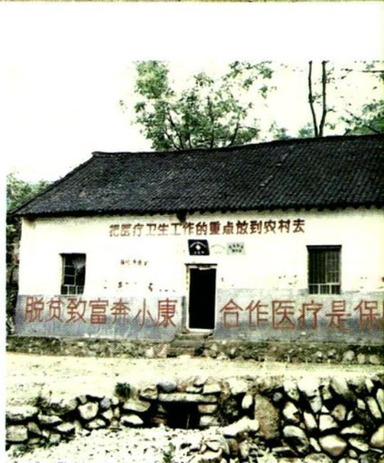
商南县荆家河村卫生室