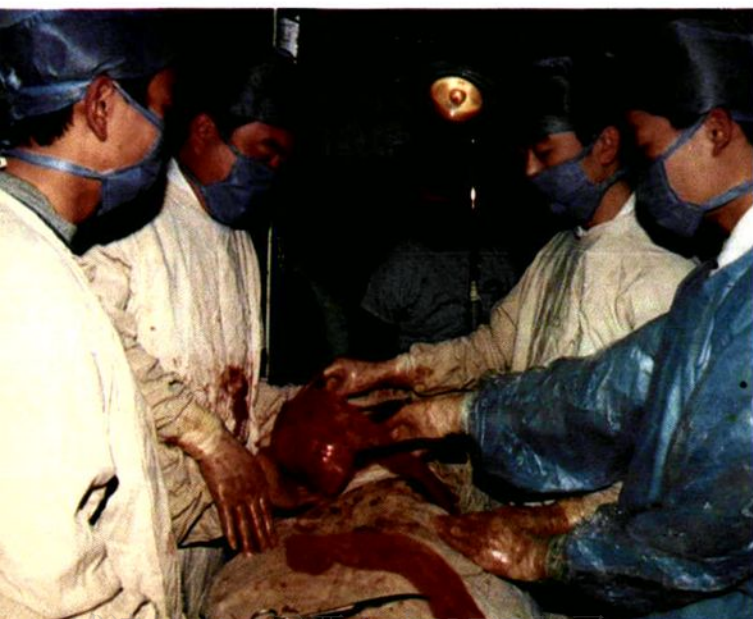
商洛地区医院外科医务人员正在进行胸腔肿瘤切除手术