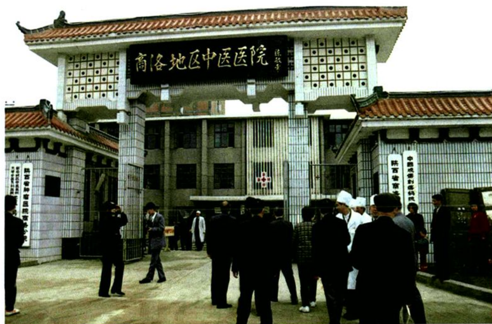
◀ 商洛地区中医医院