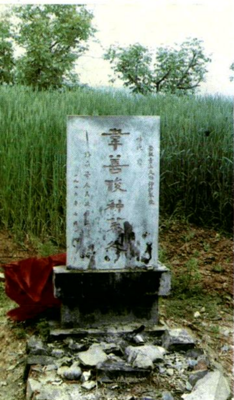
唐代名医韦善俊种药处