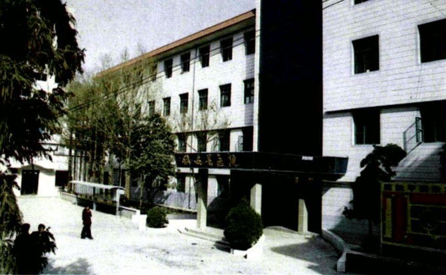
◀ 镇安县医院门诊楼