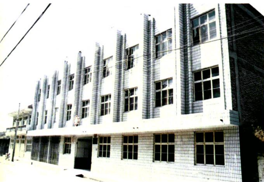
◀ 一级甲等卫生院——商州市北宽坪镇中心卫生院