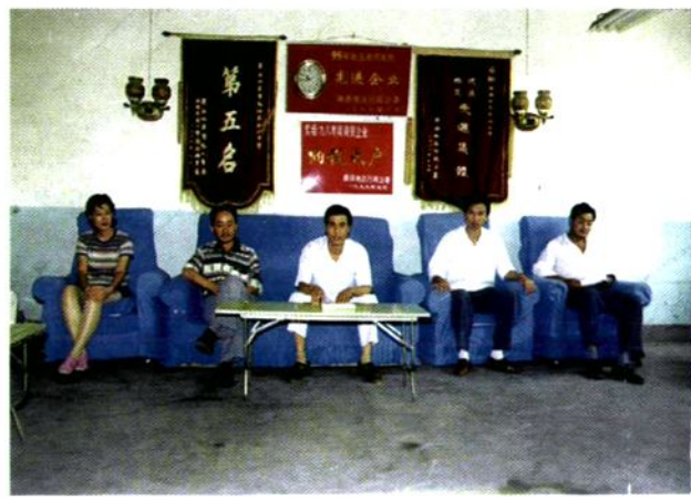
商洛地区药材公司领导组织职工学习《药品管理法》做到依法经营