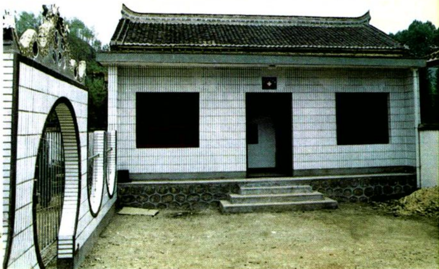
洛南县大石村卫生所