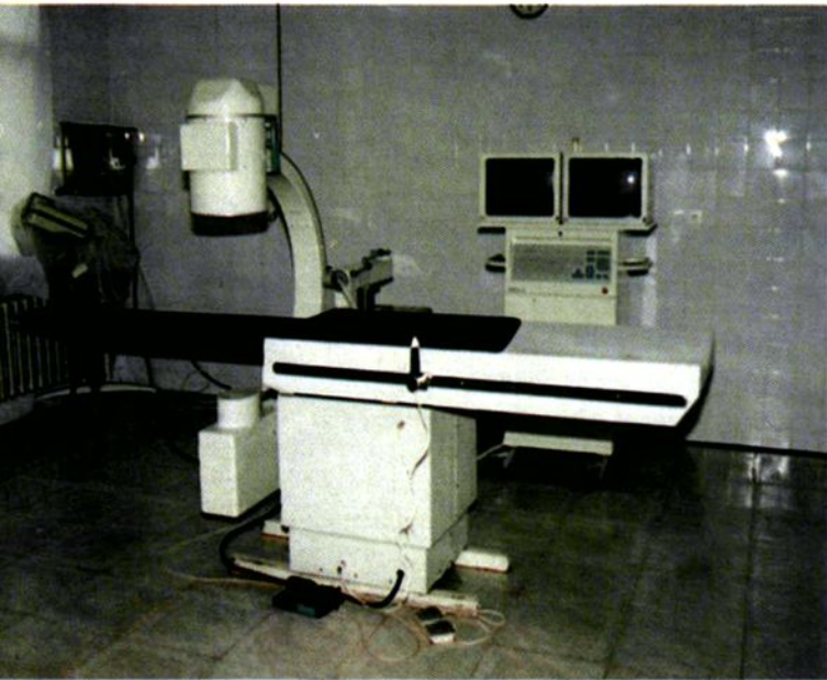
商洛地区医院数字减影机