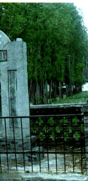
西北青年抗日战线救护队队长——罗锦文烈士墓碑