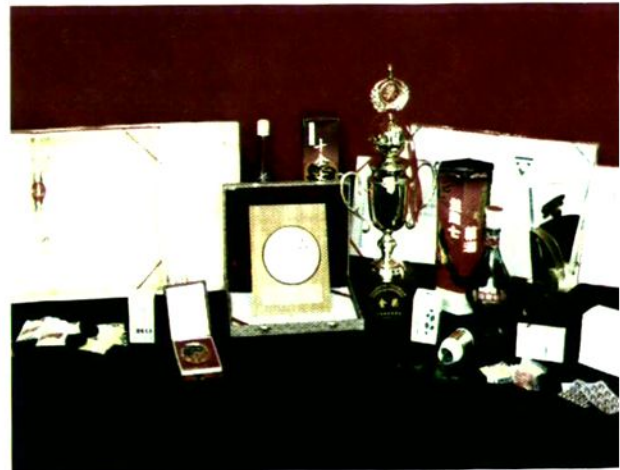
柞水县“盘龙七”系列药品