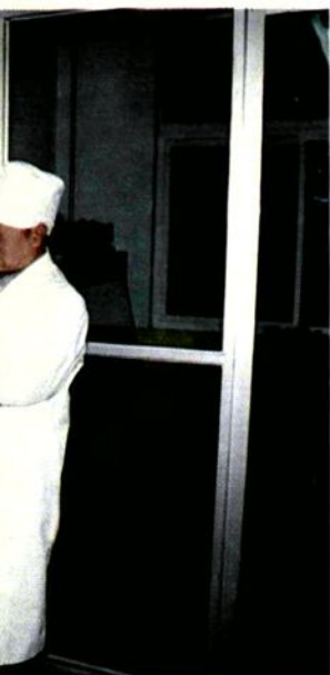
商洛地区药检所药检人员正在检查药品质量