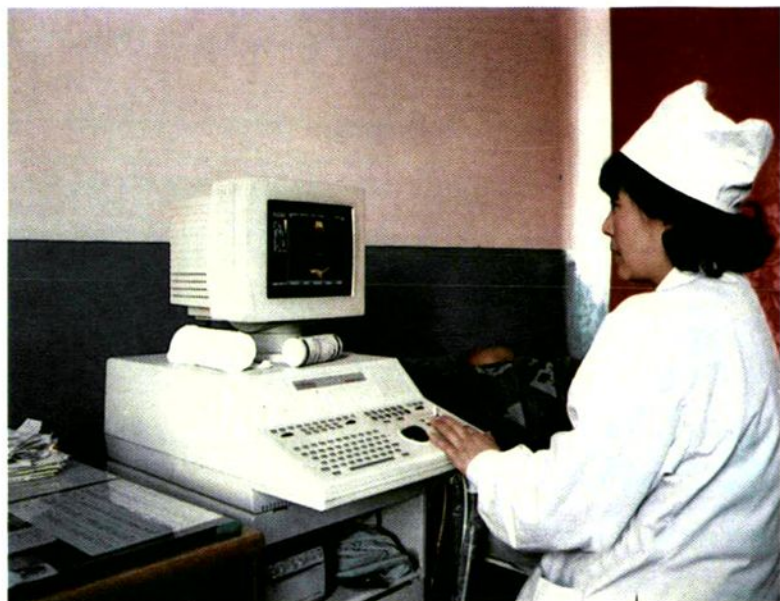
▲商洛地区卫生学校附属医院 彩色B超诊断室