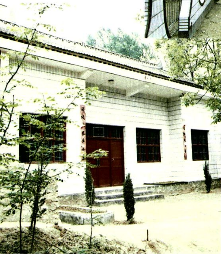
洛南县大石村的浴池