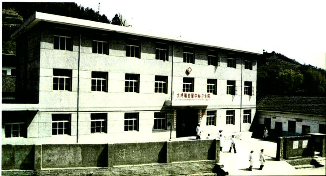
▶ 商洛地区乡镇卫生院的一面旗帜 ——镇安县大坪镇岩屋中心卫生院