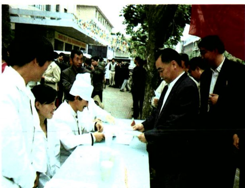
街头的无偿献血活动