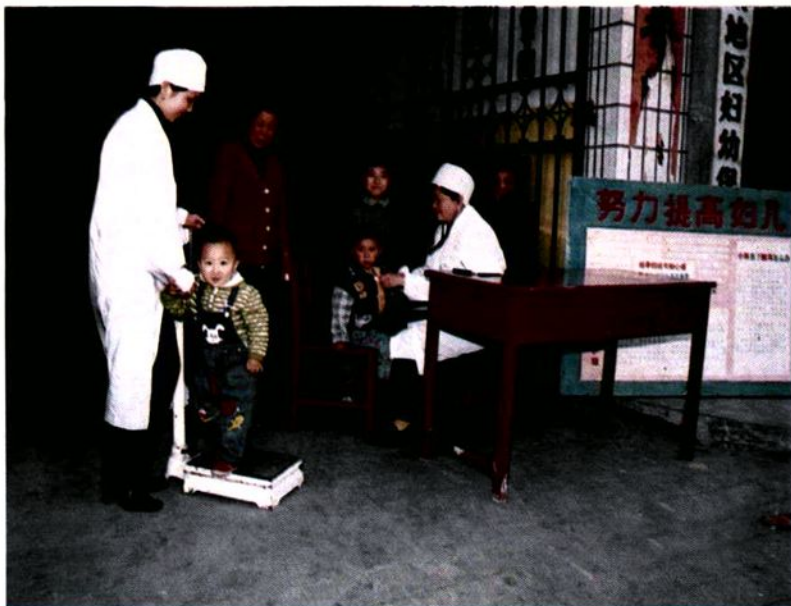
妇幼保健人员为儿童查体