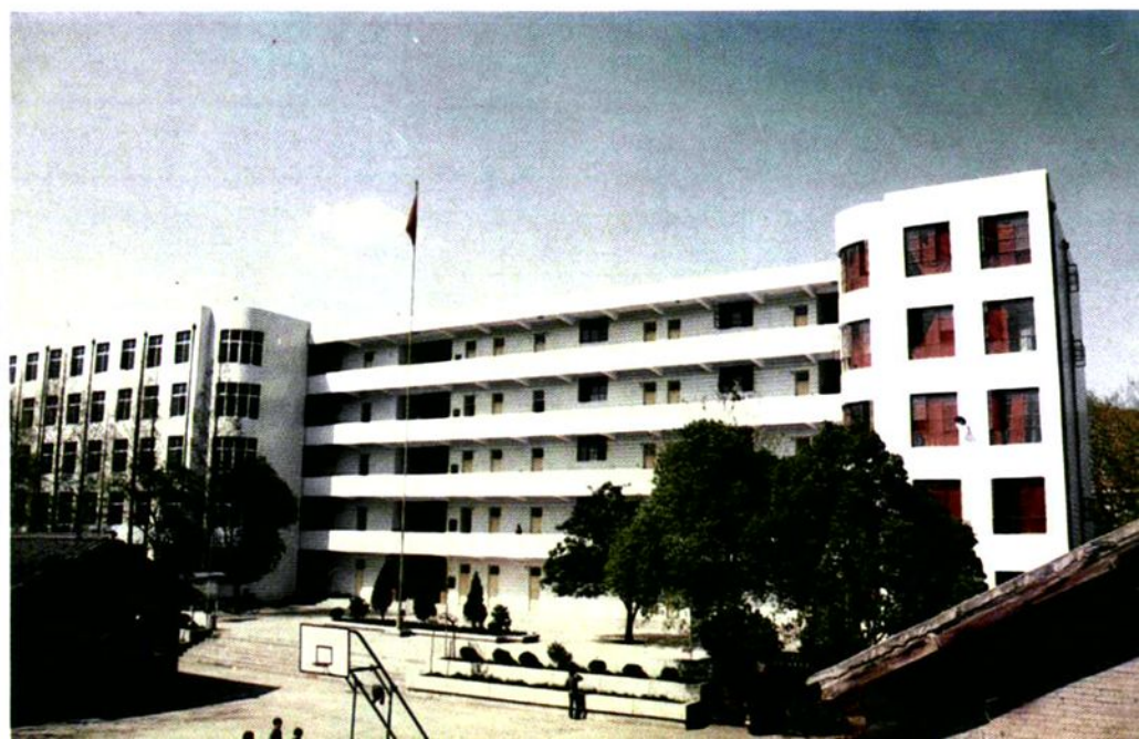
▶ 商洛地区卫生学校教学楼