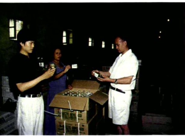
商洛地区药材公司质检人员正在检查药品质量