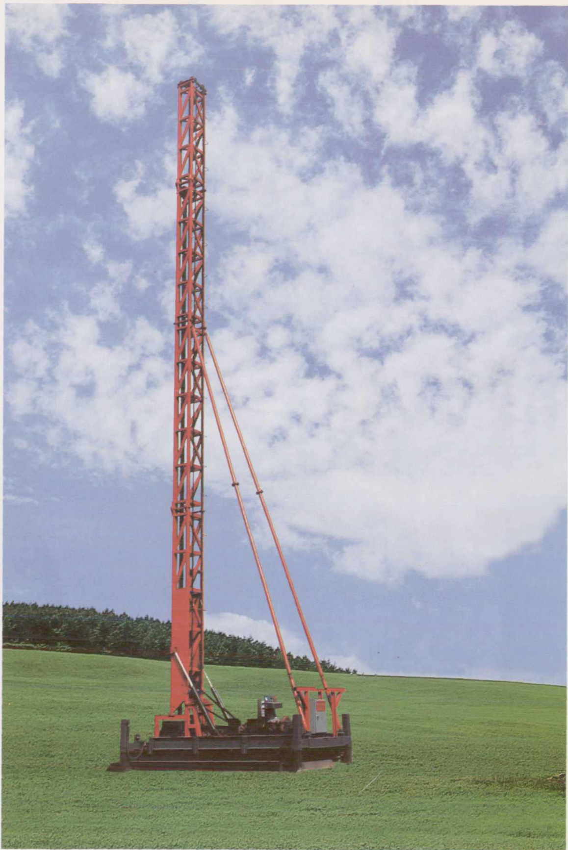
我所主要产品PH-5系列喷粉桩机