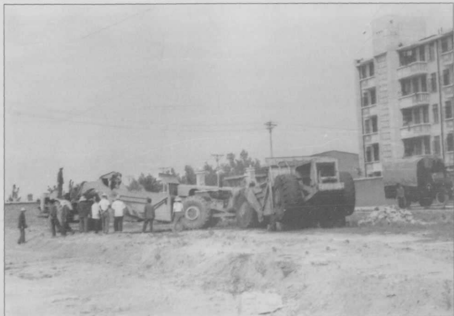
▲ 对铲运机进行试验