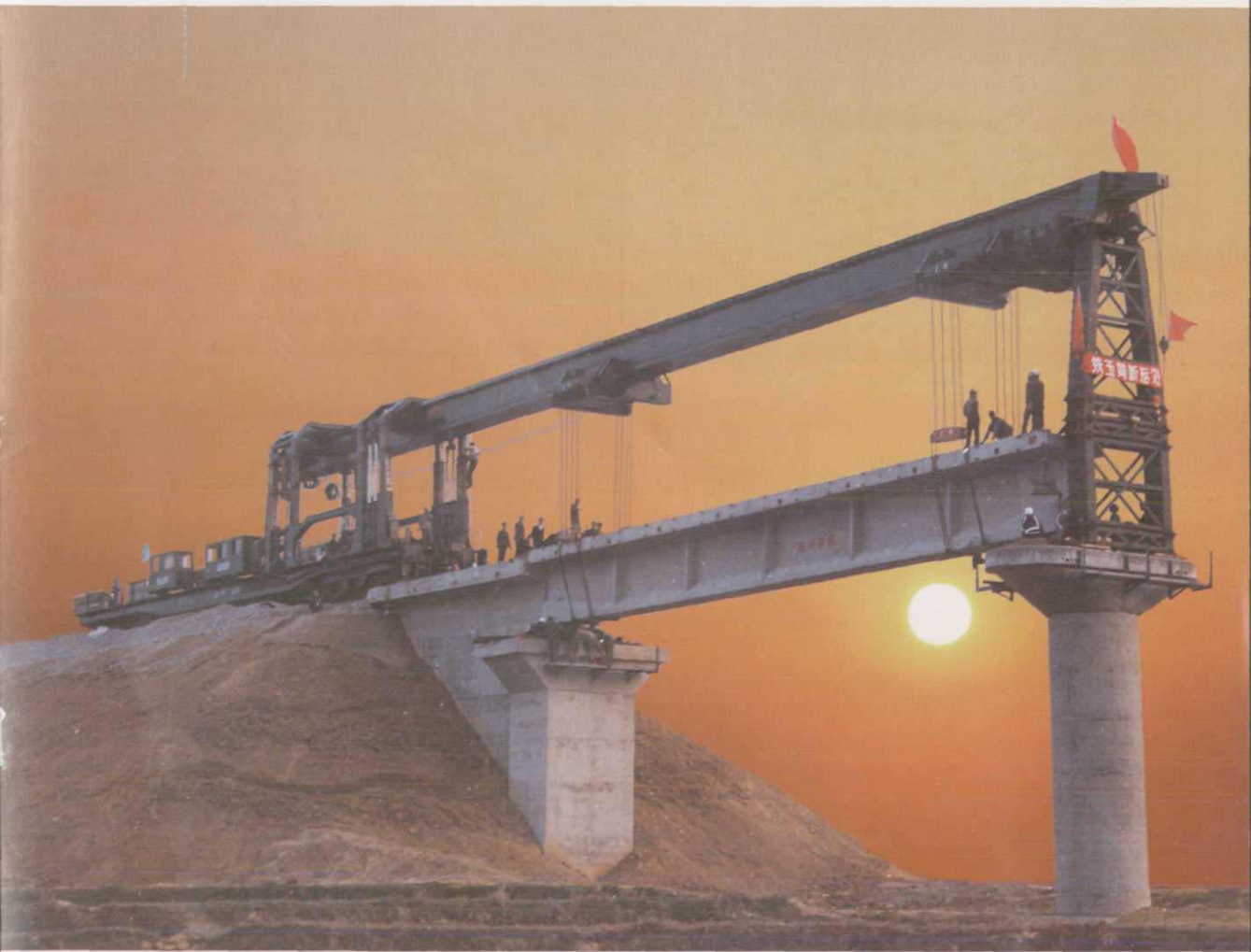
JQ130型架桥机在大京九线横店段架设32米桥梁

我所设计的JQ130、JQ160型铁路架桥机一出厂，立即投入到大京九线铁路架桥工地使用，发挥了巨大作用。四台JQ130型机组从1993年2月至1996年6月共架桥2487.5孔，三台JQ160型机组从1995年3月至1996年初共架桥438孔。