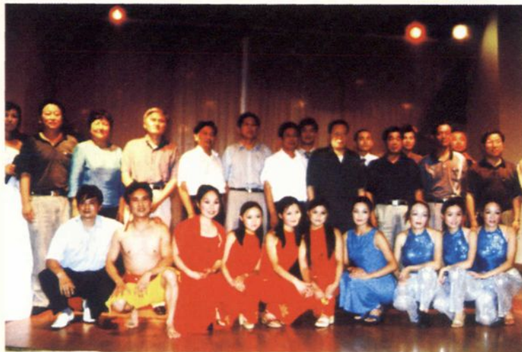
◀ 2003年7月14日，原中组部长张全景一行来蕲春检查指导工作；图为在市委书记段远明，副书记阮银梓和县主要领导的陪同下观看迎宾晚会并同演员合影。