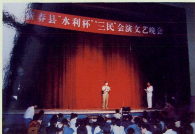
▲ 图为蕲春县“水利杯”“三民”会演晚会现场