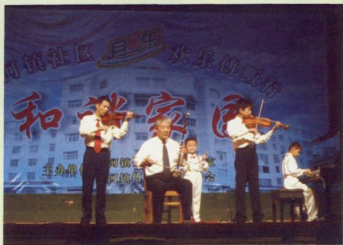
▲ 图为漕河社区“月月乐”演出现场