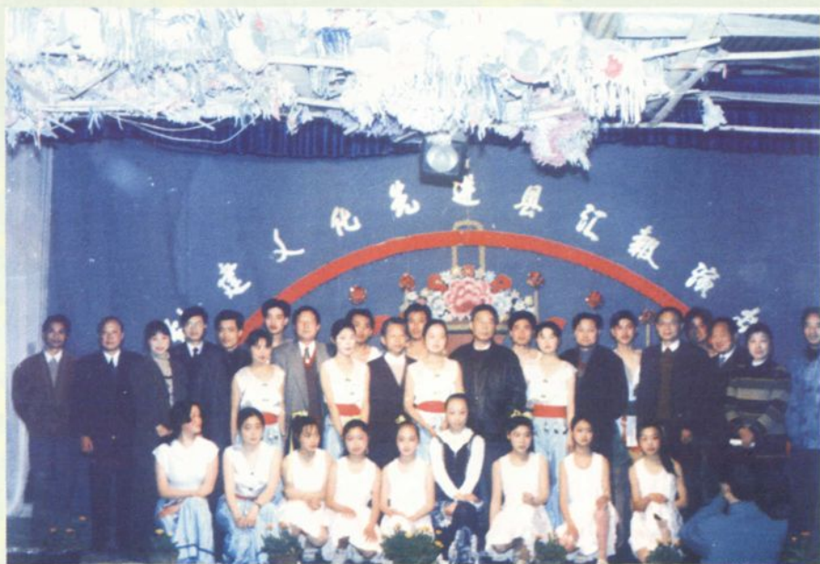
▲ 1995年，蕲春县被湖北省委省人民政府首批命名为“全省文化先进县”同年又被国家文化部命名为“全国文化先进县”。图为省验收组与县领导和演职人员合影。