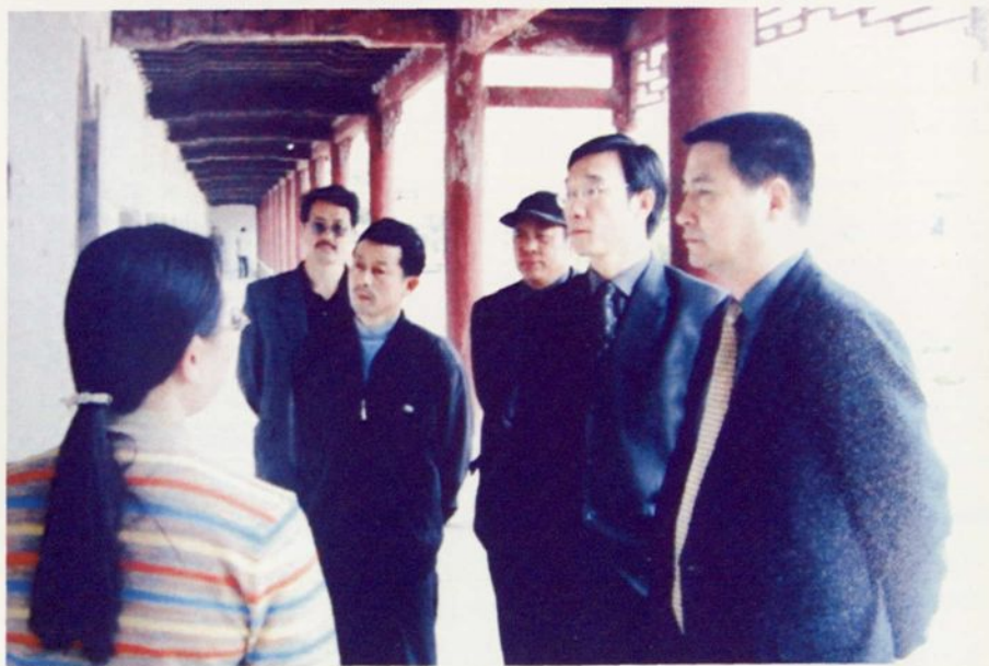
▲ 省文化厅副厅长王建刚在蕲春县视察文化工作。