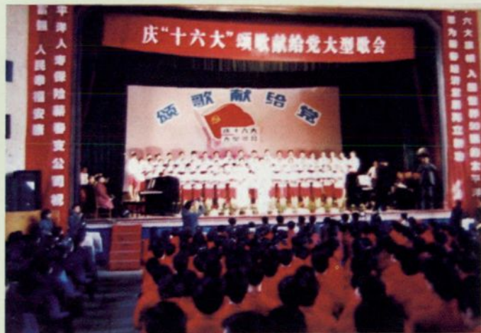
▲ 图为庆“十六大”颂歌献给党大型歌会现场