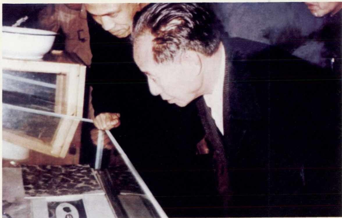
▲ 1984年12月13日下午4时15分，中共中央总书记胡耀邦同志，在湖北省委书记关广富、副书记钱运录，黄冈地委书记杨祖炎等同志陪同下视察李时珍陵园。