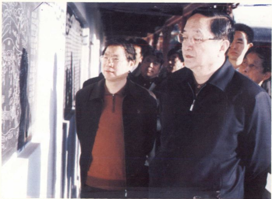
▲ 2004年12月3日，中共中央政治局委员、湖北省委书记俞正声(图右)在蕲春县委书记熊长江(图左)的陪同下视察李时珍纪念馆。