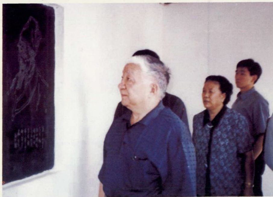
▲ 2000年10月2日，全国政协副主席王文元视察李时珍纪念馆。