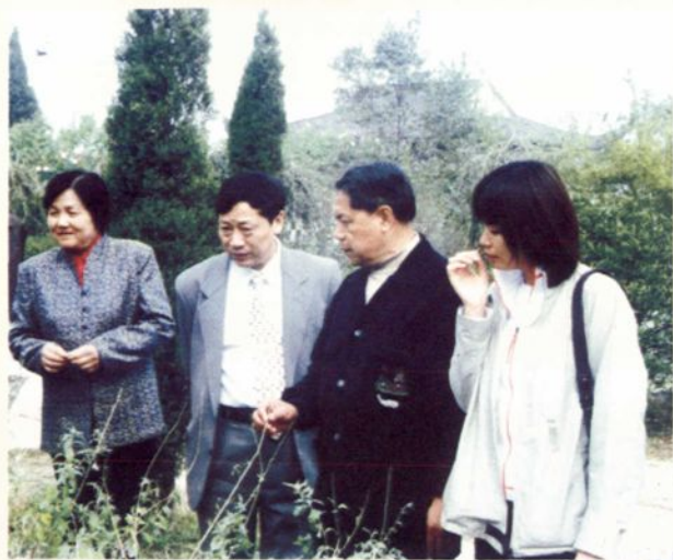
◀ 2001年10月23日，原国家新闻出版总署署长于友先（左三）同志在李时珍纪念馆参观，省新闻出版局局长邱久钦（左二），县委常委、宣传部长叶爱新（左一）陪同。