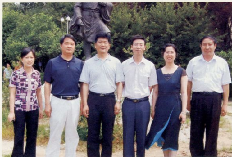
◀ 2008年6月28日，湖北省文化厅长杜建国（左3）在黄冈市文化局长肖红娟（左5）蕲春县长徐和木（左4）、县委常委、宣传部长田文国（左2）、副县长石玉艳（左1）、文化局长周振东（右1）的陪同下视察蕲春文化工作。