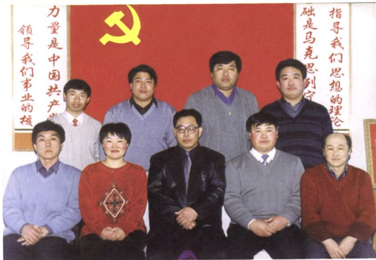
乡党政领导班子成员