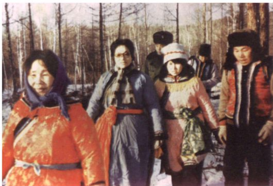
省政协主席李敏 (左二)到鄂乡视察。