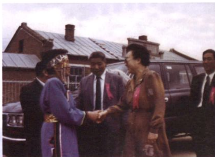
副省长马淑洁(右二)参加鄂 伦春族定居 40 周年庆典。