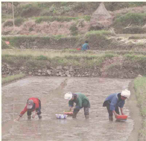
水族妇女在育秧

水族地区的水稻品种也在不断更新。1949年以前，水族地区水稻种植品种都是每年秋收