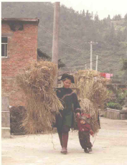
挑稻草的水族妇女