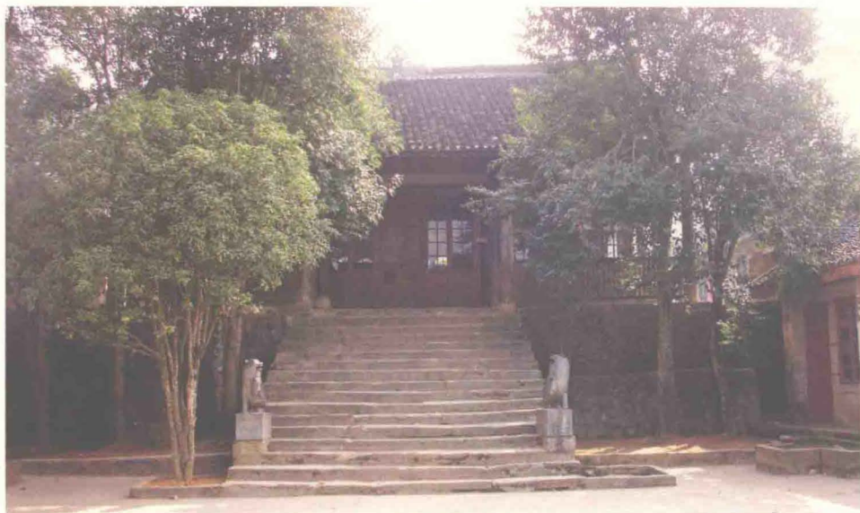
都江堰衙门旧址