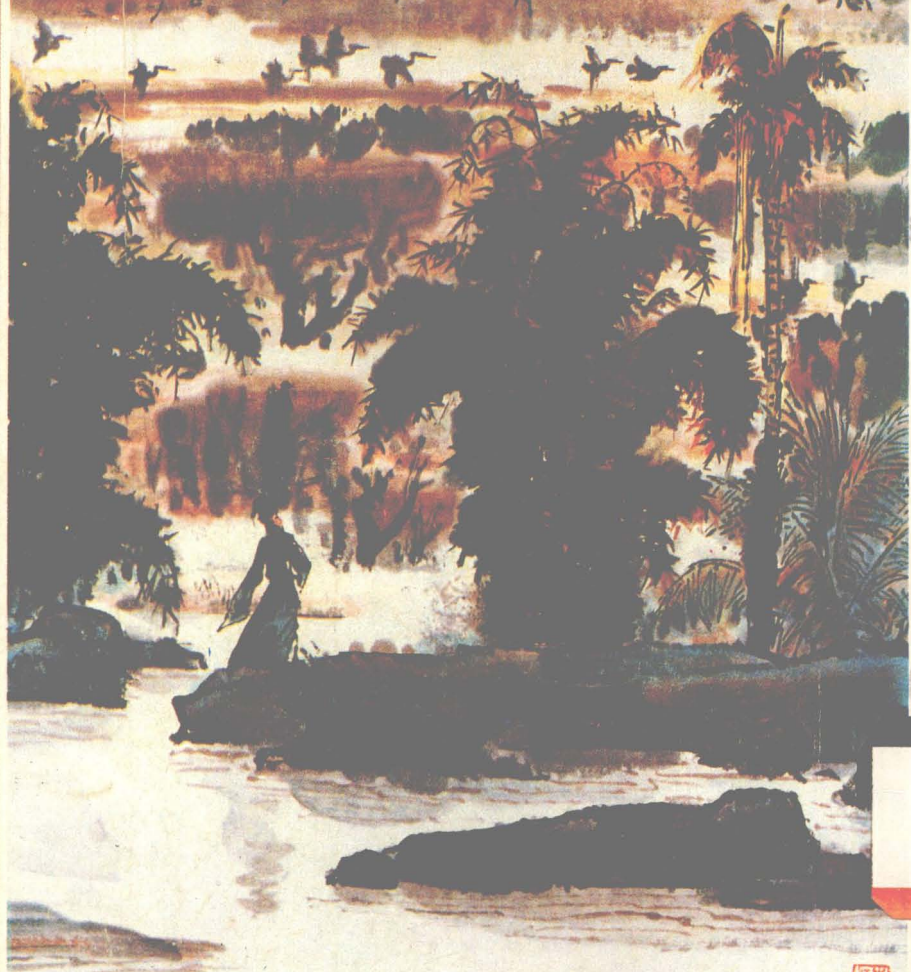
封底畫：蔡于良 海南人民出版社

倦客愁 闻归路 遥眼 长林 贪看 白鹭 横秋浦 不觉青 林湿 晚潮 共暮波 诗河 打良 丁卯 年夏 画于良 村花图新