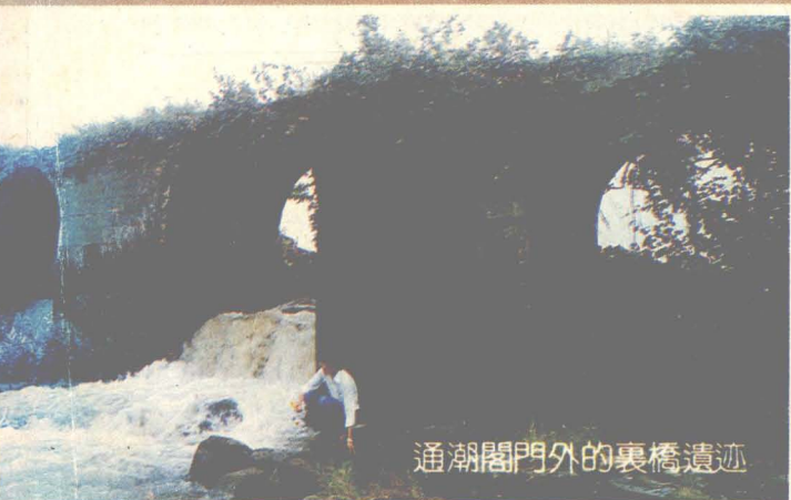
通潮閣門外的裏橋遺迹