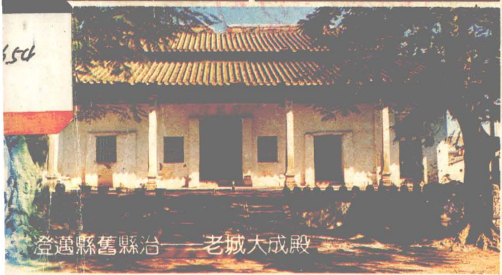
澄邁縣舊縣治——老城大成殿