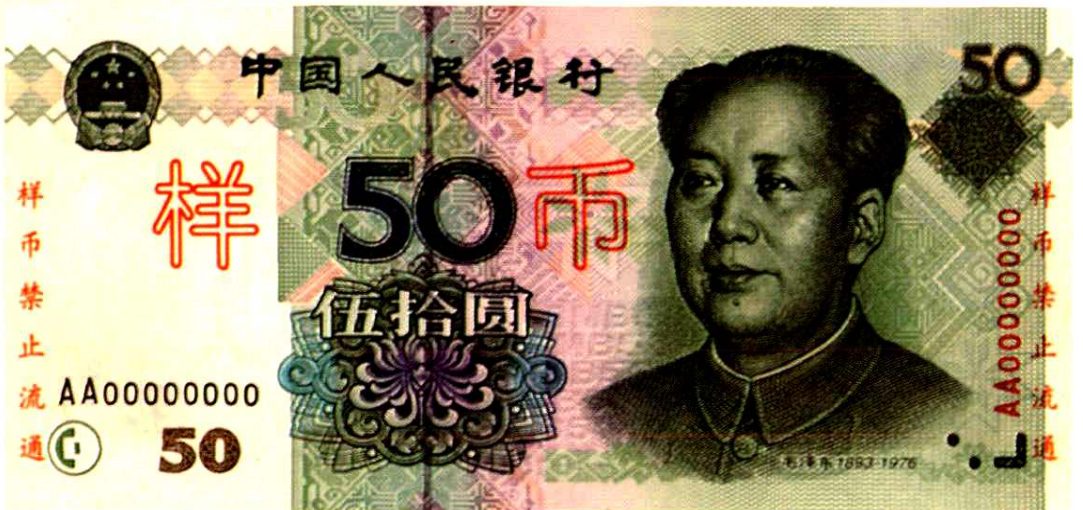
第五套人民币50元券票样