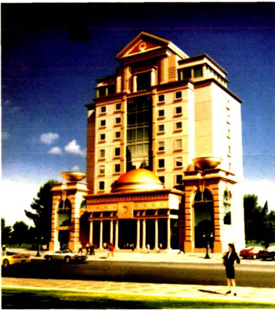
中国农业发展银行遂宁市分行办公大楼