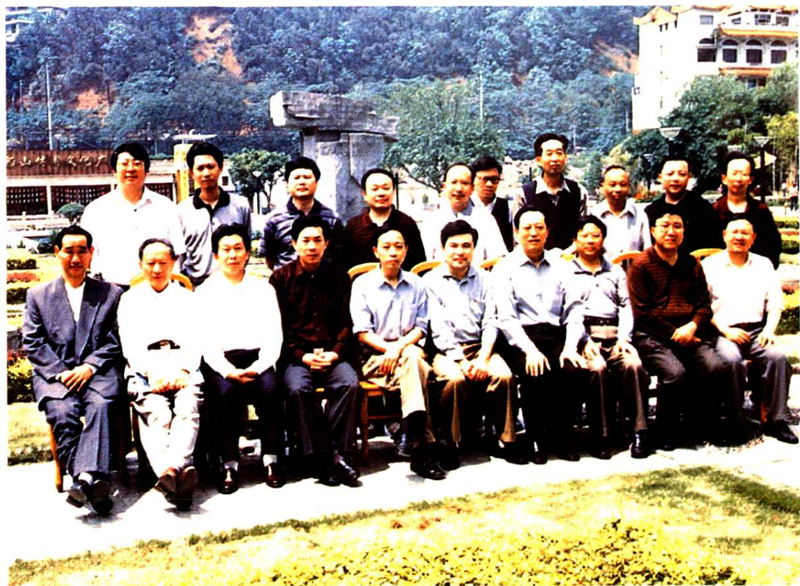
《遂宁市金融志》审定工作会议参会人员合影