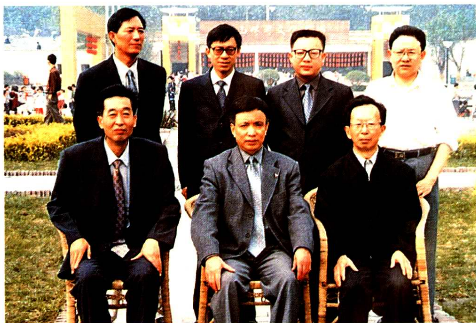
《遂宁市金融志》全体编辑人员合影