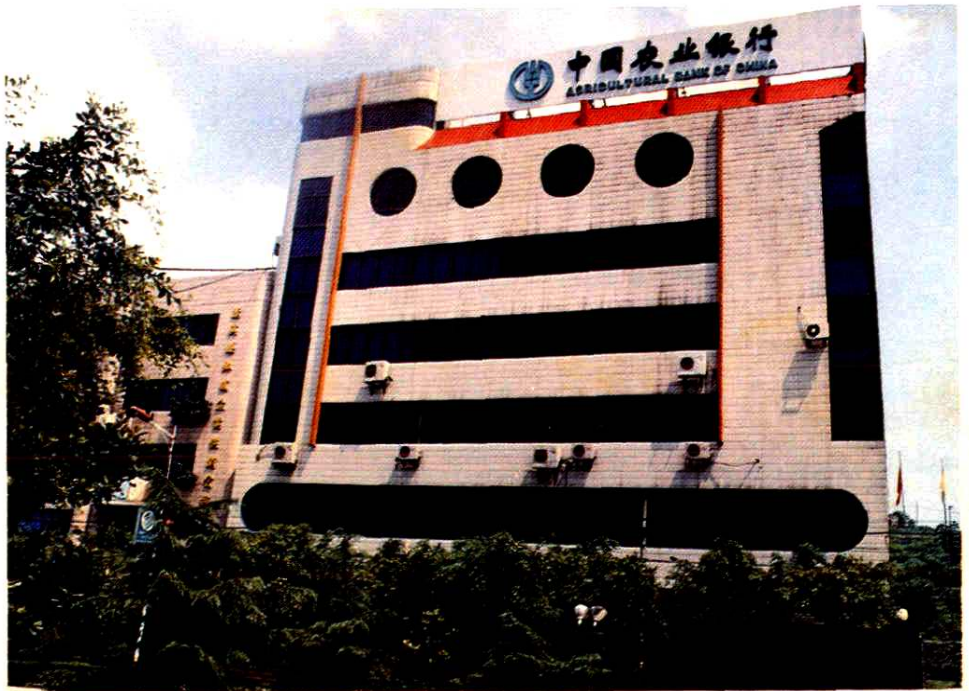
中国农业银行蓬溪县支行办公大楼