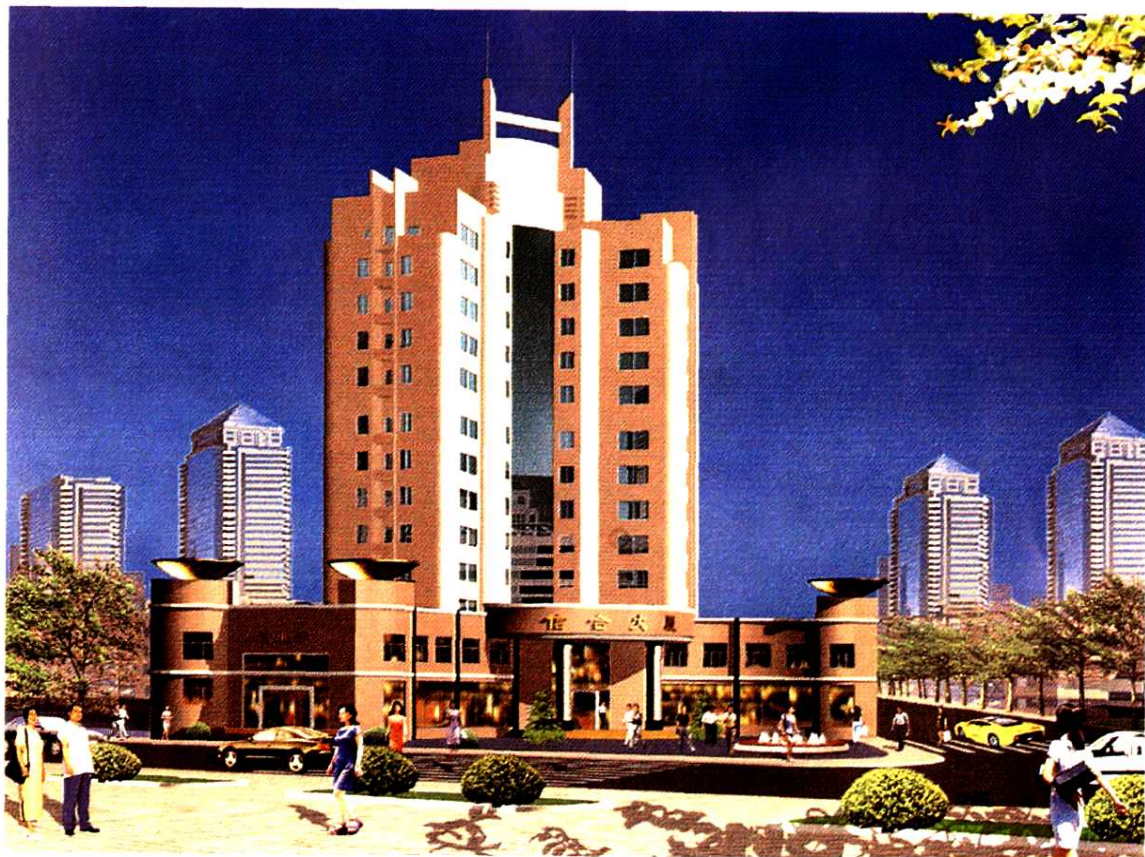
遂宁市中区农村信用联社办公大楼