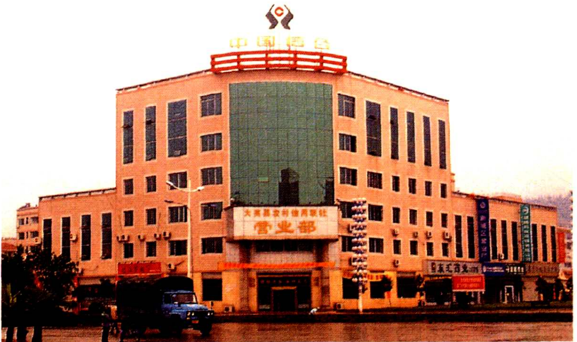
大英县农村信用联社办公大楼