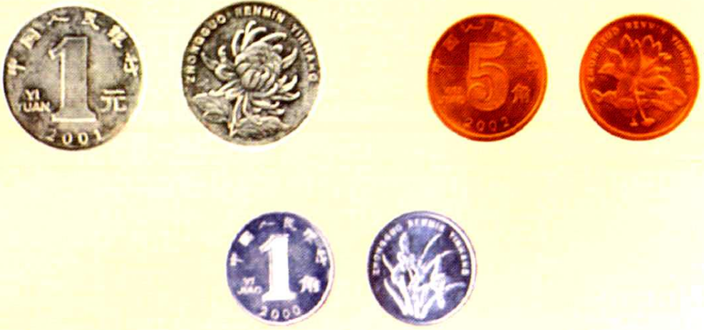
第五套人民币1元、5角、1角硬币图样