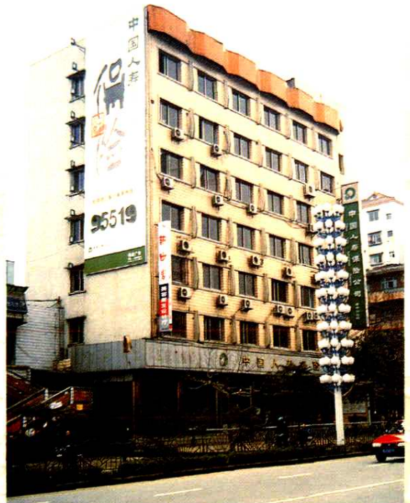
中国人寿保险公司遂宁市分公司办公大楼