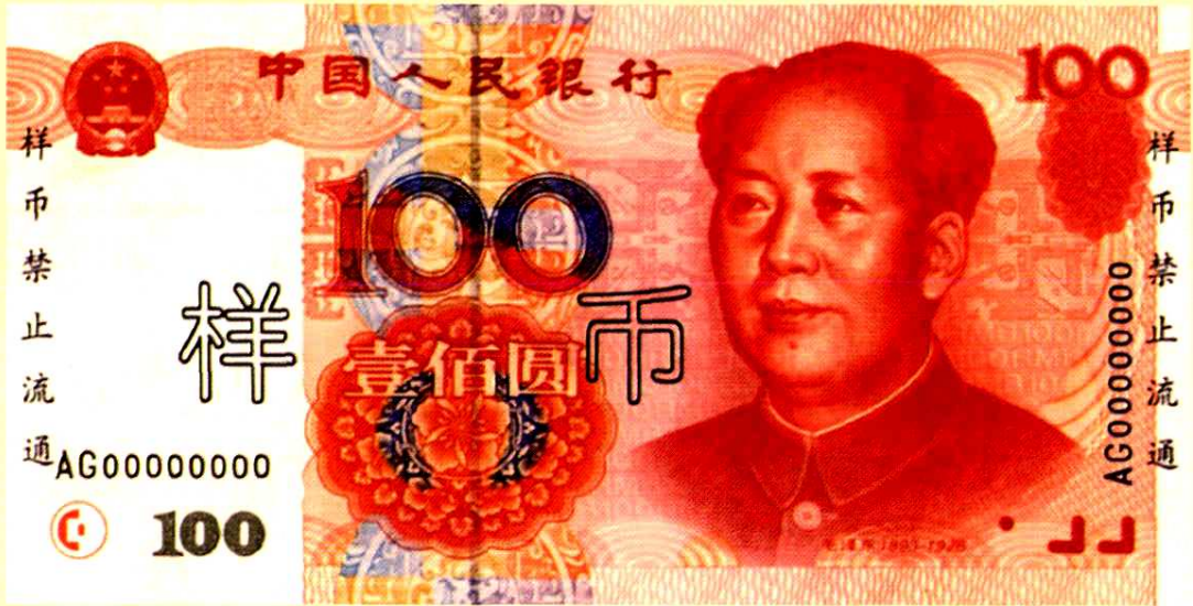
第五套人民币100元券票样