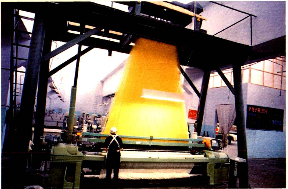
西部首台电子大提花织机在射洪银华公司投产，年可新增利税1653万元，创汇464万美元。