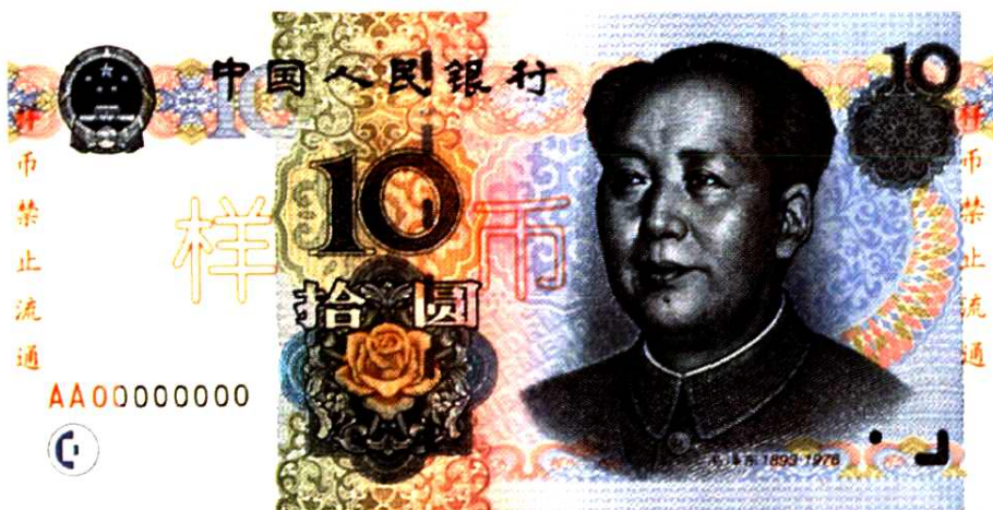
第五套人民币10元券票样