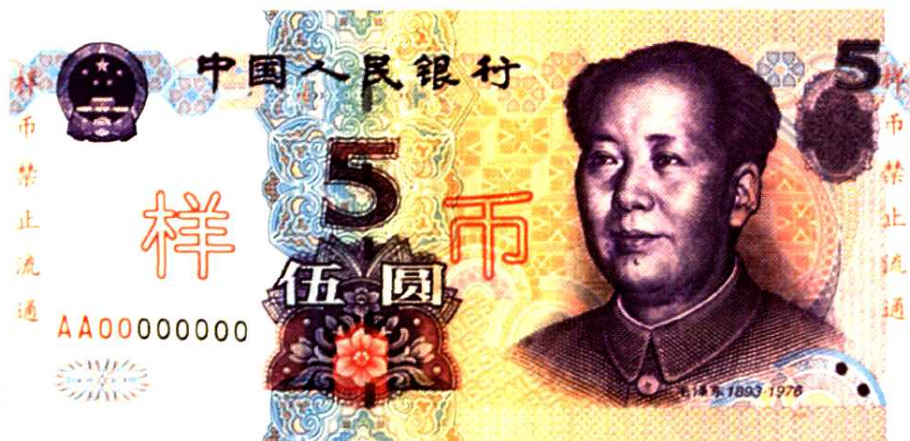
第五套人民币5元券票样