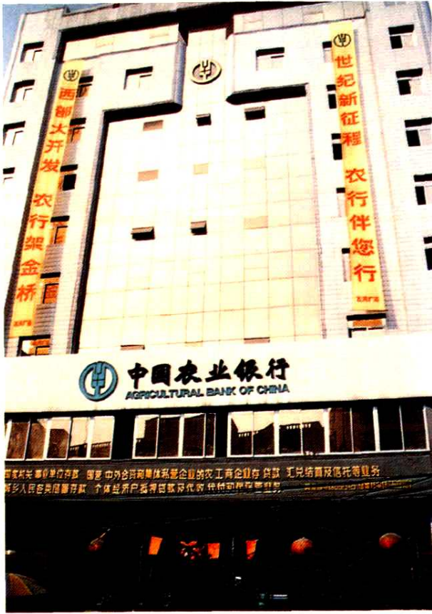
中国农业银行射洪县支行办公大楼