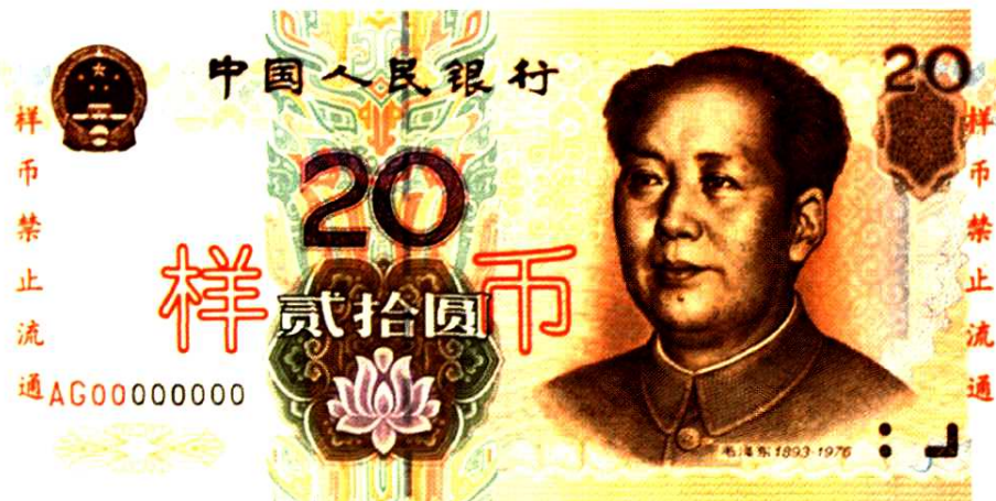
第五套人民币20元券票样