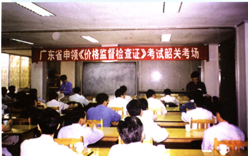
1999年4月，韶关市物价干部参加广东省申领《价格监督检查证》考试。图为韶关考场。