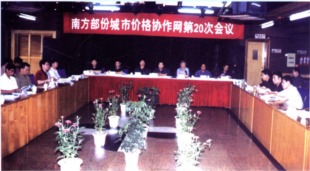
2002年6月，南方部份城市价格协作网第20次会议在韶关市湖心宾馆召开。