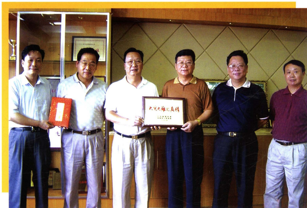
2006年7月，韶关遭遇百年一遇的特大洪灾。广东省物价局全力支持救灾复产、重建家园。图为韶关市副市长朱金雄（左三）向广东省物价局长孙庆奇（左四）授匾，表示感谢。