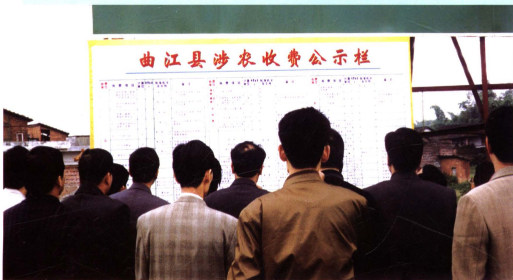
2002年10月，韶关市涉农价格和收费公示工作会议在曲江县召开。图为群众观看收费公示栏。