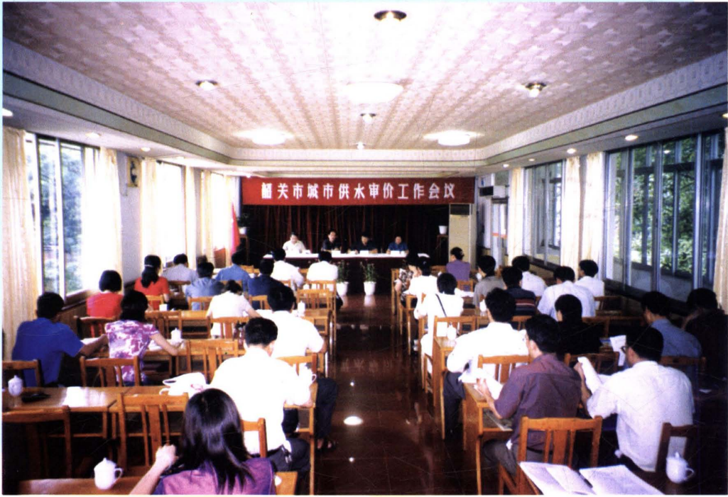
2002年6月，韶关市物价局召开城市供水审价工作会议。