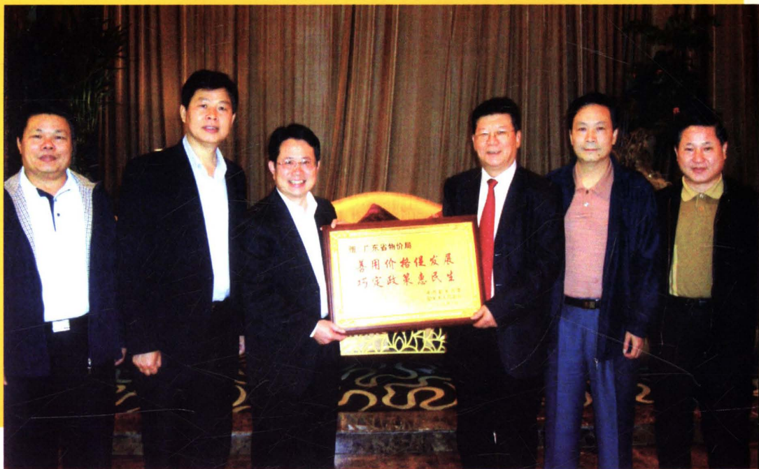
市委副书记、市长郑振涛向省物价局局长孙庆奇赠送匾牌，感谢省物价局运用价格政策大力支持韶关经济社会发展。