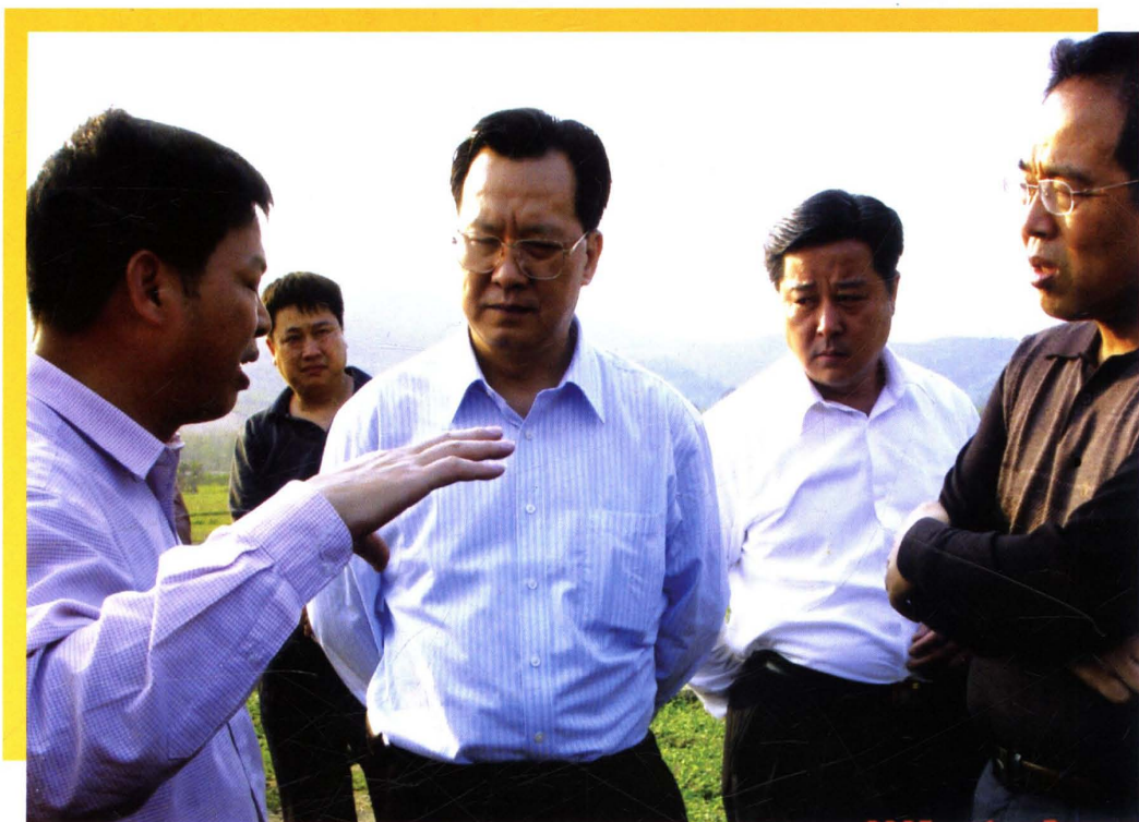
韶关市人大常委会副主任朱金雄（右三）、广东省物价局副局长马壮昌（右一），深入基层，了解农产品价格。