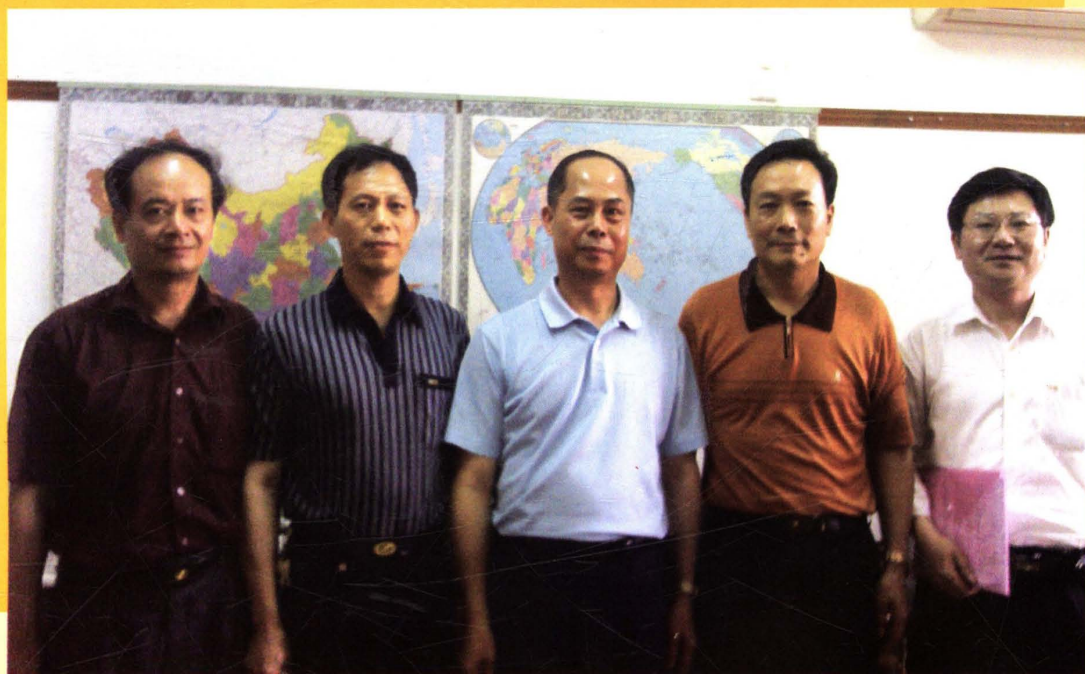
市政协主席邓苏夏听取市物价局领导关于办理政协委员提案情况汇报。