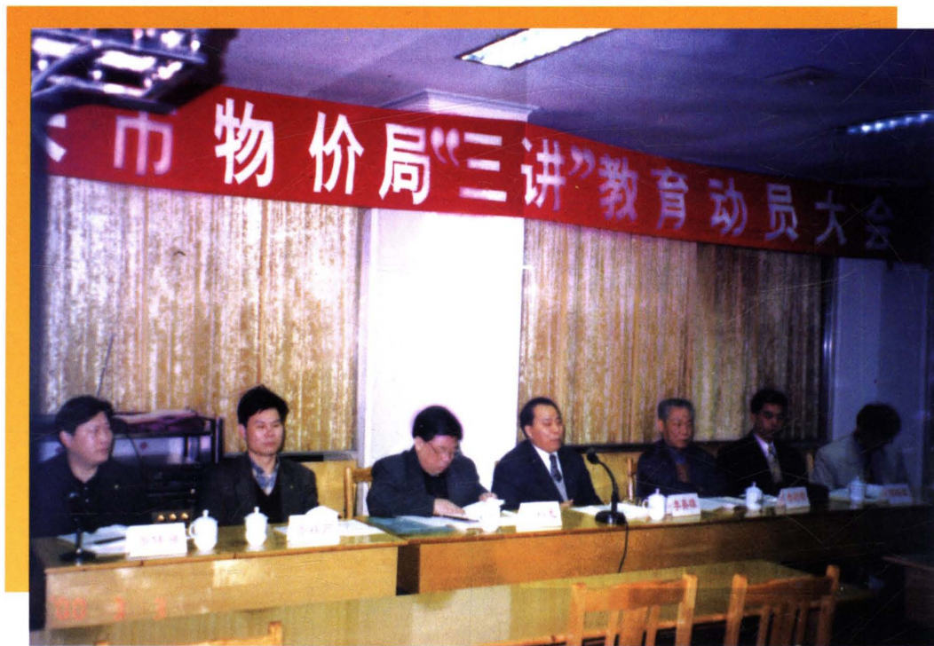
2000年3月，韶关市物价局开展“三讲”教育。