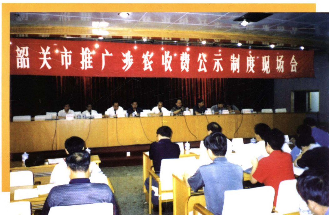
2000年8月，韶关市物价局在南雄召开“推广涉农收费公示制度”现场会。