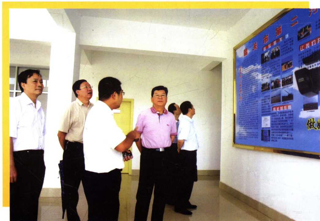
广东省物价局孙庆奇局长到韶关开展“运用价格杠杆，促进资源节约和环境保护”课题的调查研究工作。图为孙庆奇局长（左四）在韶关市第二污水处理厂。