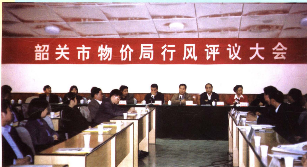
2002年11月，韶关市物价局行风评议大会在市政府201室召开。