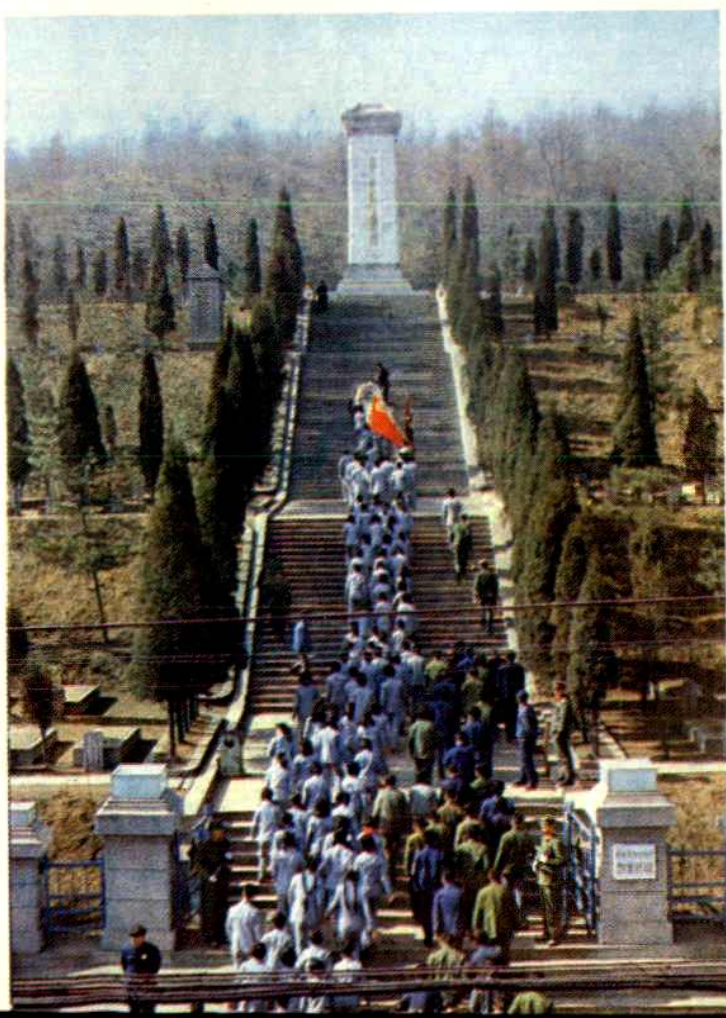
抗美援朝烈士陵园