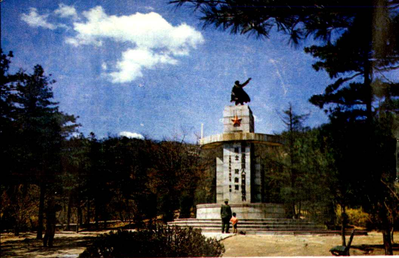
辽东解放烈士纪念塔