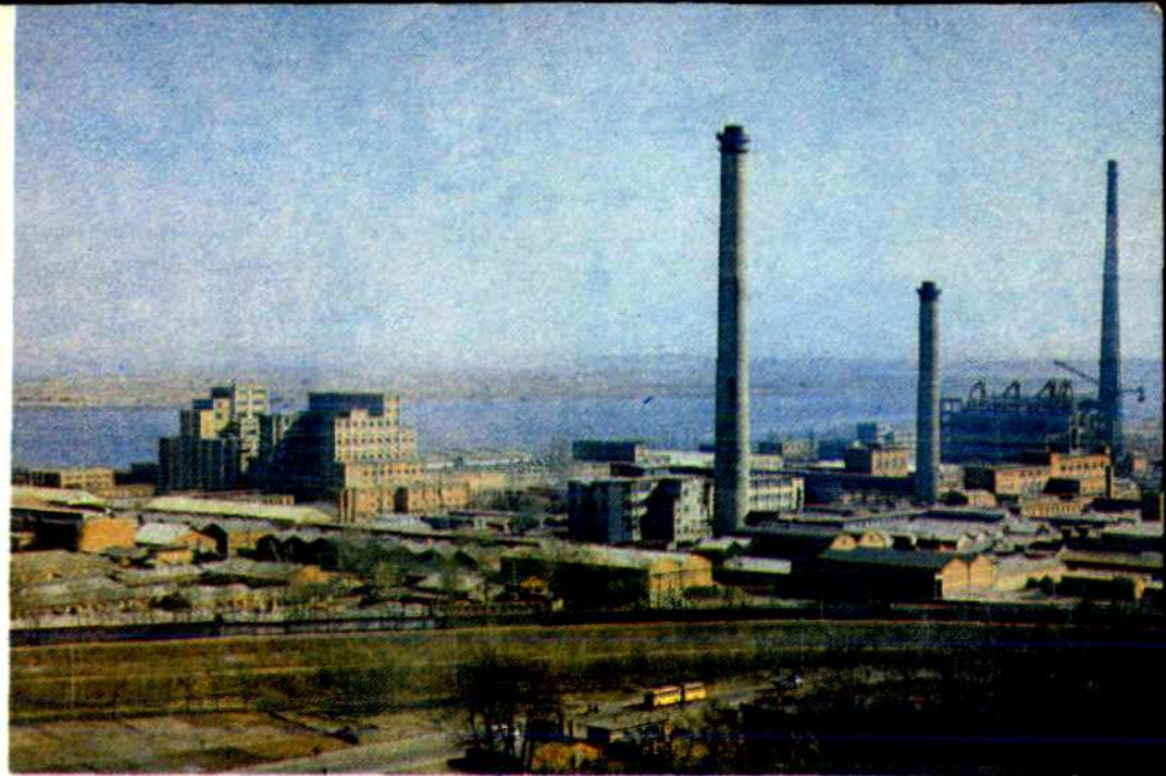
丹东化学纤维工业公司