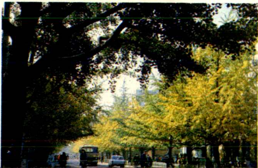
丹东市树 — 银杏树