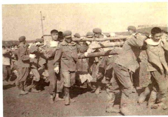
人拉肩扛建设工厂