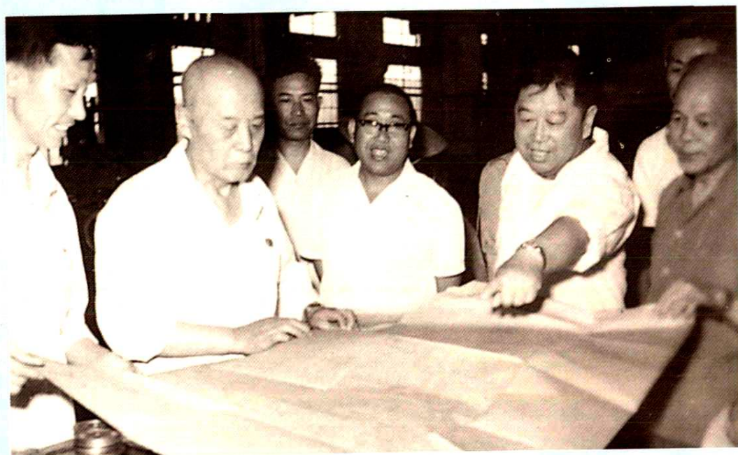
铁道兵司令员吕正操(左二)乘专列到厂视察