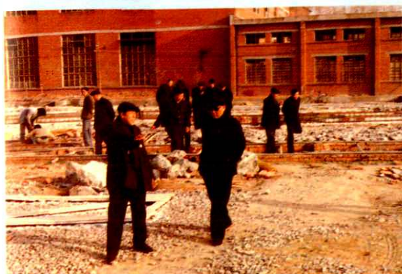
铁道部部长尚志功(右三)为改扩建事宜到厂