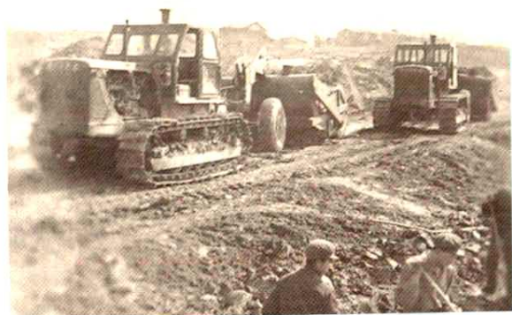
1969年11月7日,建厂工程破土动工