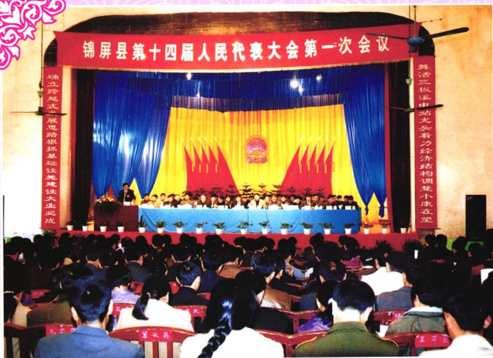
锦屏县十四届人大一次会议主席台