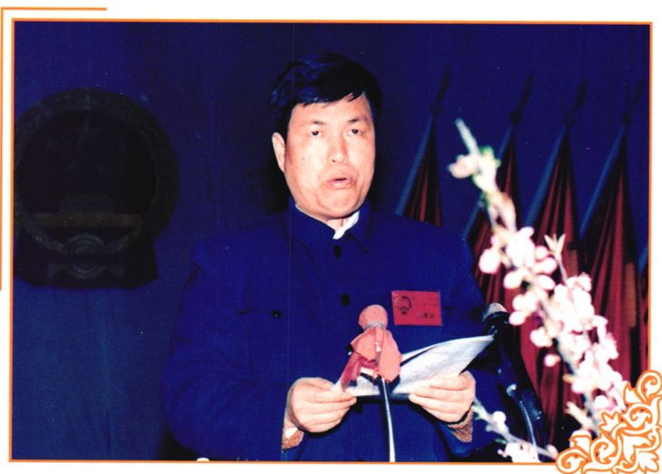
县十二届人大二次会议县人大主任龙秀渊作人大工作报告