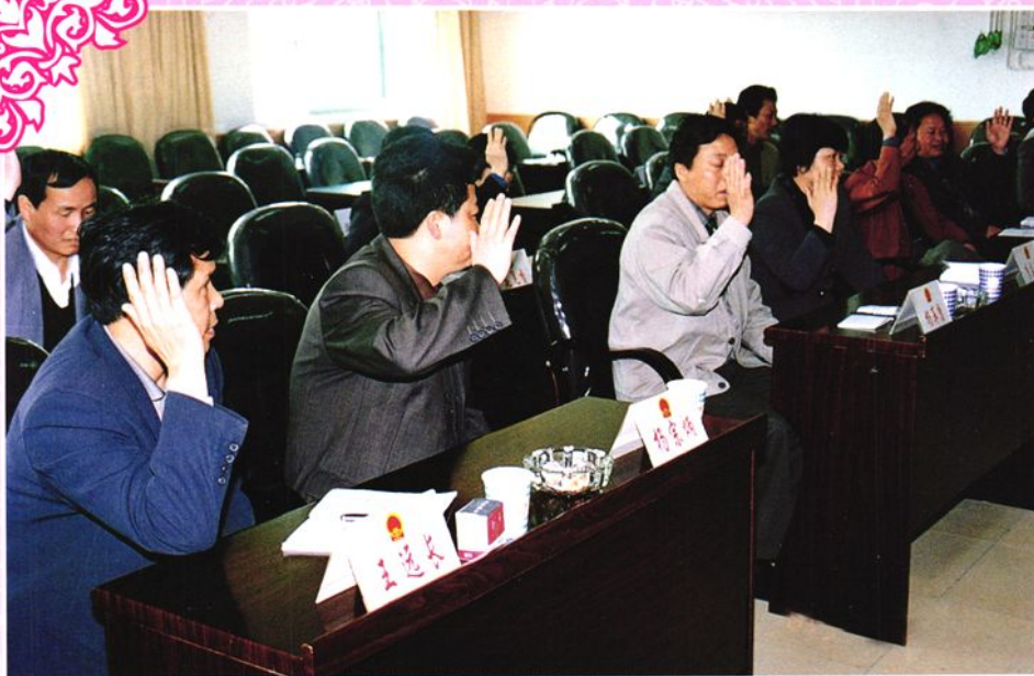
锦屏县十四届人大常委会委员表决