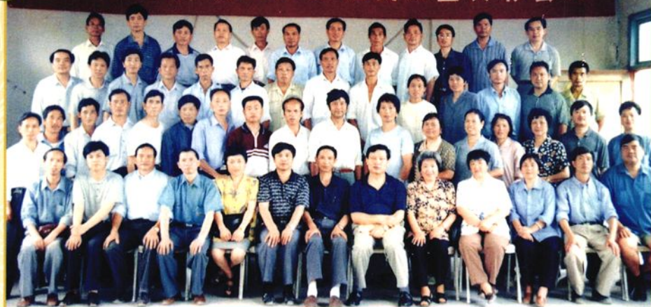
锦屏县第十三届人大代表工作经验交流暨表彰会议合影