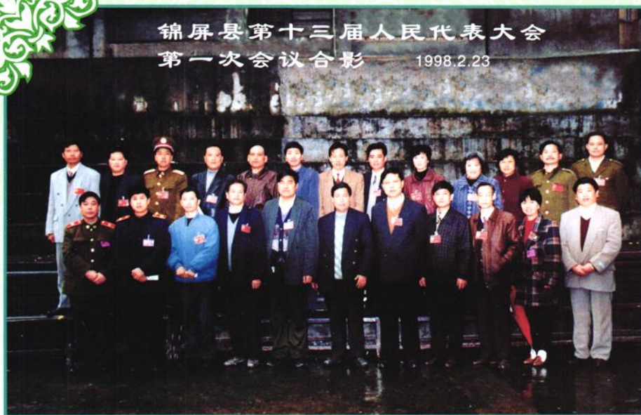
锦屏县第十三届人民代表大会 第一次会议合影 1998.2.23