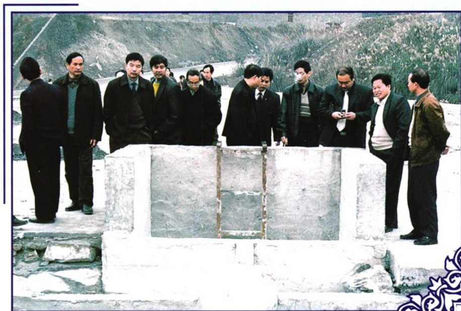
锦屏县第十四届人大代表视察三板溪电站打砂场过滤池污水处理情况