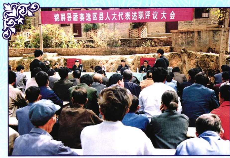
锦屏县潘寨选区县人大代表述职评议大会