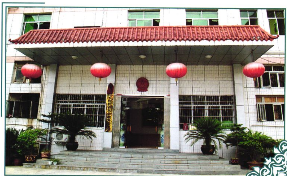
锦屏县人大常委会新办公楼