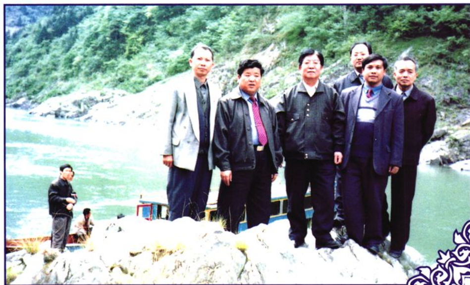
1998年8月20日，省人大副主任龚贤永视察三板溪电站坝址时与县领导合影