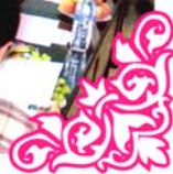
纪念人民代表大会成立50周年座谈会