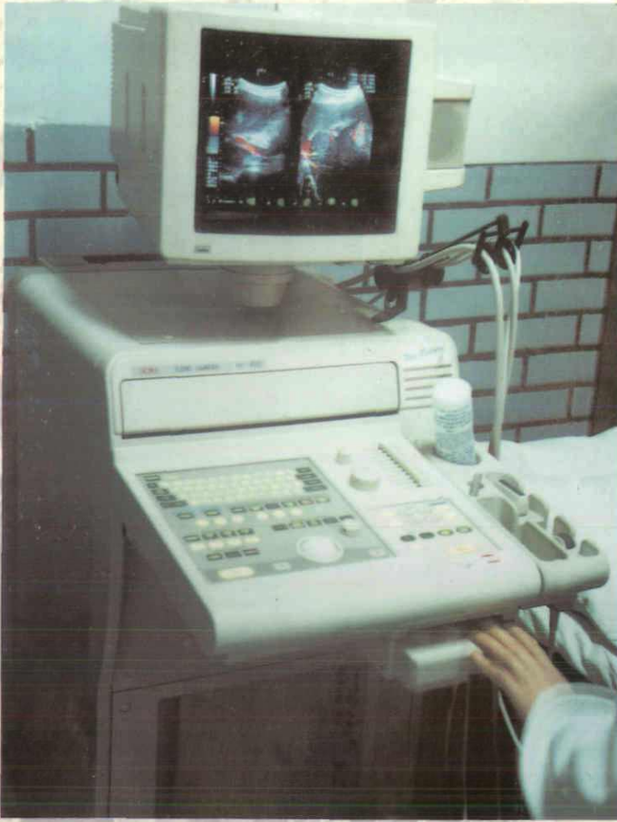
彩色多普勒超声诊断仪检查