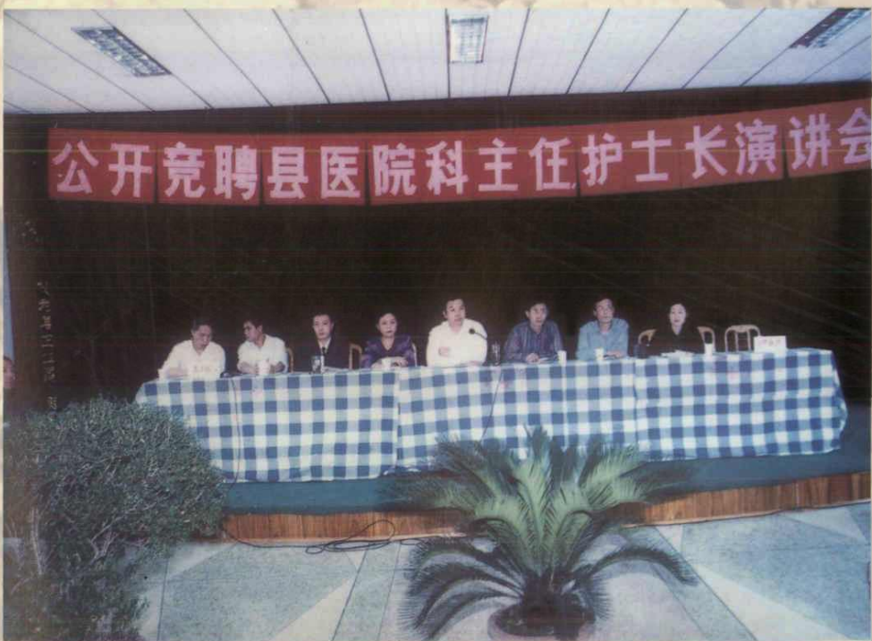
公开竞聘县医院科主任护士长演讲会