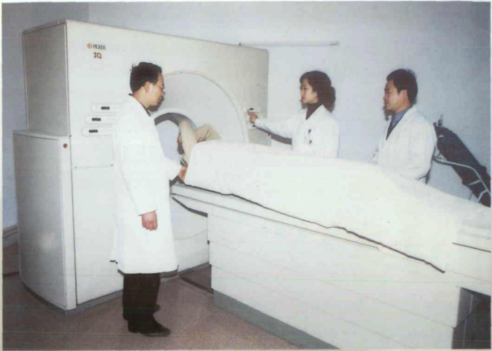
美国 MAKE 公司 PICKER 全身 CT 扫描仪