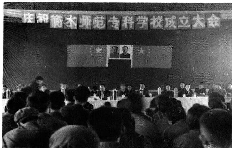
1979年10月15日,衡水师范专科学校成立大会在前磨头旧校址隆重举行