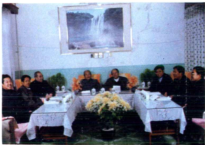
衡水师专现任领导班子 (1991年)和《校志》部分编委