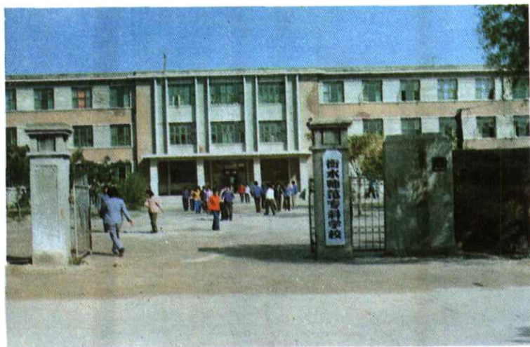
衡水师专旧校址大门及教学主楼(1979年—1987年)