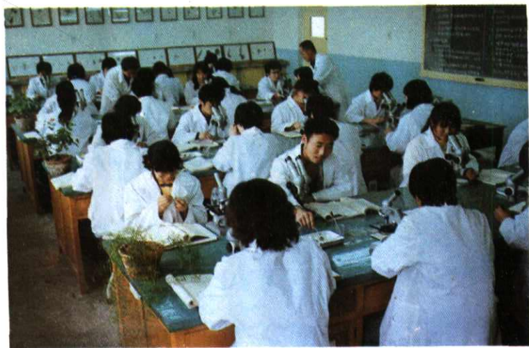
师生在进行植物实验