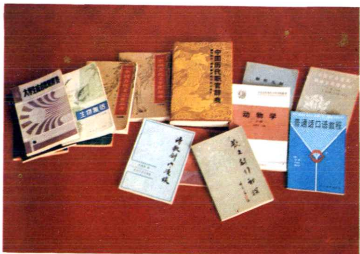
部分专著和科研成果