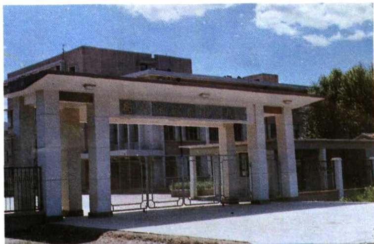
衡水师专新校址校门