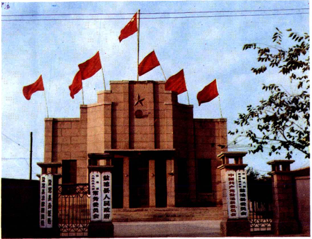
盐池县党政机关驻地