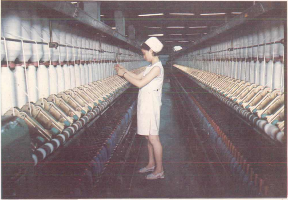
达县地区棉纺织染厂车间之一