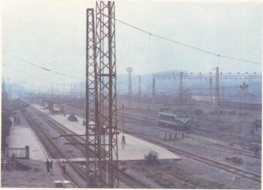
达县火车站车道及站台