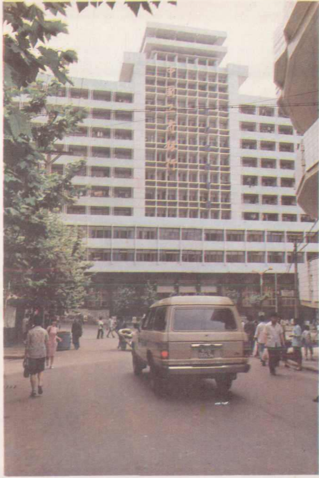
中国工商银行大楼