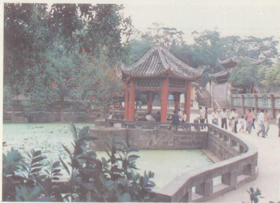
达县市人民公园一角