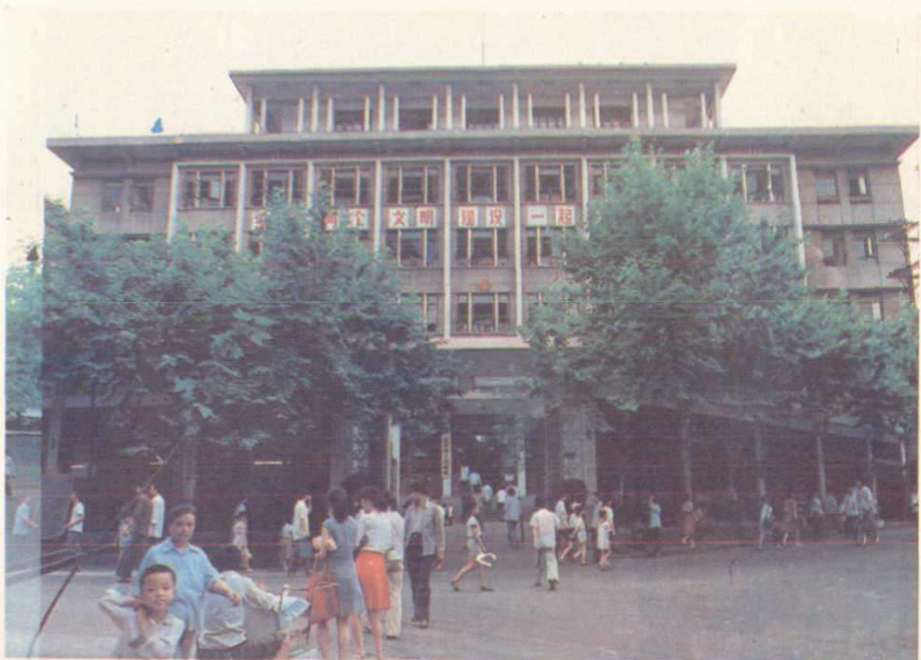
达县市人民政府大楼