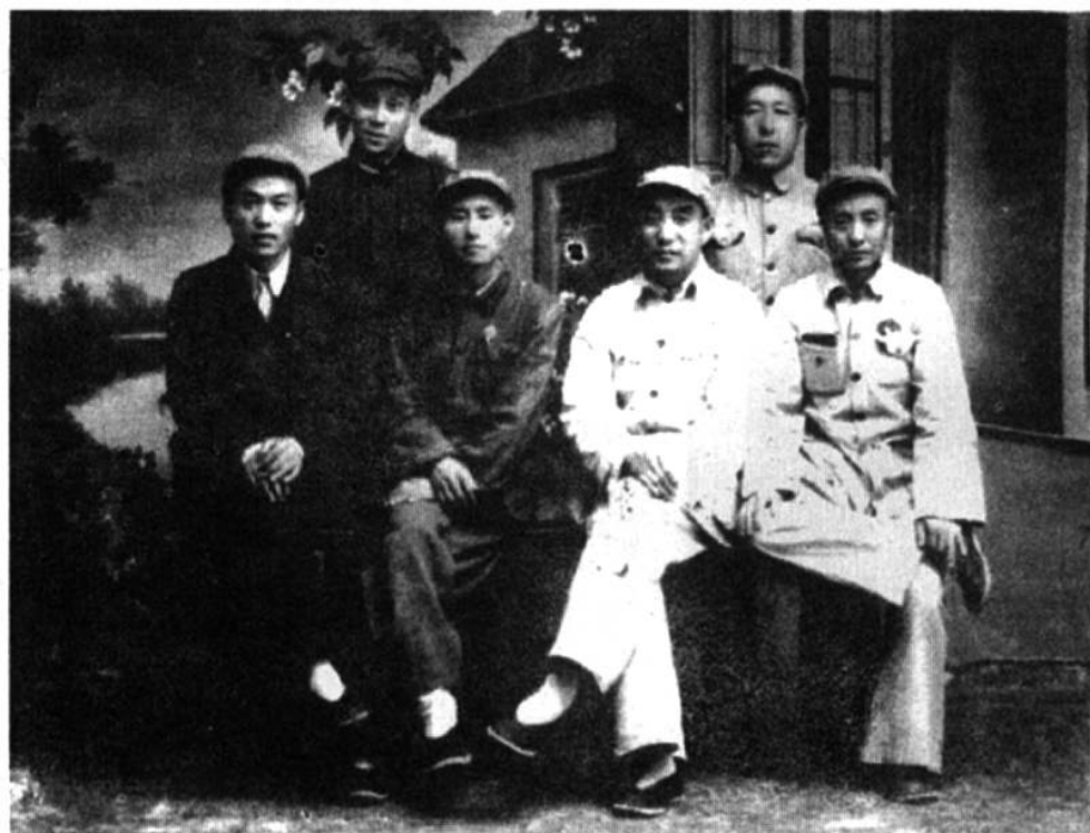
1949年初河津县委部分成员