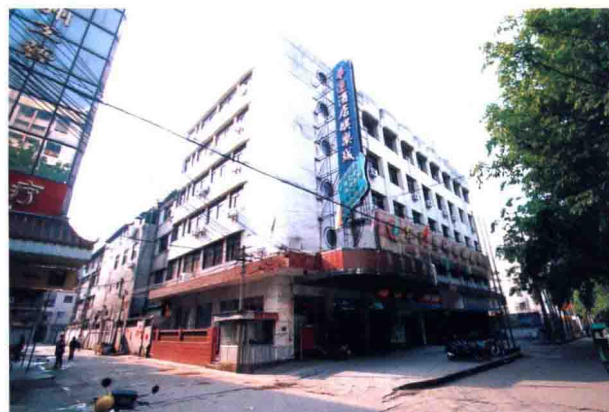
梅州市华侨商品供应公司大楼