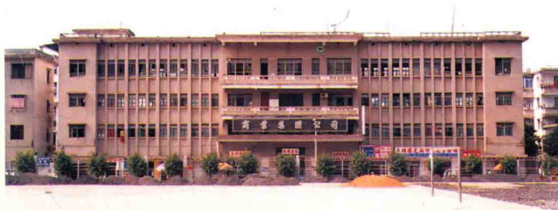
大埔县商业局办公楼