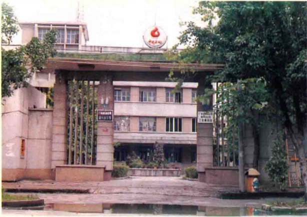
广东省梅州石油公司门楼