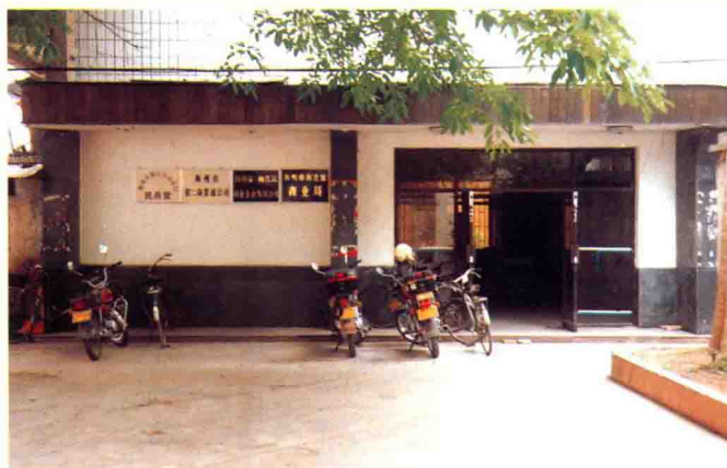
梅江区商业局门楼