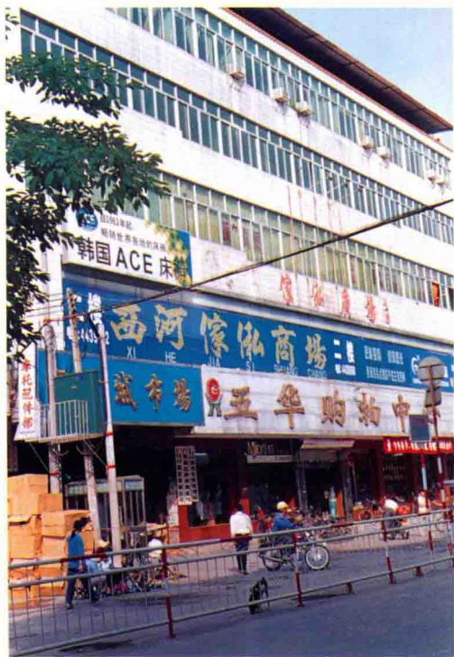
五华县商业局大楼