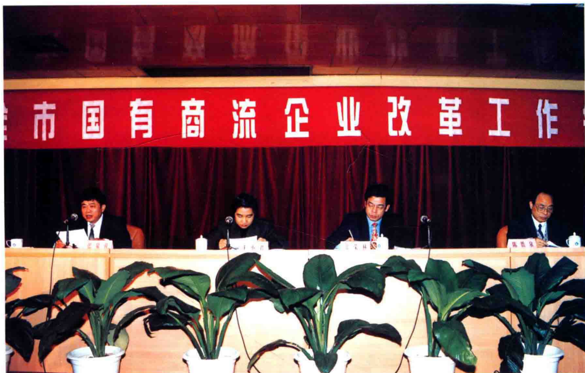
梅州市人民政府 2001 年全市国有商流企业改革工作会议