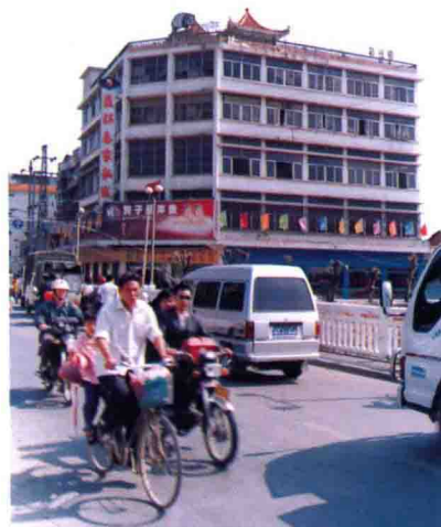
梅州市纺织品公司大楼