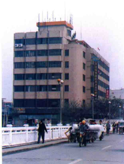
梅州市商业企业集团工业品公司(原化工公司)大楼