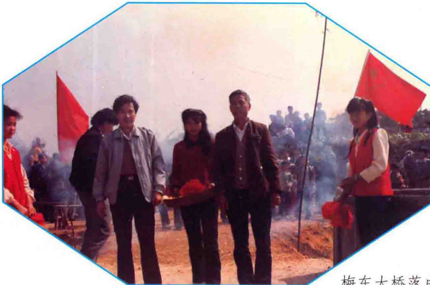
梅东大桥落成剪彩