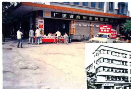
梅州市糖烟酒 公司大楼