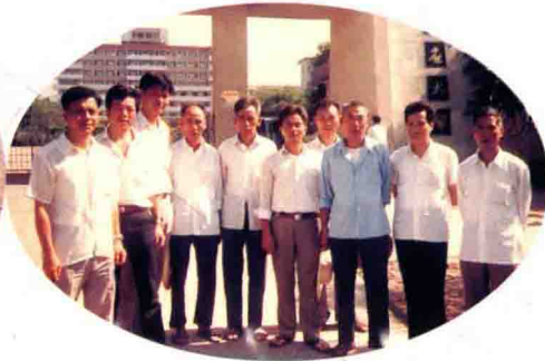
梅州市商业局扶贫工作组带五华梅林梅东管理区干部参观嘉应大学