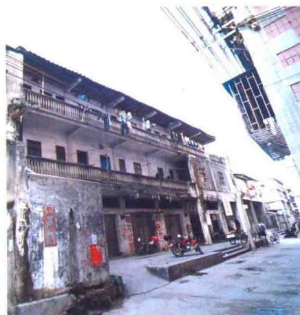
梅州市商业储运公司