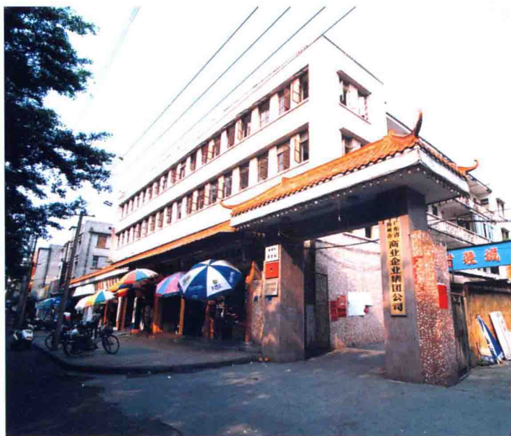
梅州市商业局 (集团公司) 大楼