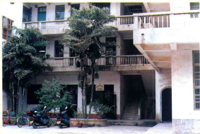
蕉岭县商业局办公楼