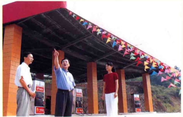
广东省梅州石油公司领导检查加油站工作