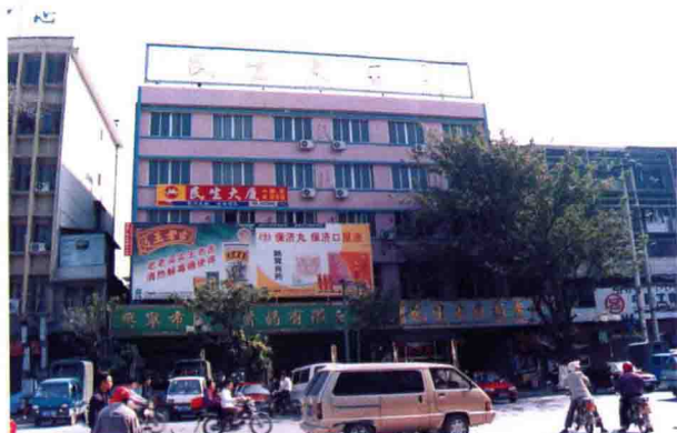
梅州市百货公司大楼