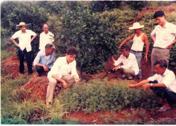
梅州市商业局扶贫工作组带五华梅林梅东管理区干部参观丙村牧草