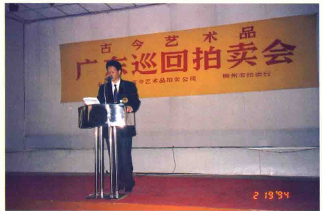
梅州市拍卖行领导主持拍卖会