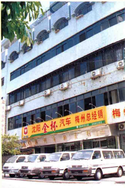
梅州市拍卖行大楼