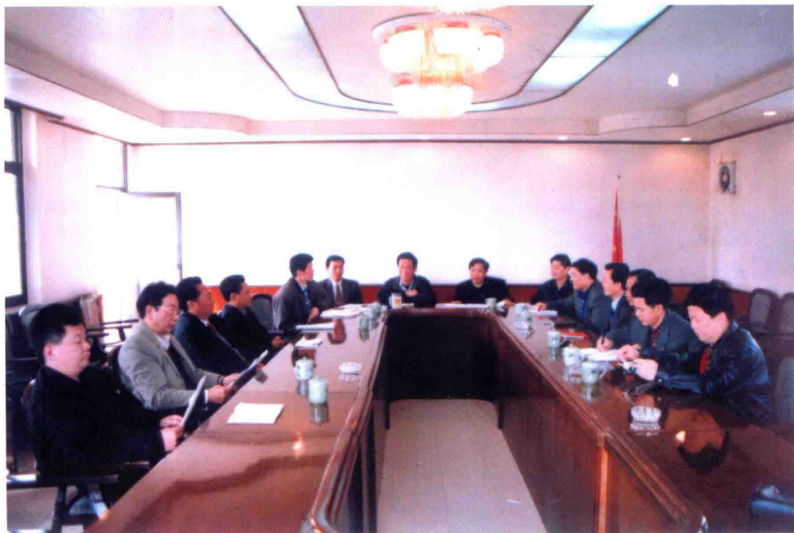
梅州市商业企业集团公司现任班子和市直公司经理研究改革工作