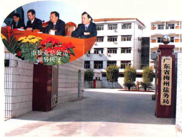
梅州市盐业总公司