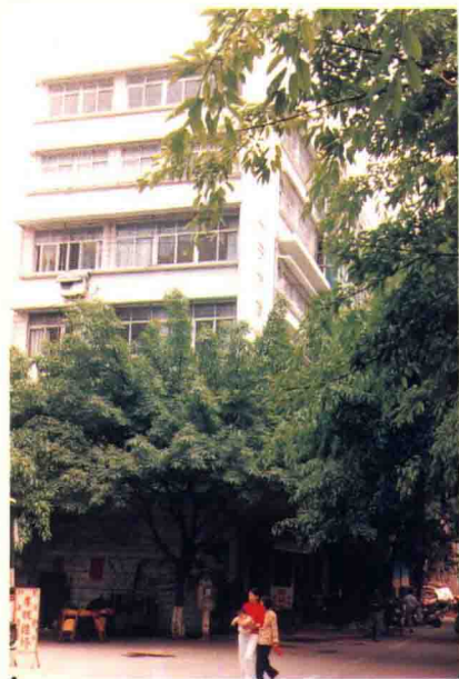
兴宁市商业局办公楼