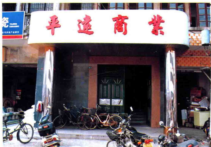
平远县商业总公司门楼