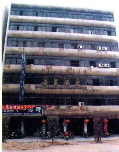
丰顺县商业局办公楼