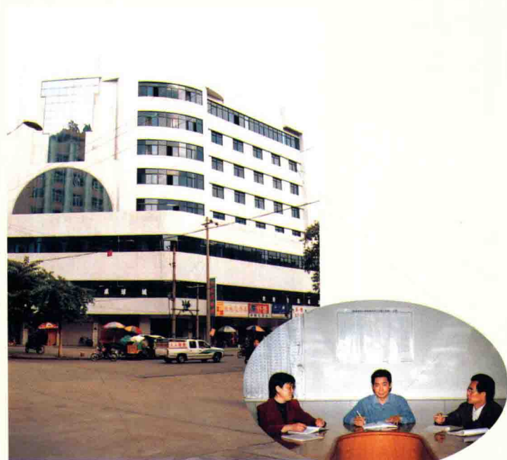
梅县商业局办公楼