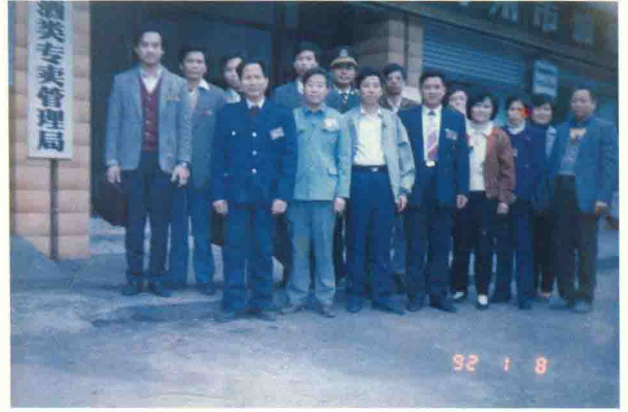
参加梅州市酒类专卖管理局年会人员留影