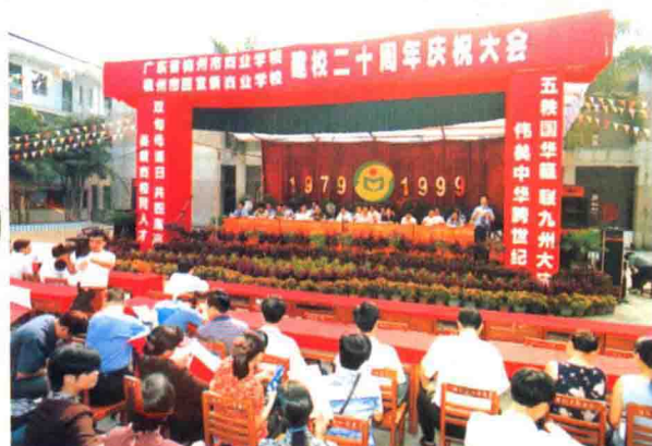
梅州市商业学校建校二十周年庆典