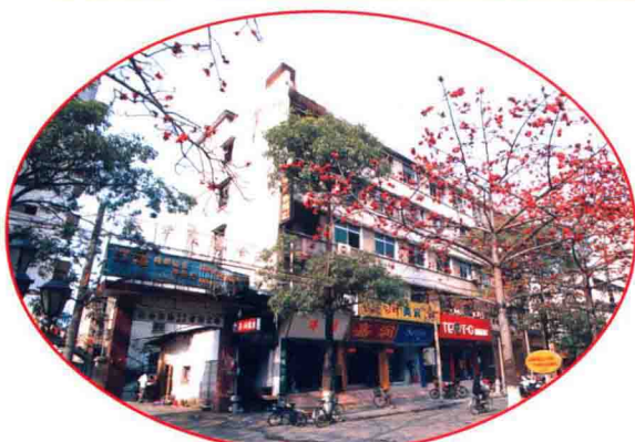
梅州市友谊公司大楼