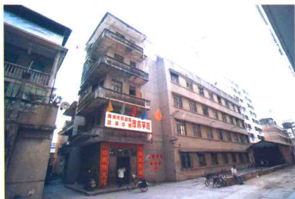
梅州市食品公司办公大楼