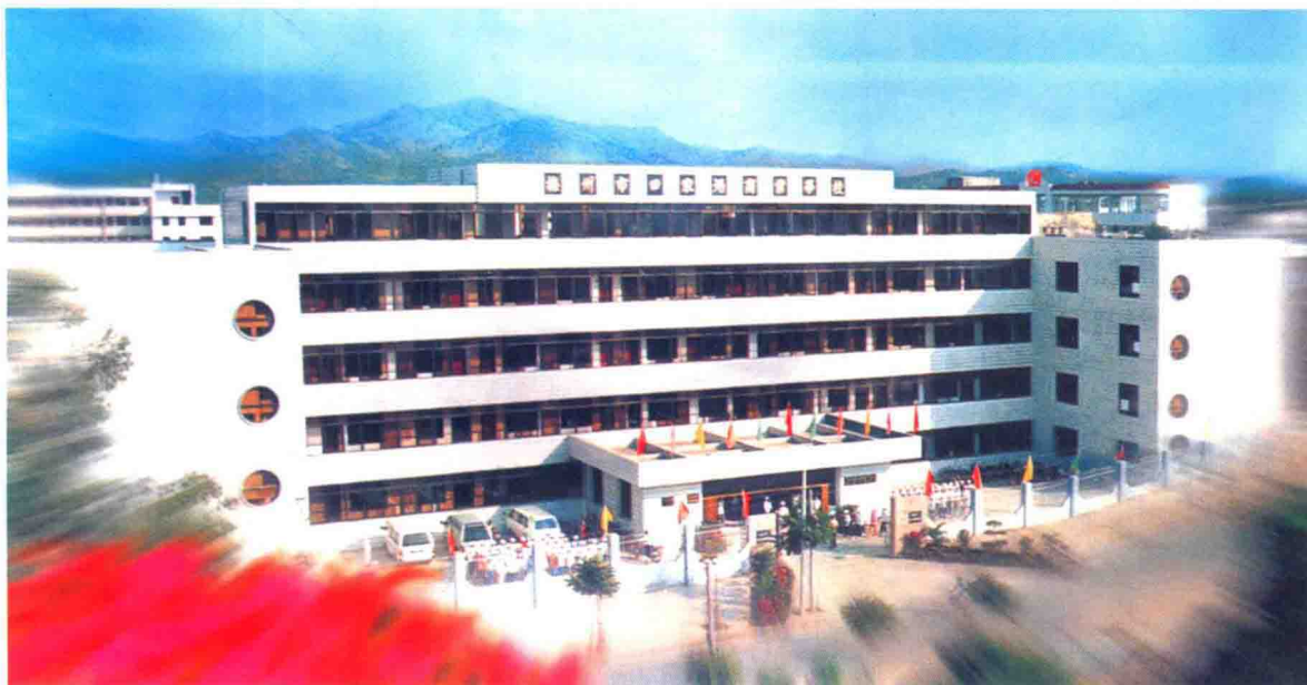
梅州市田家炳商业学校