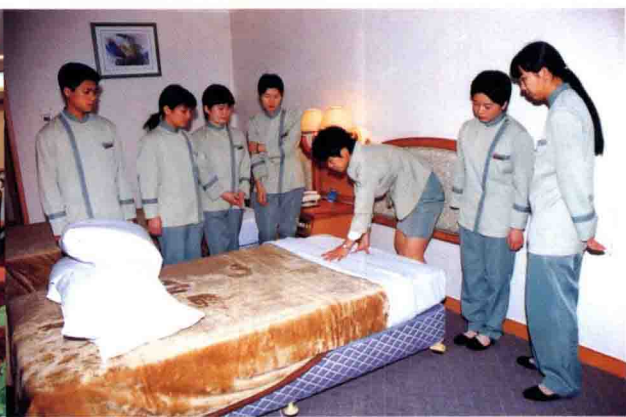
梅州市商业学校学生在星级宾馆实习