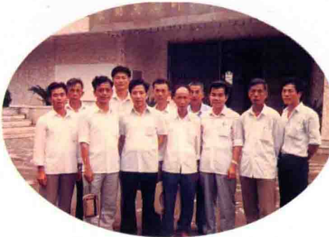
梅州市商业局扶贫工作组带五华梅林梅东管理区干部参观叶帅故居