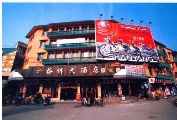
梅州市饮食服务公司梅州大酒店