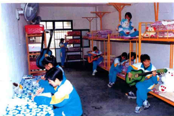
④、⑤、⑥、⑦为梅州市商业学校学生丰富的业余文体生活