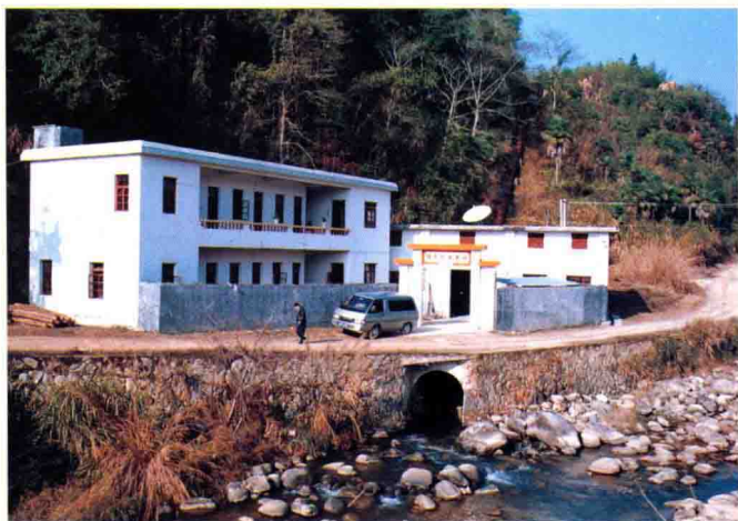
平远县商业总公司观音官水电站