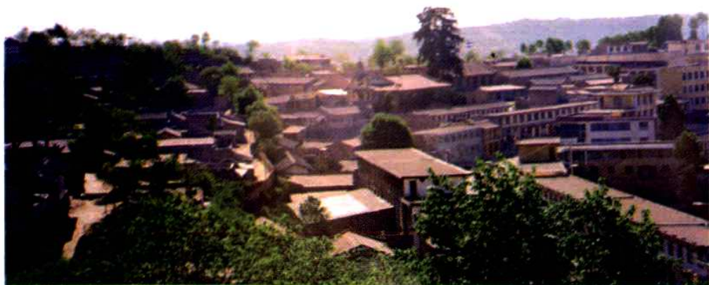
东乡县城外景一角