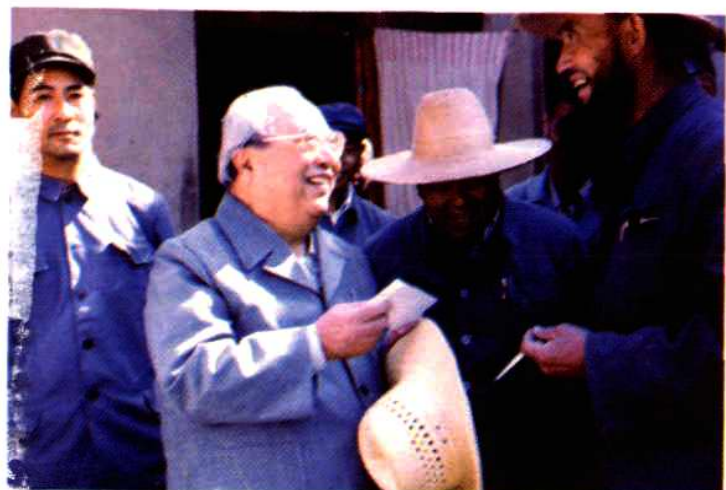
全国人大常委会副委员长费孝通（左二）1986年视察东乡族自治县，同东乡族农民亲切交谈。（右二为当时的东乡族自治县县委书记安文胜）