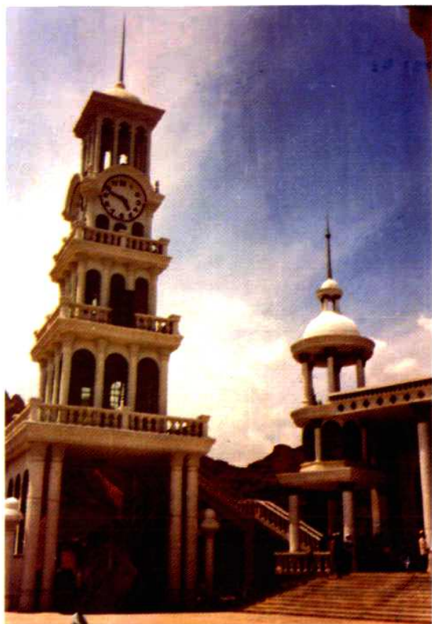
东乡清真大寺一角