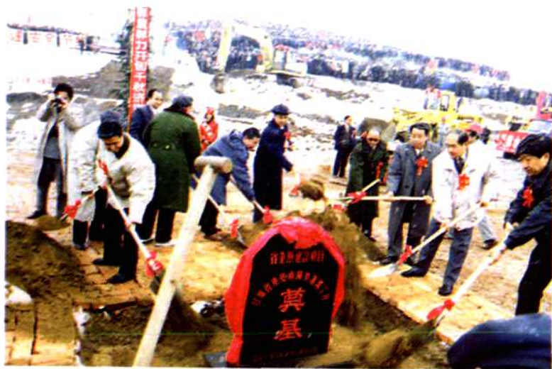
1995年11月，东乡南阳渠灌溉工程奠基仪式