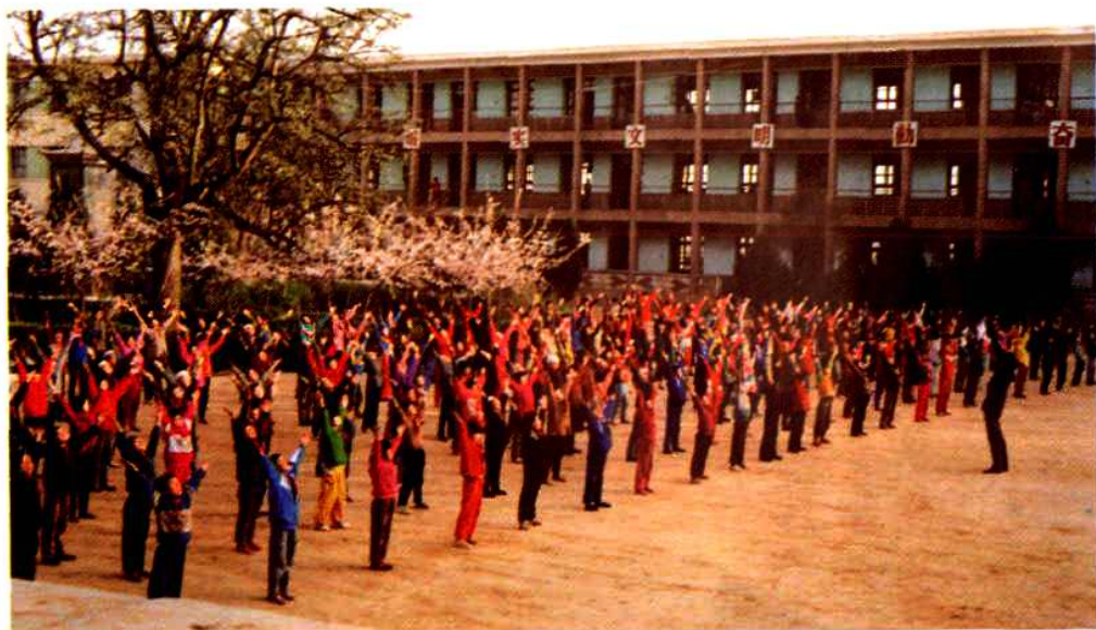
唐汪社会各界人士捐资修建 的第一所小学——唐汪回民小学