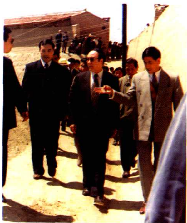
· 艾买提（中）于1990年3月7日 时任国家民委主任的司马义 在东乡族自治县视察工作