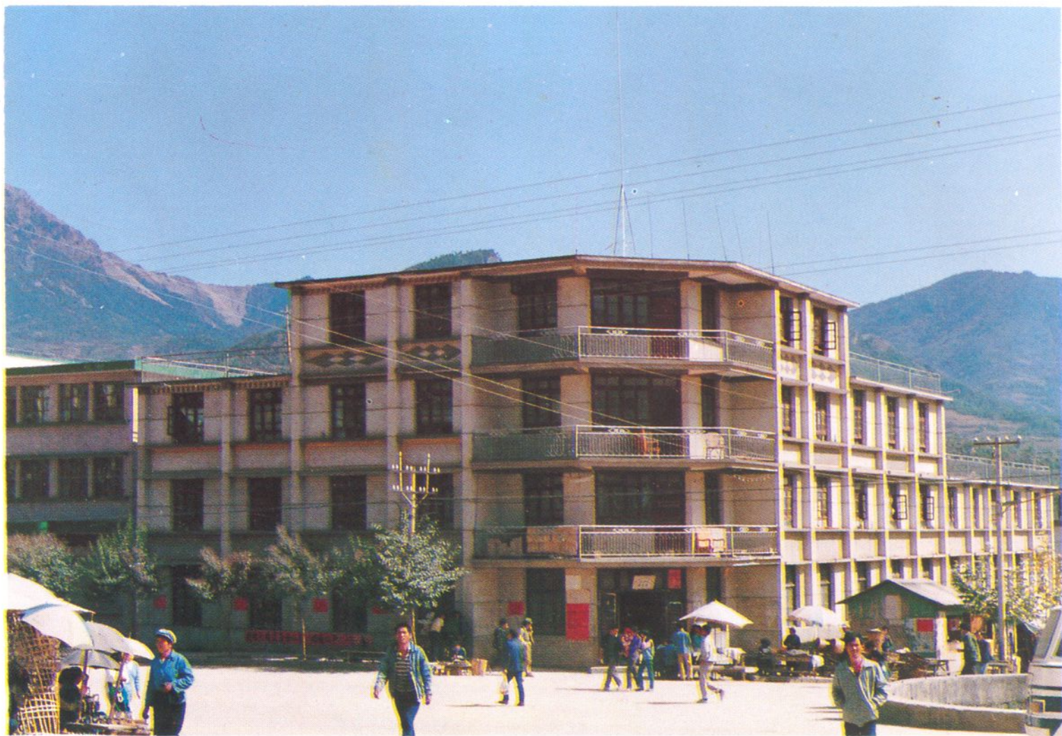
▲ 兰坪县粮食局办公楼