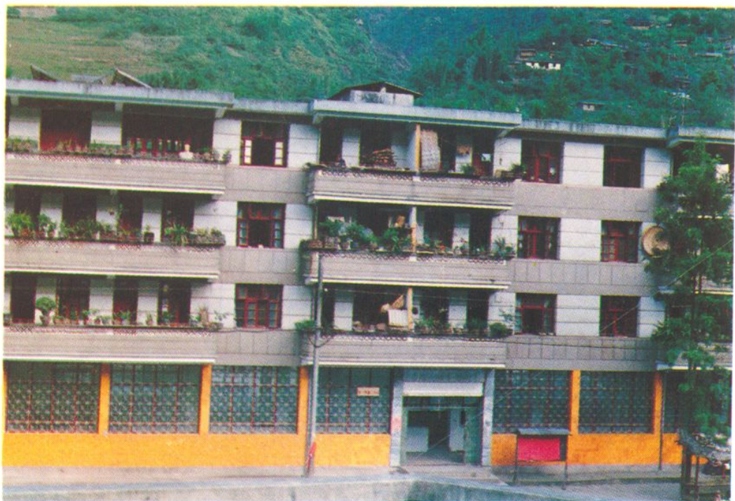
◀ 贡山县粮食局综合服务楼