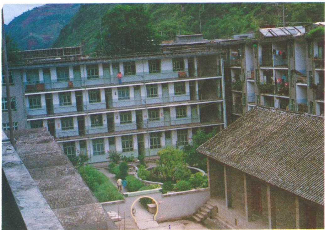
▲ 泸水县粮食局院落