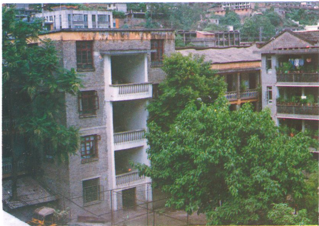
▲ 怒江州粮食局院落