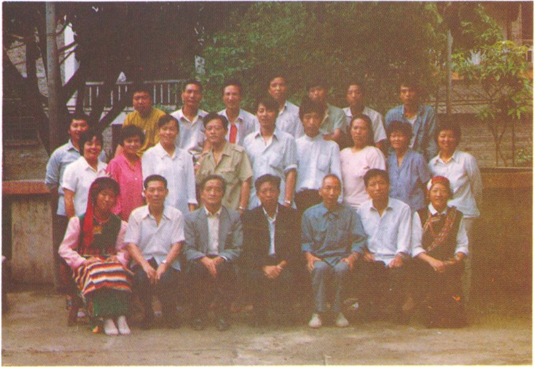
▲ 怒江州粮食局职工合影