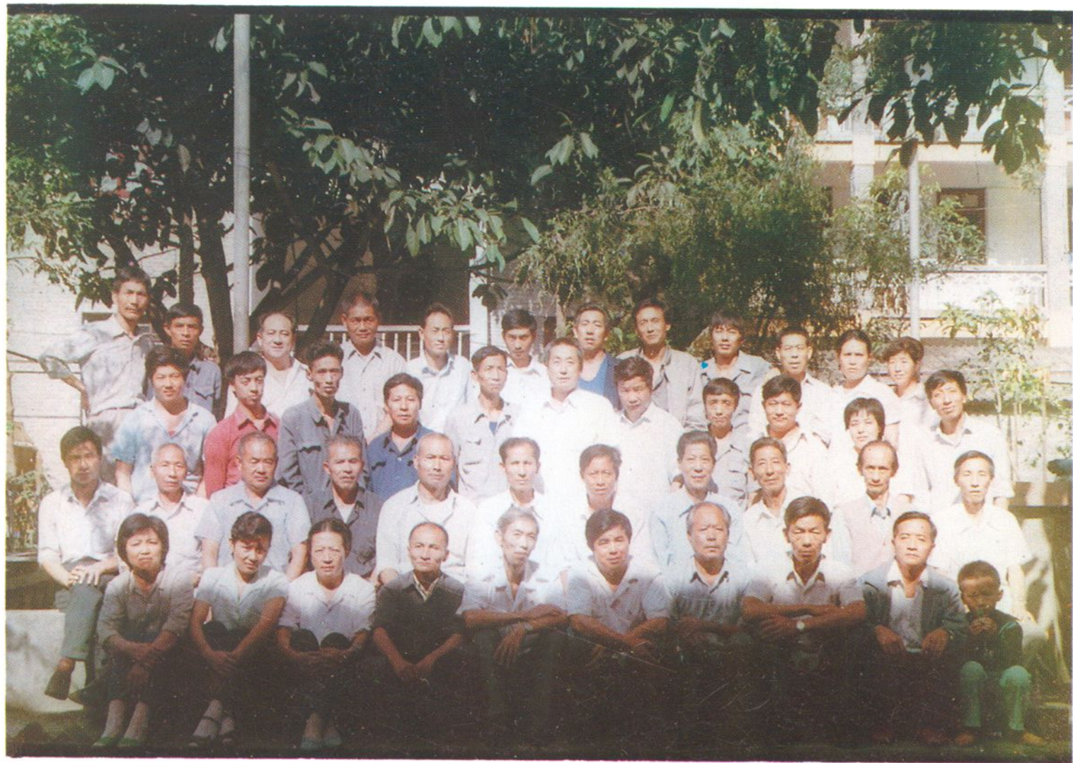
▲ 怒江粮油志征集会议合影