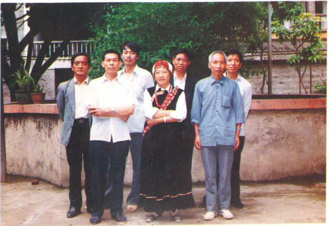
▲ 怒江粮油志编纂领导小组合影