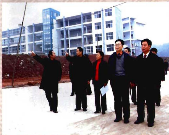
四川省人大党组书记席义方等领导视察学院新校区