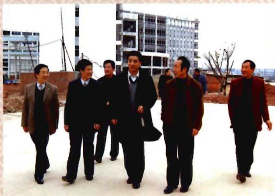
四川省教育厅副厅长王康视察学院新校区