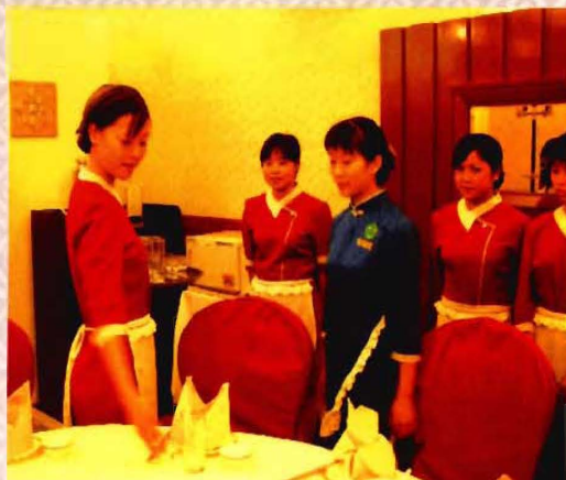
学生社会实践实习