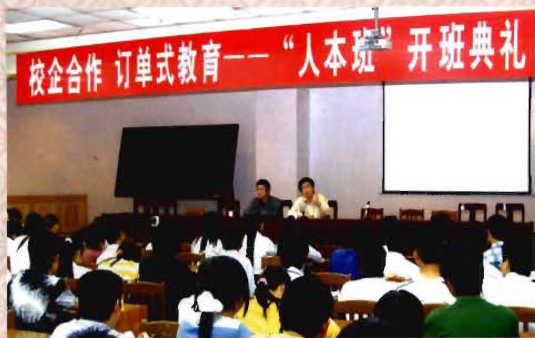
校企合作“定单式”教育