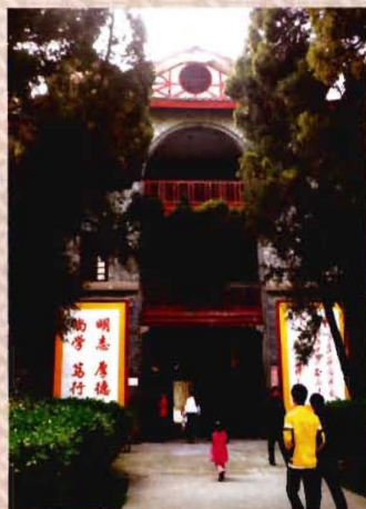
老校区行政办公楼一角