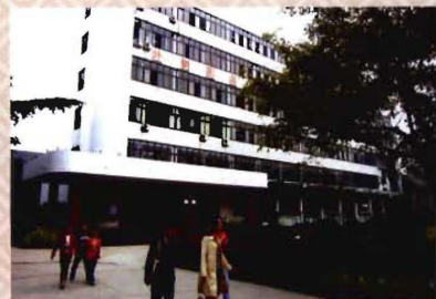
老校区第二教学楼