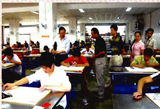
第四届机械制图大赛