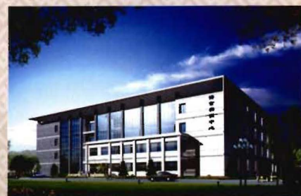
新校区语言实训中心