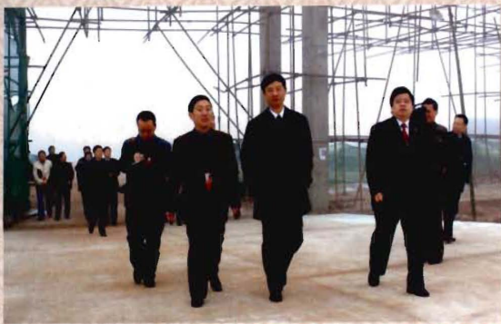
四川省教育厅厅长涂文涛等领导视察学院新校区