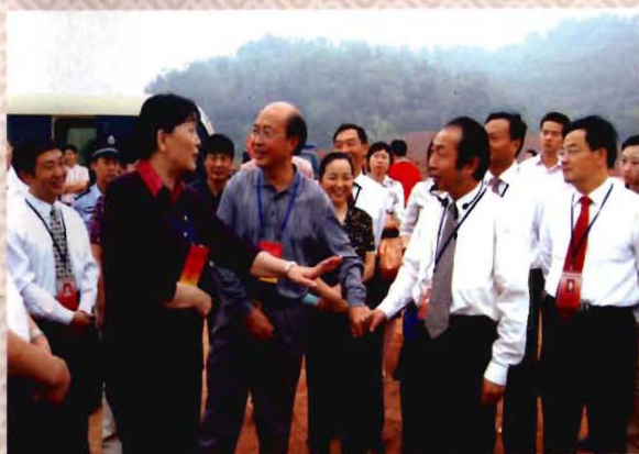
全国政协副主席张梅颖等领导视察学院新校区