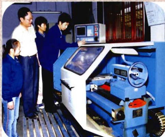
机械工程系数控机床实训