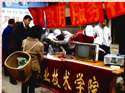
学生家电维修义务维修