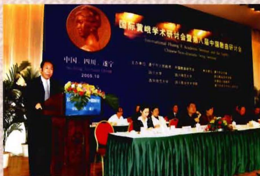
学院承办国际黄峨学术研讨会暨第八届中国散曲研讨会