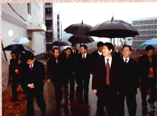
四川省人民政府副省长柯尊平等领导视察学院