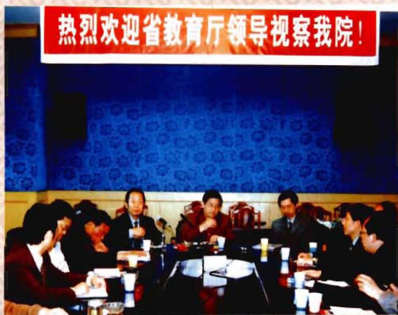
四川省教育厅副厅长唐小我到学院调研