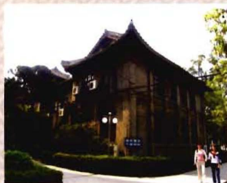
老校区区长办公楼一角