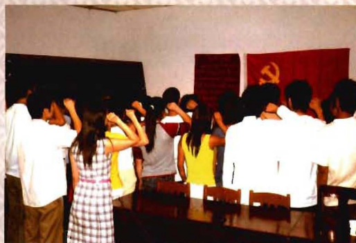
学生党员入党宣誓