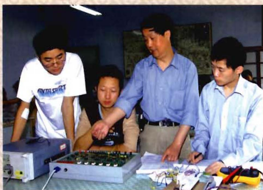
电子信息工程系模拟电路实训