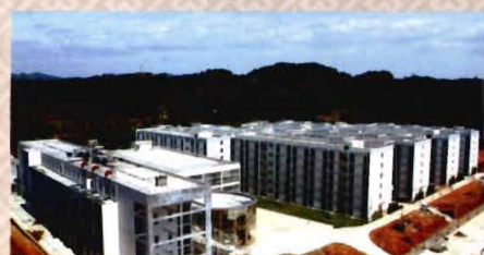
新校区部分学生公寓