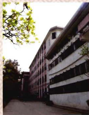
老校区第一教学楼