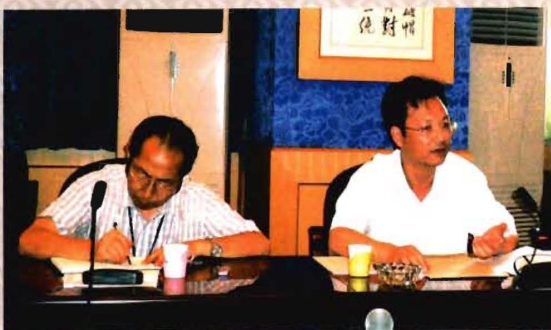
四川省教育厅副厅长姜树林视察学院