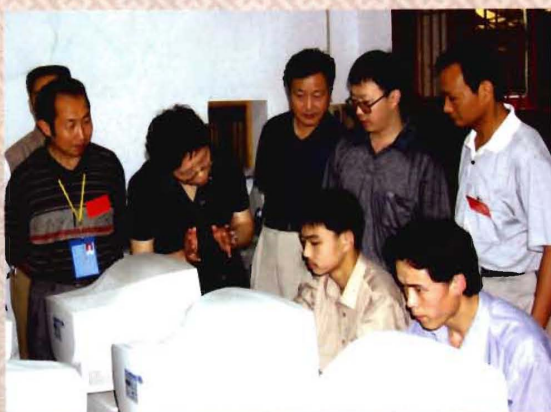
四川省教育工委副书记王晓都指导学院实训学生