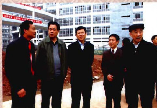
四川省政协副主席陈次昌等领导视察学院