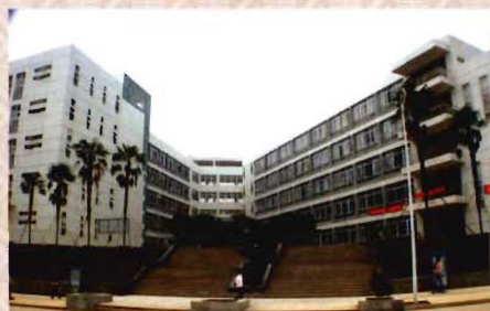
新校区第一教学楼