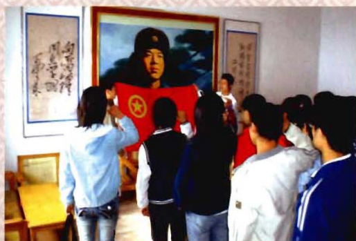
学生学习雷锋活动