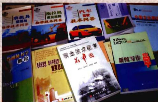
教师编写出版教材（部分）