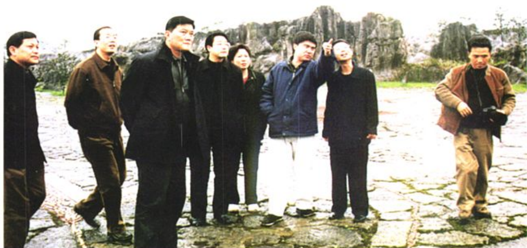
市委、市政府领导同志在石海指导工作