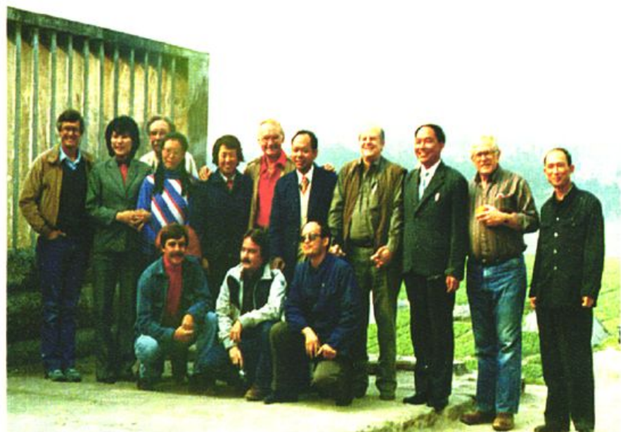
中外地质专家考察兴文石海