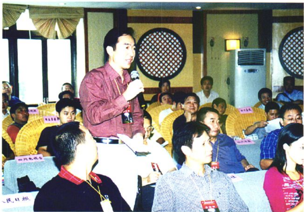
《人民日报》、《四川日报》等新闻媒体集中采访 兴文石海（2003·9）