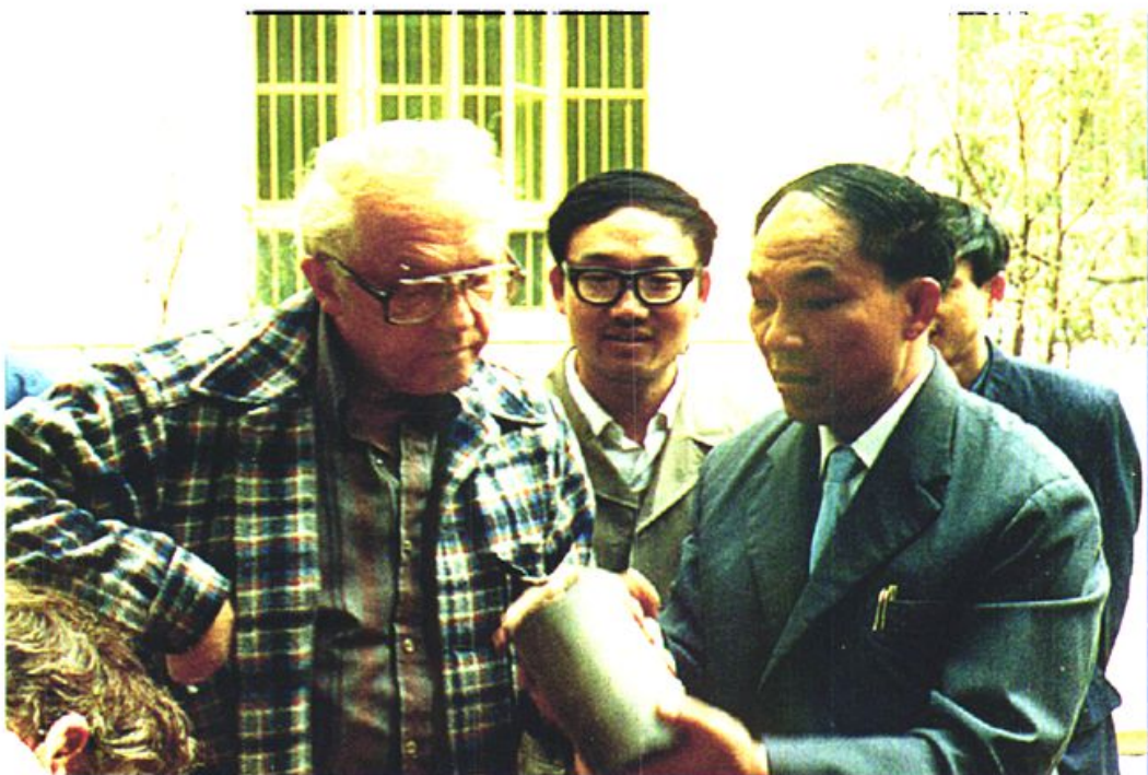
美国地质专家考察兴文石海地质遗迹