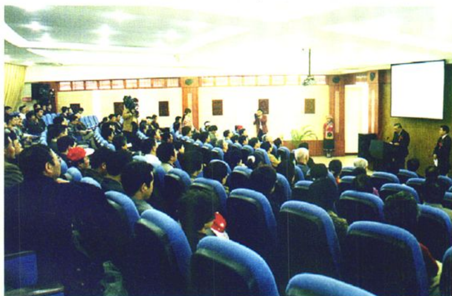
首届中国喀斯特旅游研讨会在兴文石海 召开（2003·11）