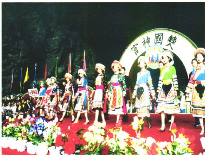
首届川南苗族风情节 (2002·5)