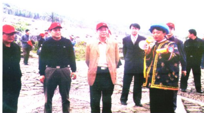
国土资源部地质环境司姜建军司长考察兴文石海（2004.9）