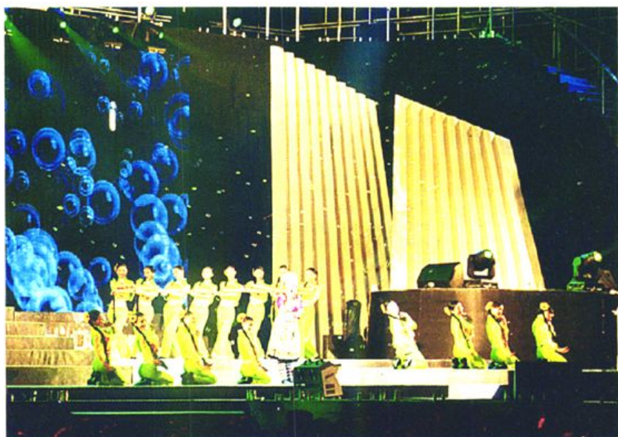
中国·宜宾石海洞乡旅游文化节 (2003·9)