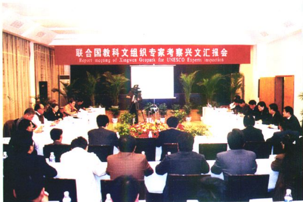
联合国教科文组织专家考察兴文汇报会