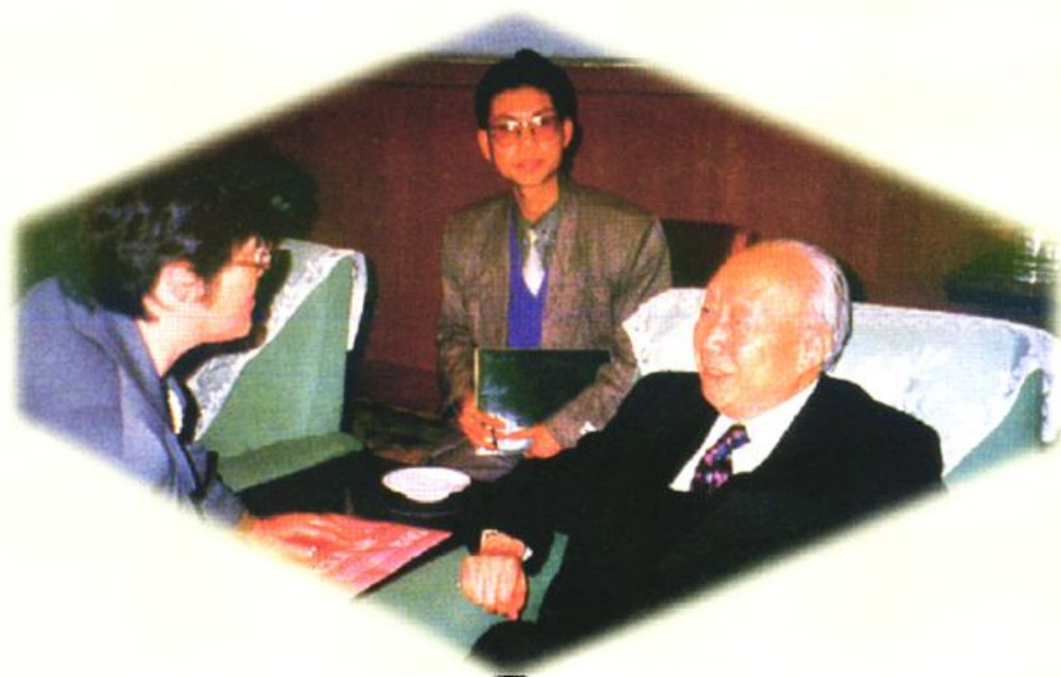
全国政协副主席钱伟长在京听取兴文石海申报 国家风景名胜区的汇报