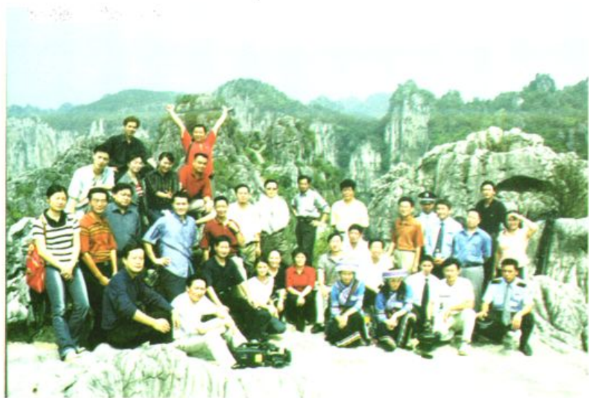
省委宣传部组织新闻媒体