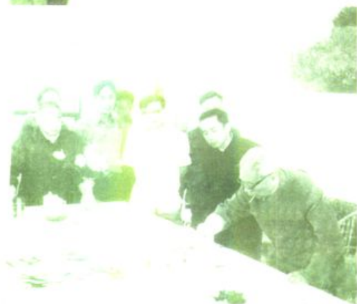
中共四川省委书记杨超 视察兴文石海（1979）