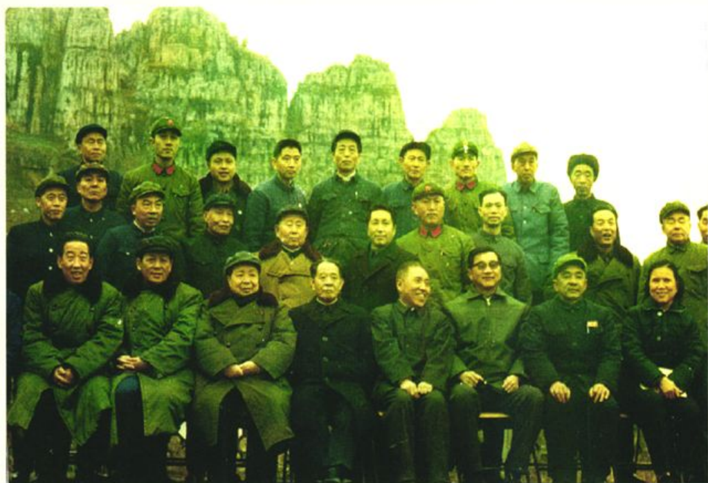
胡耀邦、胡启立、倪治福等中央领导同志视察兴文石海（1983）