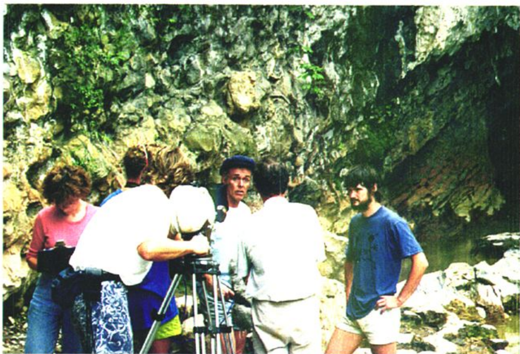
中英联合洞穴探险队在兴文石海地区作岩 溶洞穴探险（1992·8）