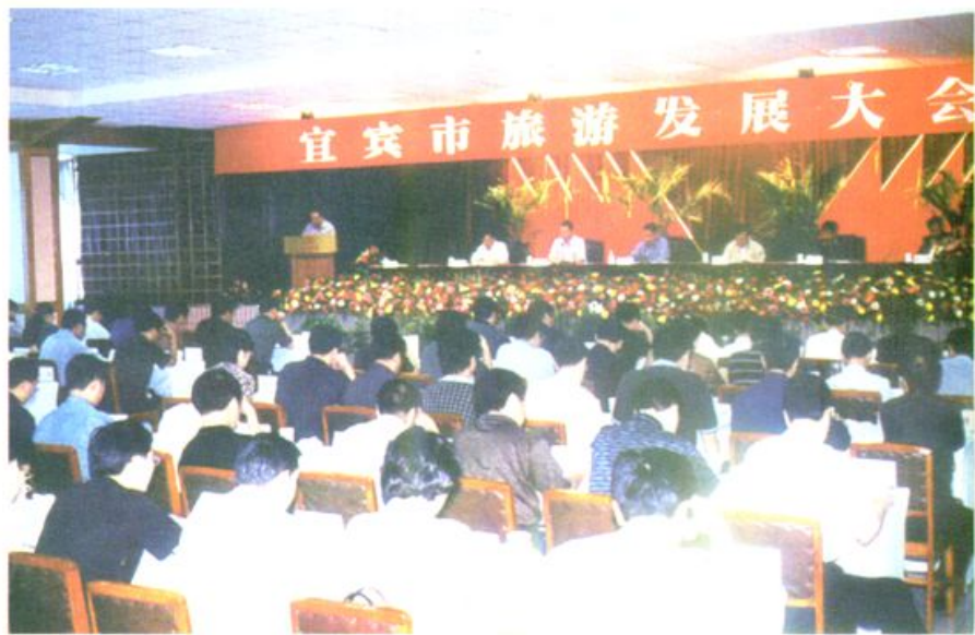
宜宾市旅游发展大会在县召开