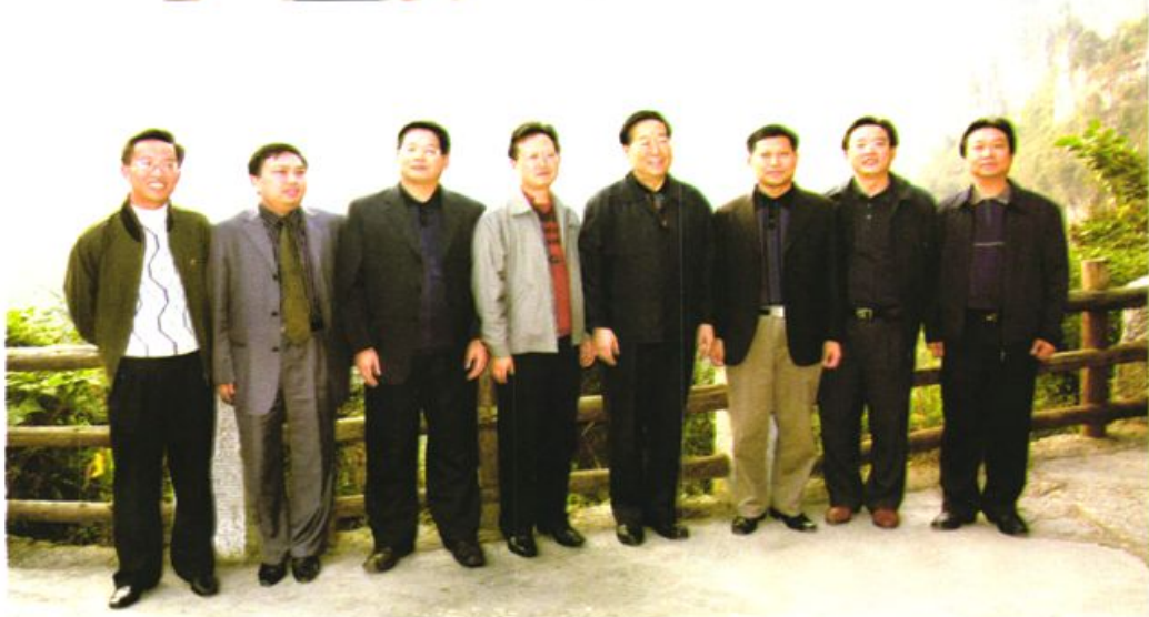
与兴文县部份党政领导合影