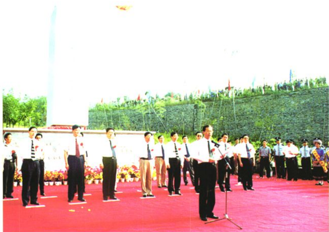
兴文石海国家地质公园举行隆重的开园揭牌仪式