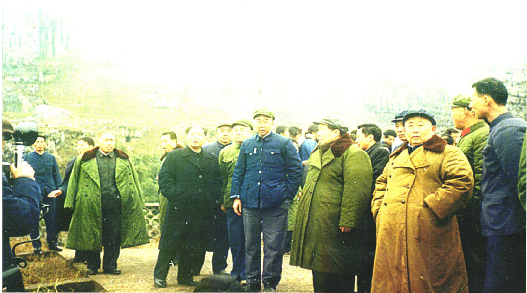
胡耀邦 胡启立 倪治福等中央领导同志视察兴文石海（1983）