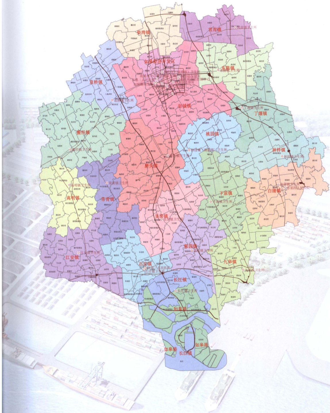
如皋市市直医疗卫生机构分布图