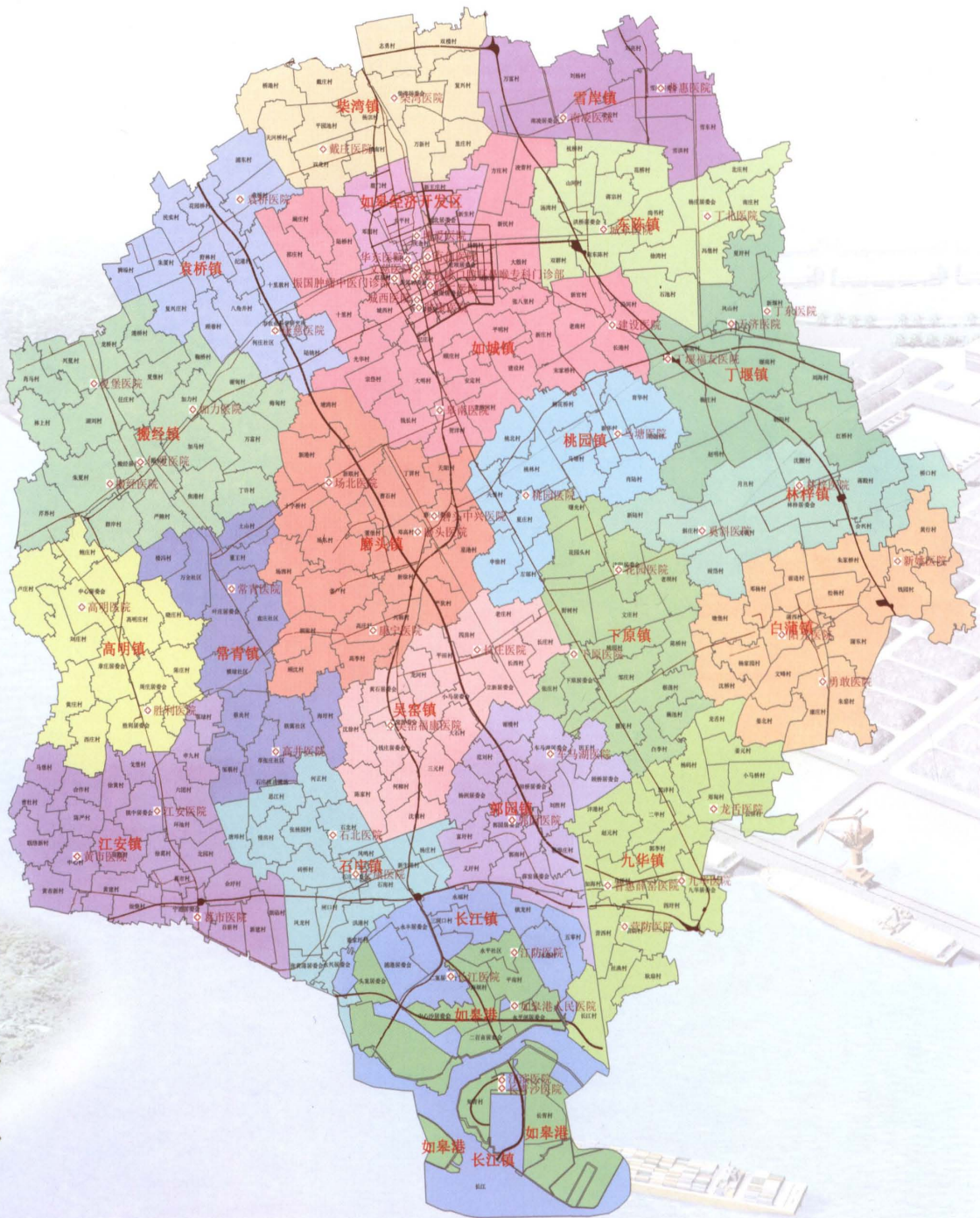
如皋市民营医疗机构分布图