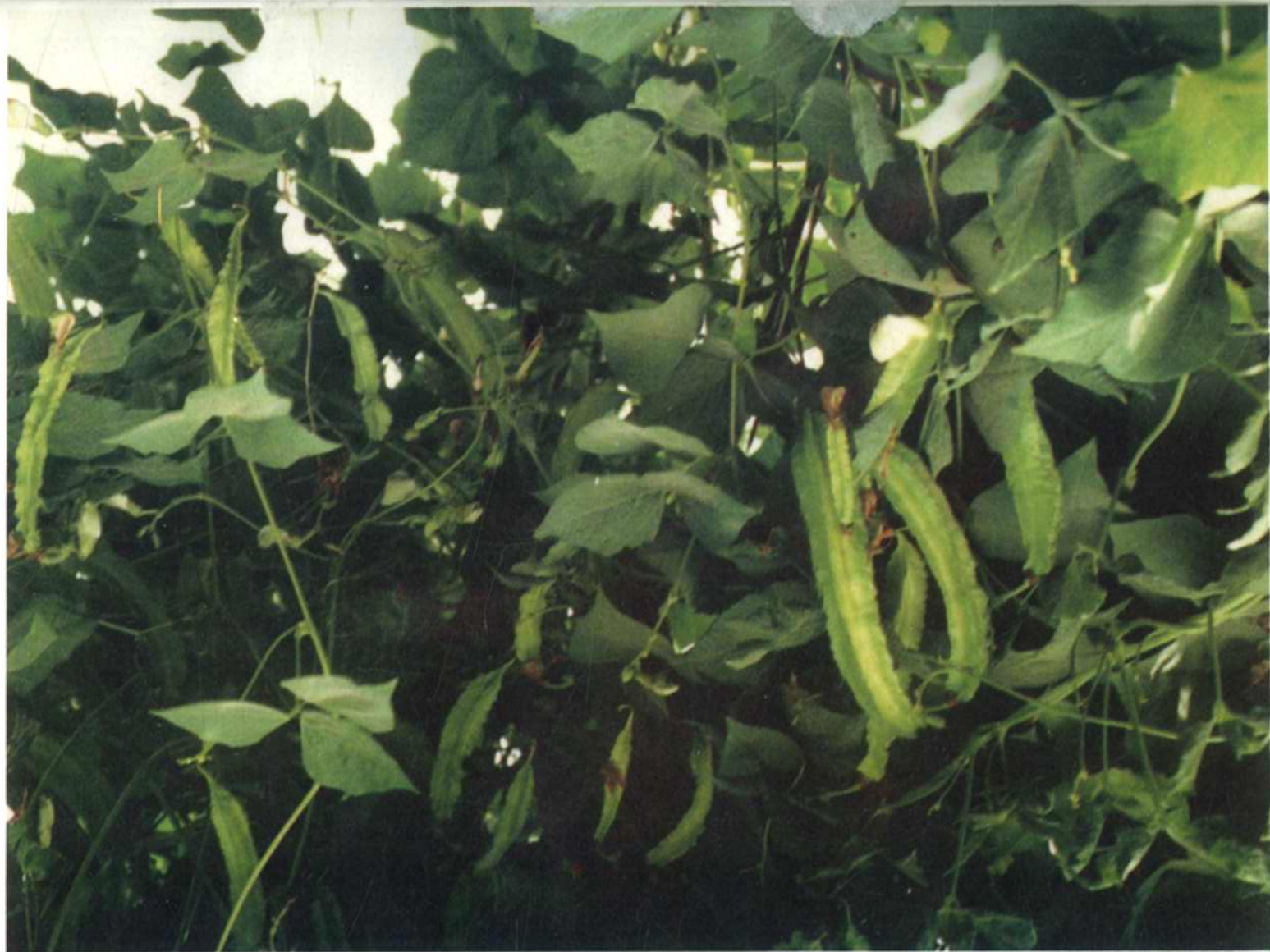
四棱豆 Psophocarpus tetragonolobus (L.) DC.