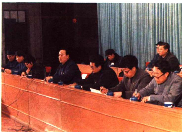
辽宁省副省长白立忱 在省第三届职工技术协作 委员会全委（扩大）会议 上讲话。左起为李凡、崔 文信、陈素芝、白立忱、 李国忠、王专、宋廷章 （1985年11月28日）