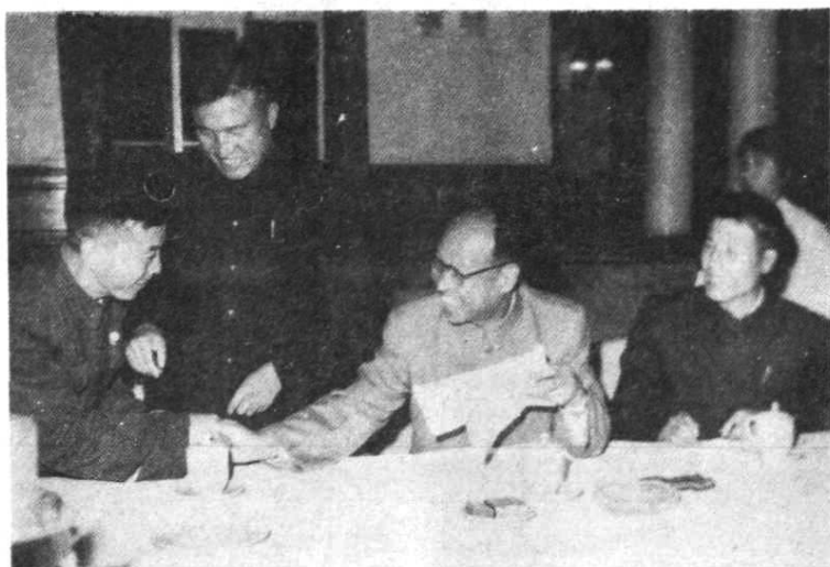
中共中央政治局委员、 书记处书记彭真与吴家柱、 林海丰、王凤恩亲切交谈 （1963年10月）