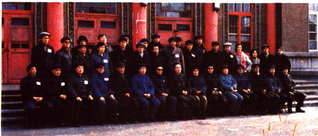
辽宁省第三届职工技术协作委员会全体委员合影（1985年11月28日）