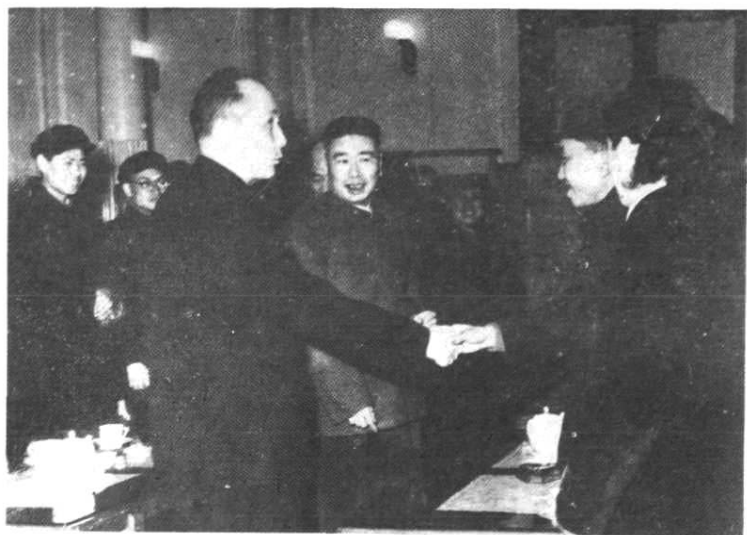
中共中央东北局第一书记宋任穷（右四）、中共辽宁省委书记黄火青（左三）在旅大市接见卢盛和（左一）等技协积极分子。（1964年3月）