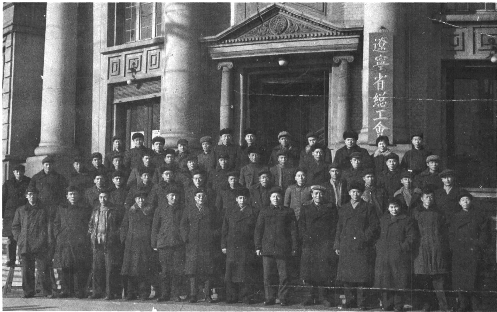
5 辽宁省总工会领导同省第一届群众技术协作委员会全体委员合影（1962年12月14日）