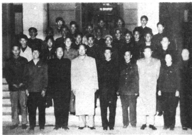
中共中央政治局委员、书记处书记彭真（前左四）、中共中央东北局第一书记宋任穷（前右三）接见吴家柱等技协积极分子后合影。黄火青（二排右一）、金直夫（后排右二）、焦若愚（二排左三）参加了接见（1963年10月）