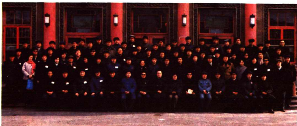
出席辽宁省第三届职工技术协作委员会全委（扩大）会议的代表合影 （1985年11月28日）