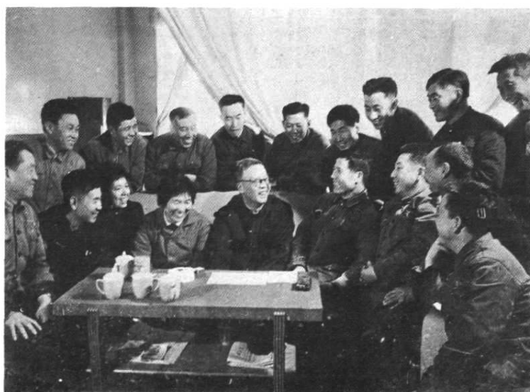
著名数学家华罗庚 教授（前左五）同辽宁技 协积极分子在一起。前 排左起为梁金声、卢盛 和，左四为韩秀芬，左 六为王凤恩（1978年）