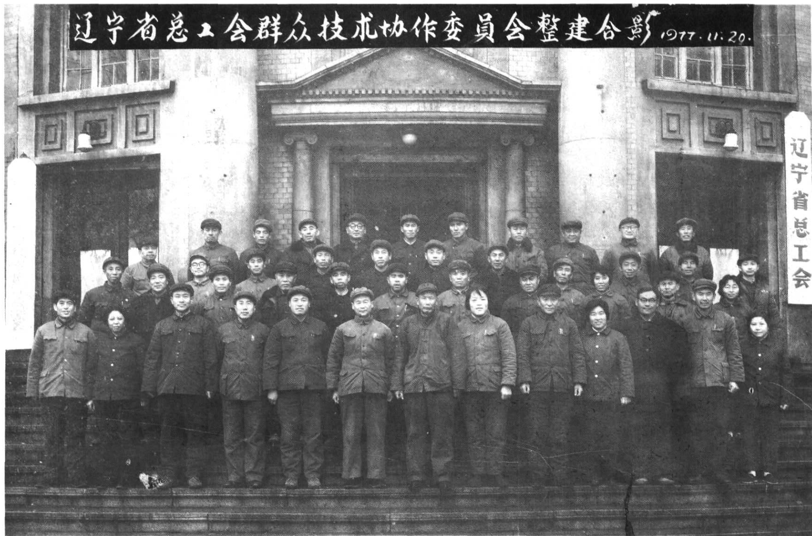
辽宁省总工会第二届群众技术协作委员会全体委员合影（1977年11月20日）