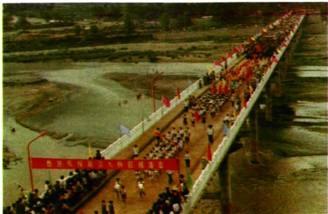
元江澧江大桥通车