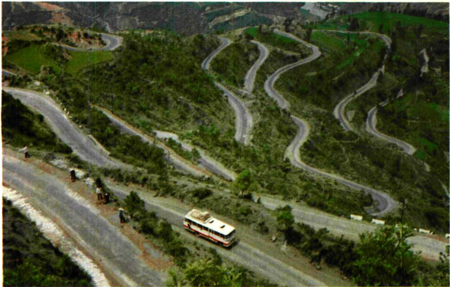
鱼梅公路小绿汁盘江公路