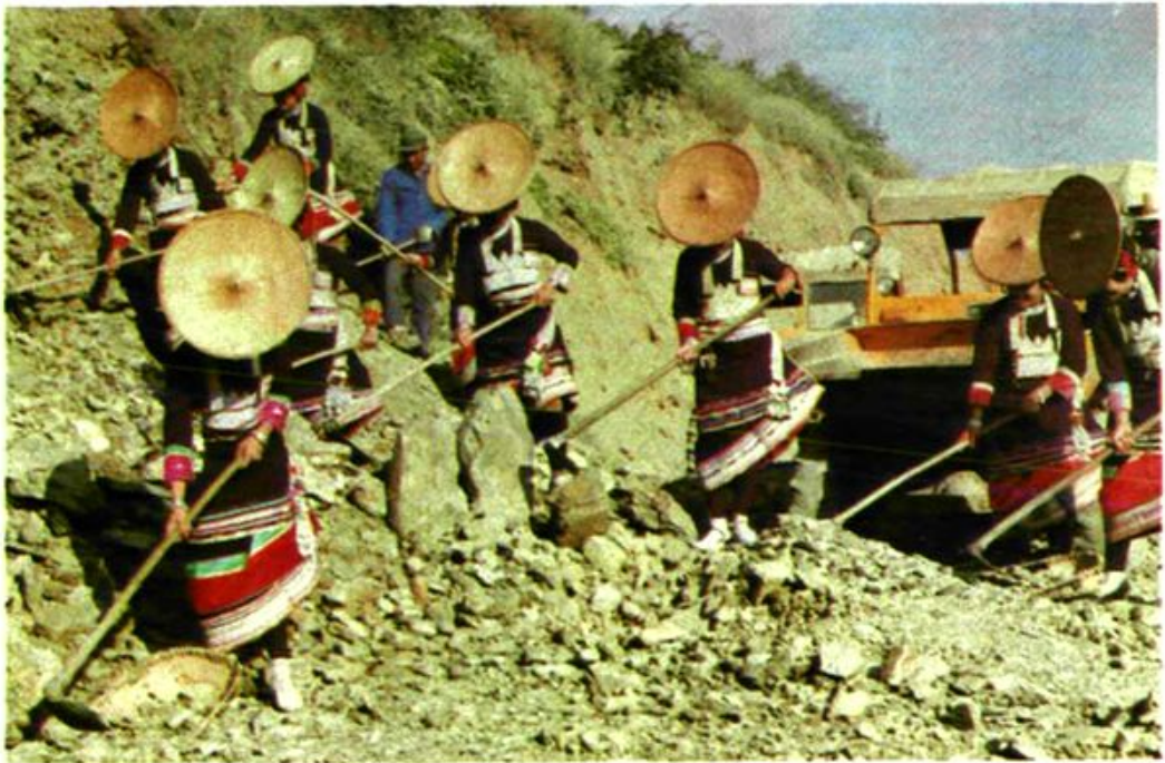
傣族人民积极参加修建元漠公路