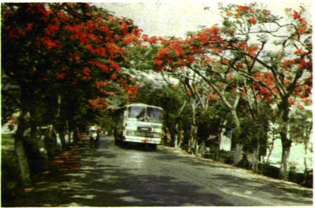
昆洛公路经元江一段