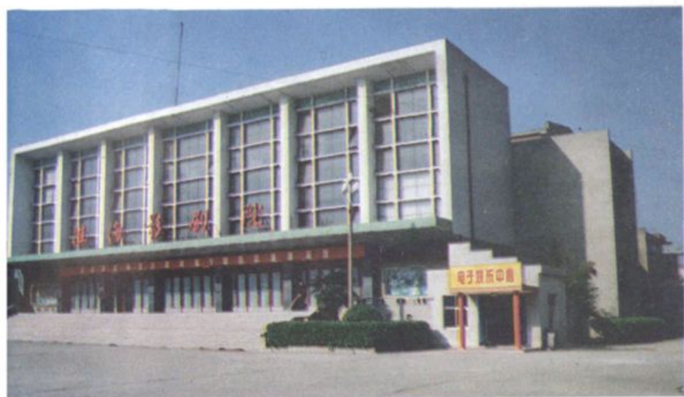
◀ 1979年 建成使用的淮阴 市淮海影剧院。