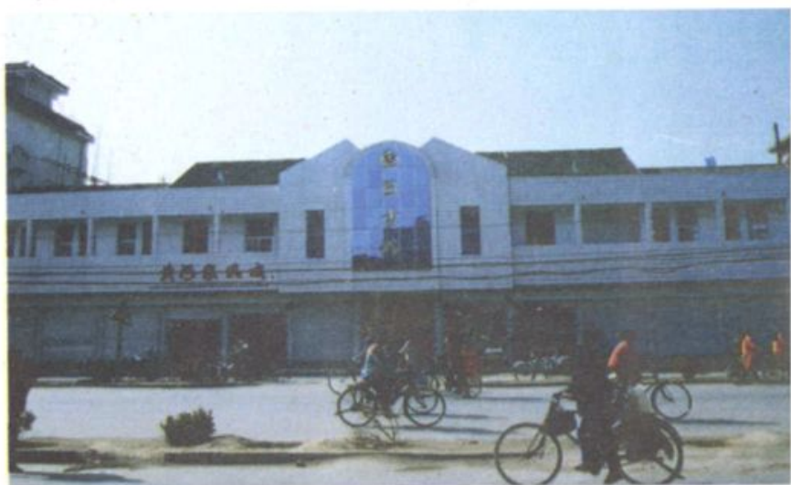
▶ 泗阳县图书 馆八十年代建成 的新宿舍。