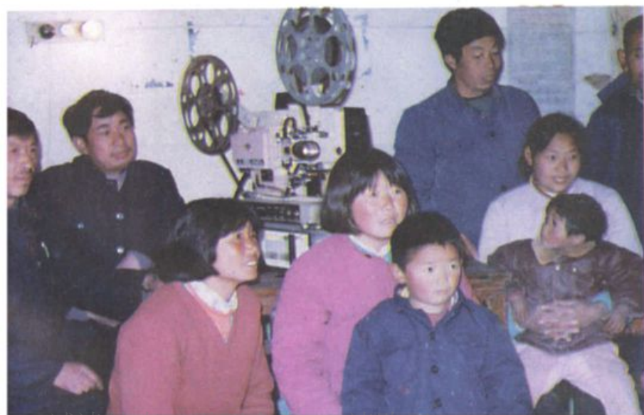
◀ 淮阴县大兴乡 电影队放映农村科教 片，受到中宣部、文化 部表彰。