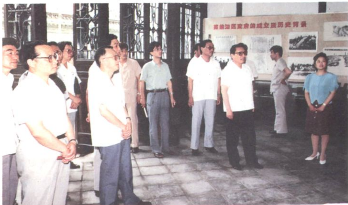
▲ 1990年6月29日,乔石参观苏皖边区政府旧址纪念馆。