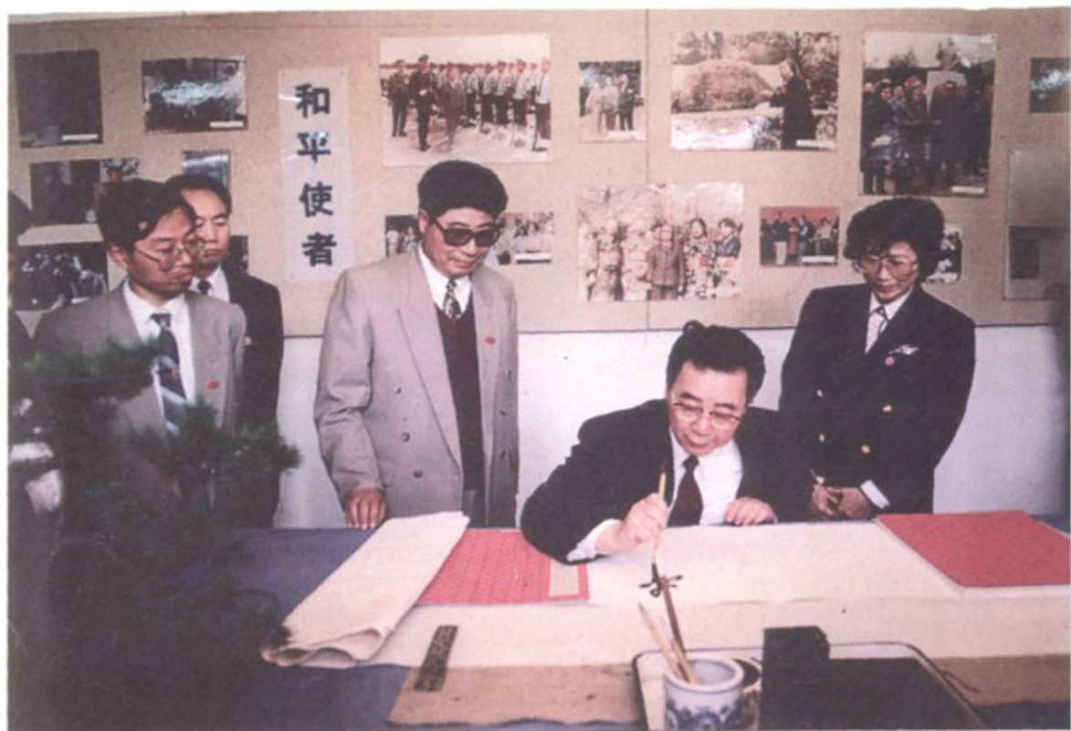
▲ 1980年5月30日,李鹏瞻仰周恩来故居并当场题词。