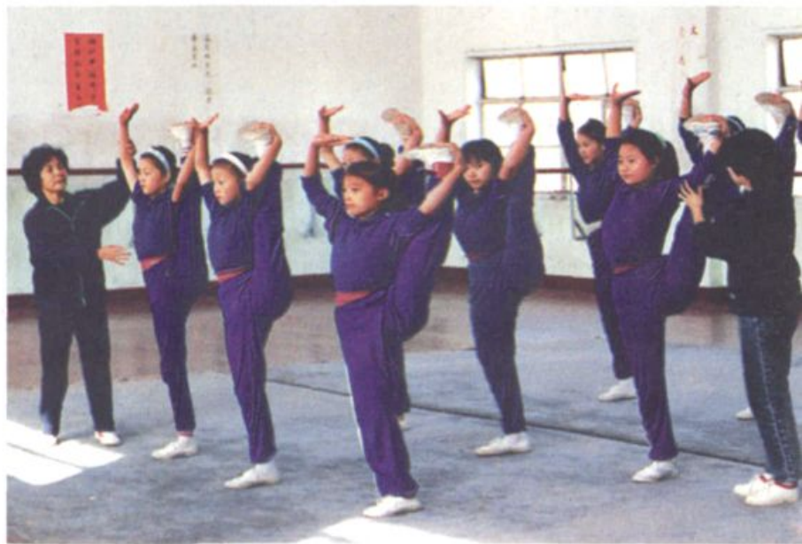
▲淮阴市戏剧学校学员们在练功。