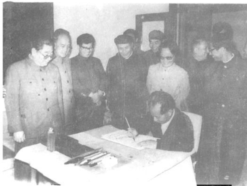
▲1984年10月29日，胡耀邦瞻仰周恩来故居并当场题词。