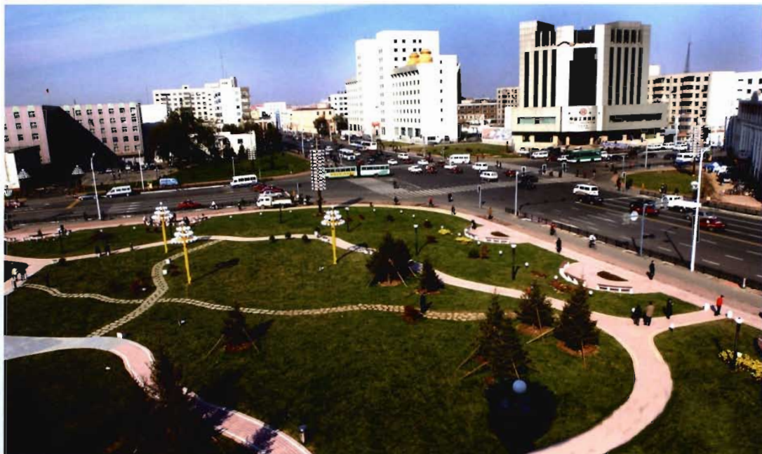
2003年焕然一新的铁西广场