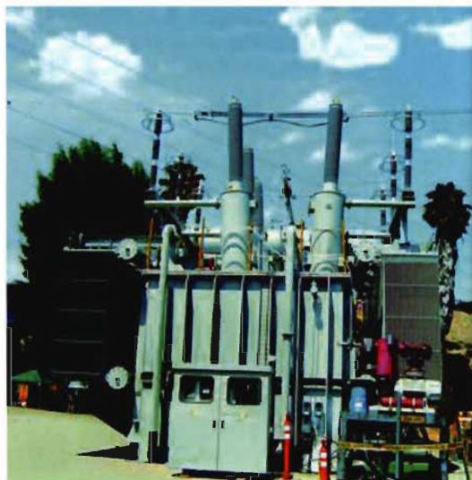
2004年11月7日特全称变自主研发的三相自耦有载调压变压器出口美国