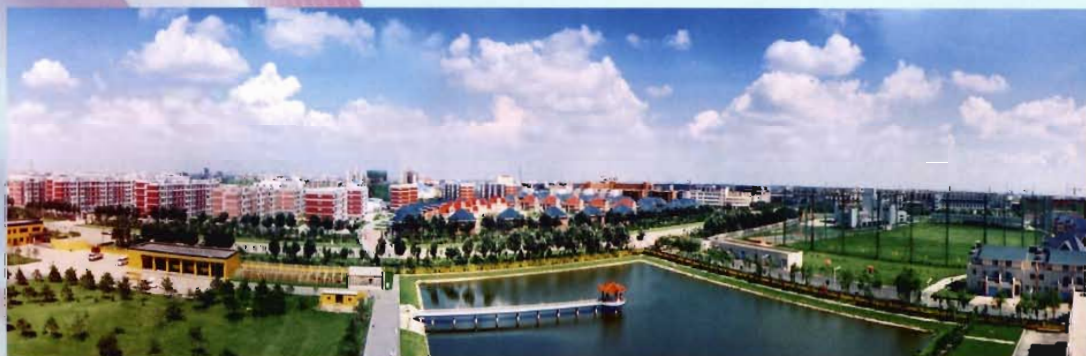
远眺铁西开发区新城