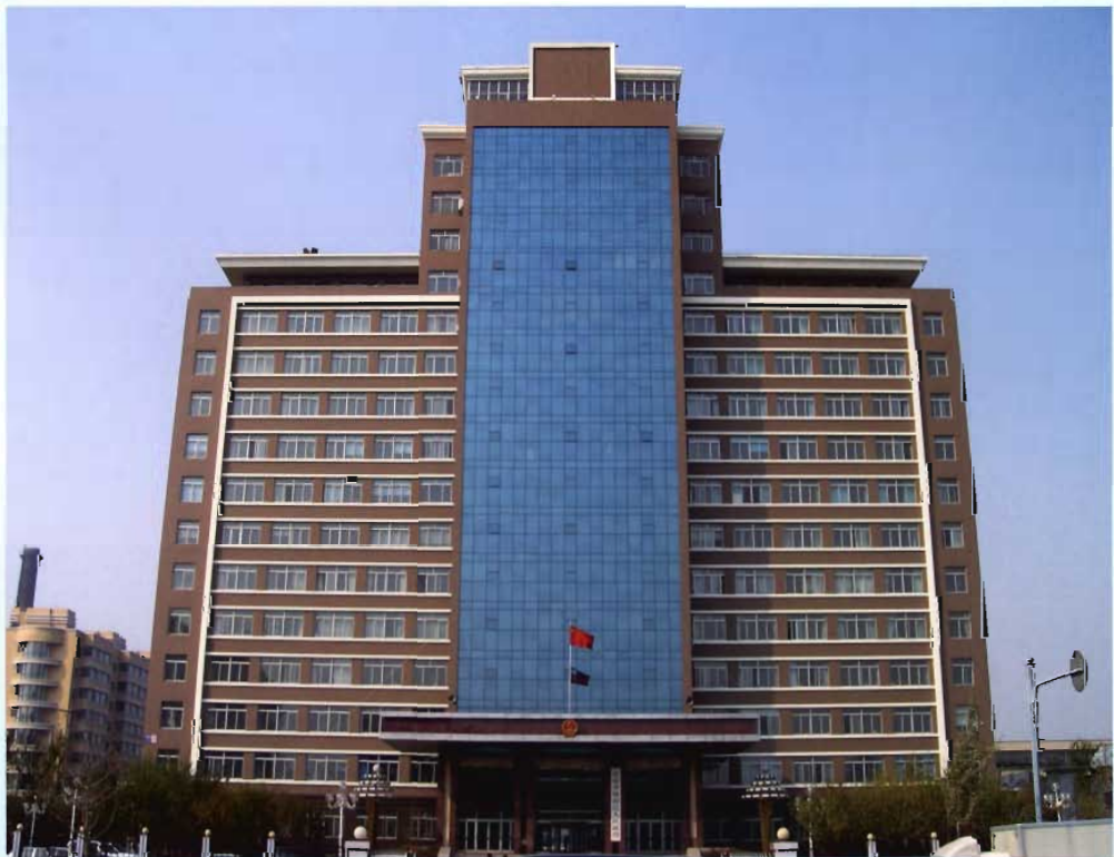
新建的铁西区人民政府大楼