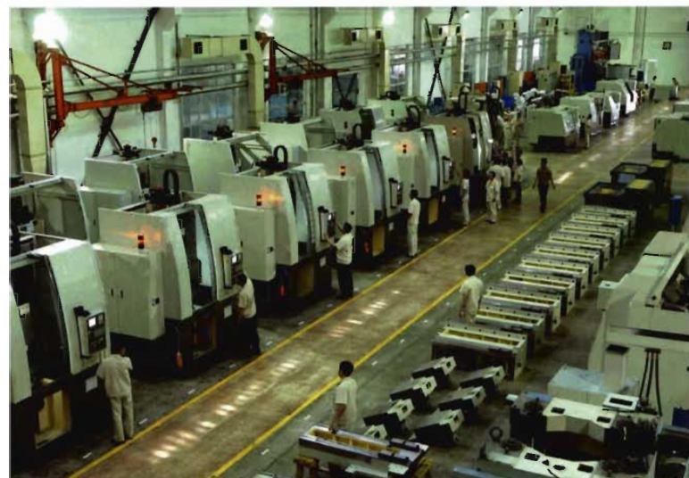
沈阳机床集团车间