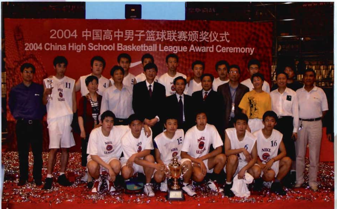
沈阳市第三十一中学荣获 2004 年中国高中男子篮球联赛冠军