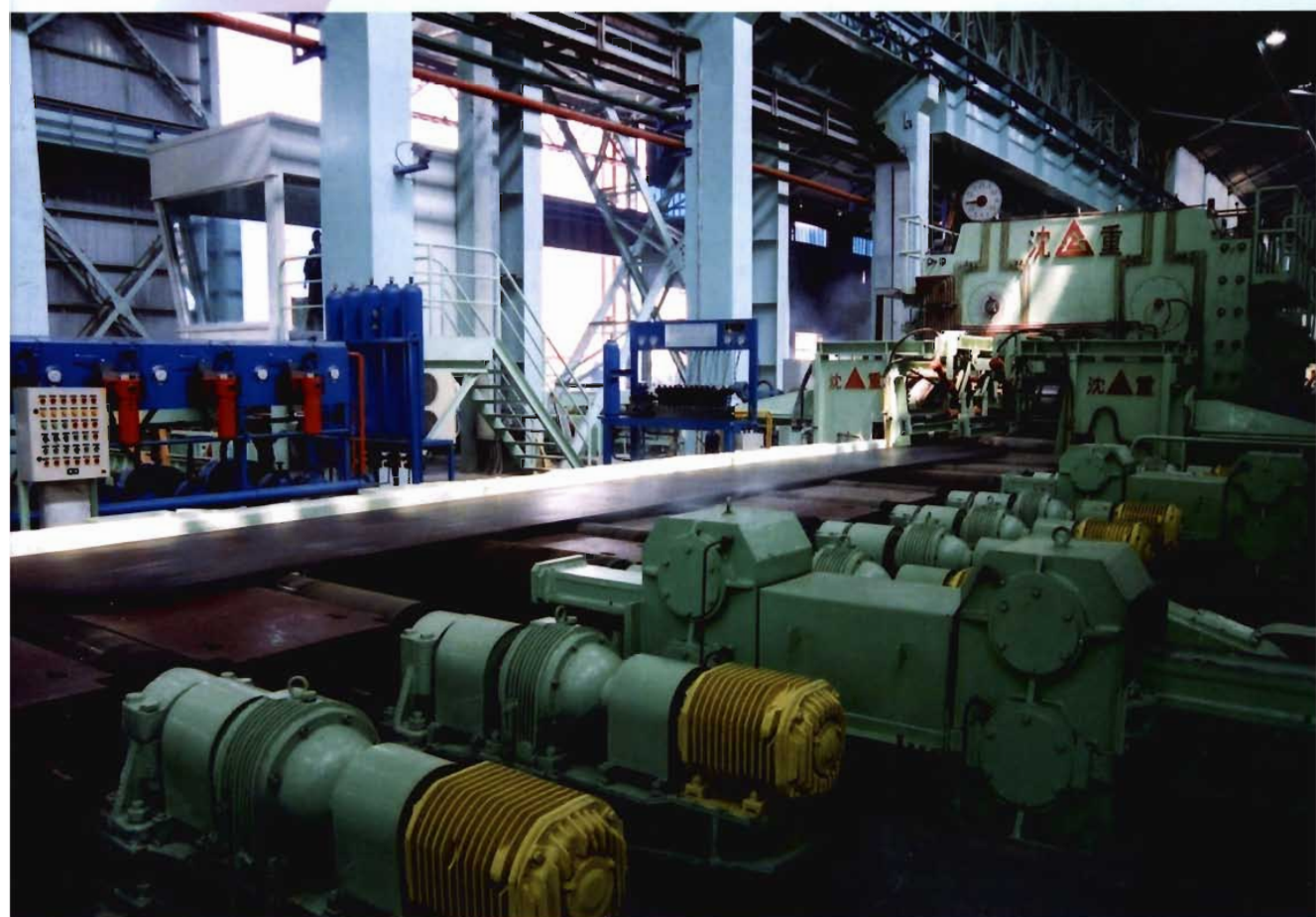
沈阳重型机器厂车间