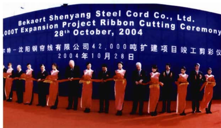
2004年10月28日贝卡尔特——沈阳钢帘线有限公司42000吨扩建项目竣工剪彩仪式