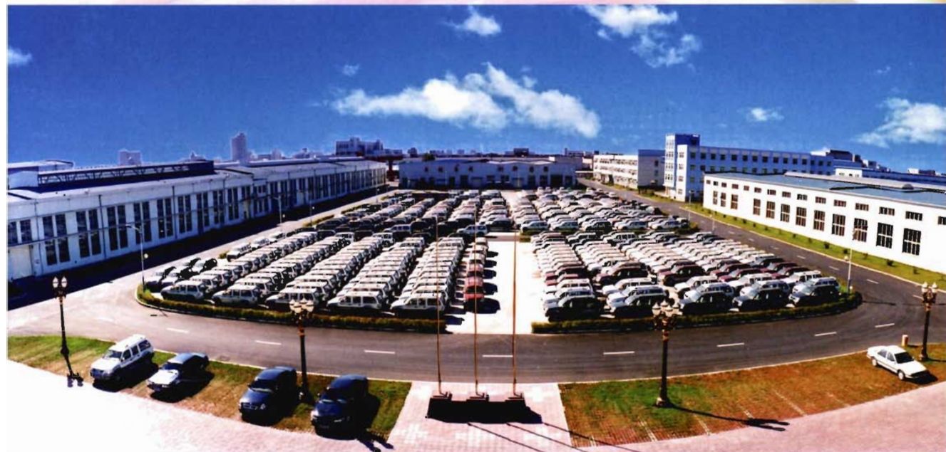
沈阳农机总公司销售储运部