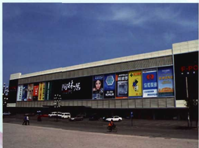
铁西区北四路的陶林居