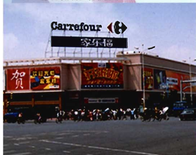
家乐福超市铁西店