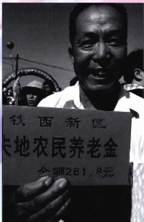
2005年铁西新区被征地农民领到第一笔养老金