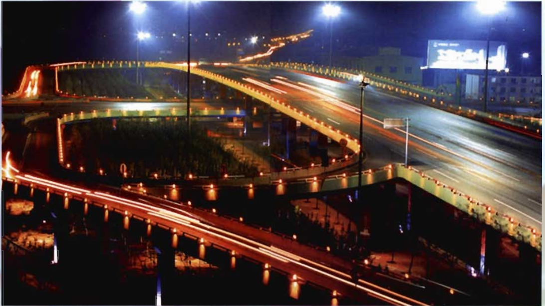
建设大路零公里立交桥夜景