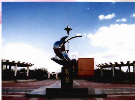
郎家新村家园广场