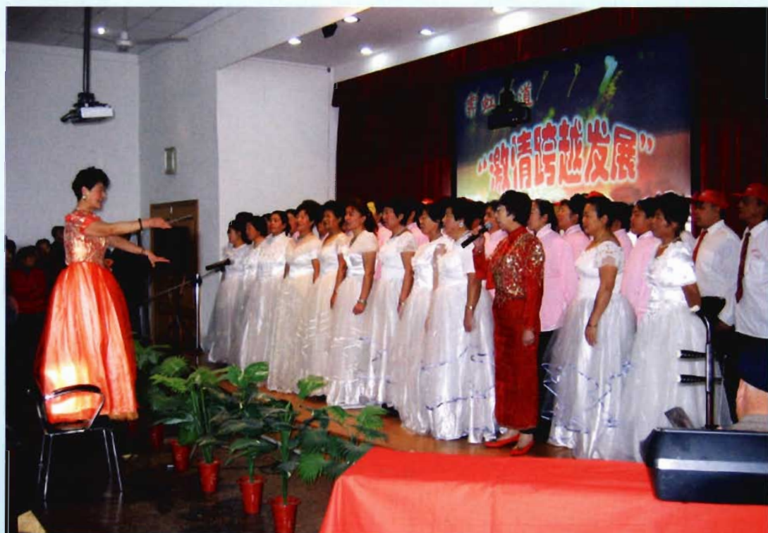
霁虹街道群众文艺汇演