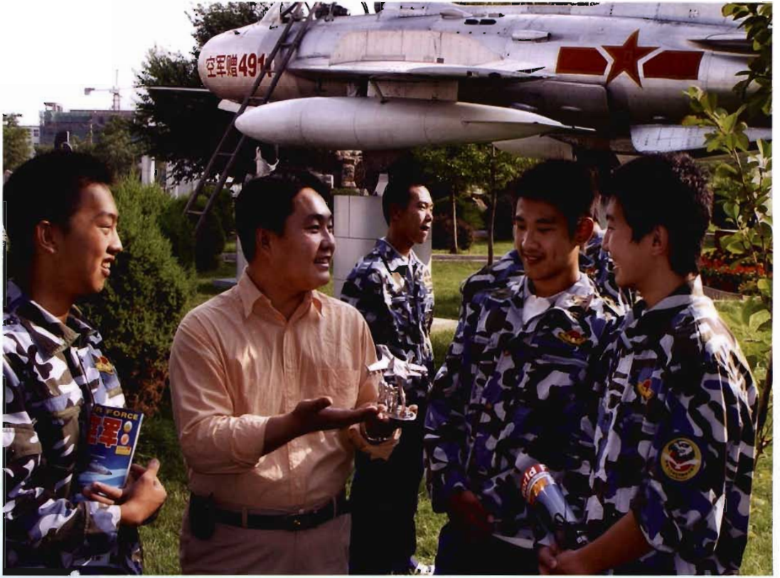
学生学军夏令营活动