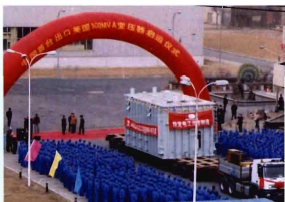
2012年中国首台900MVA变压器出口美国启动仪式