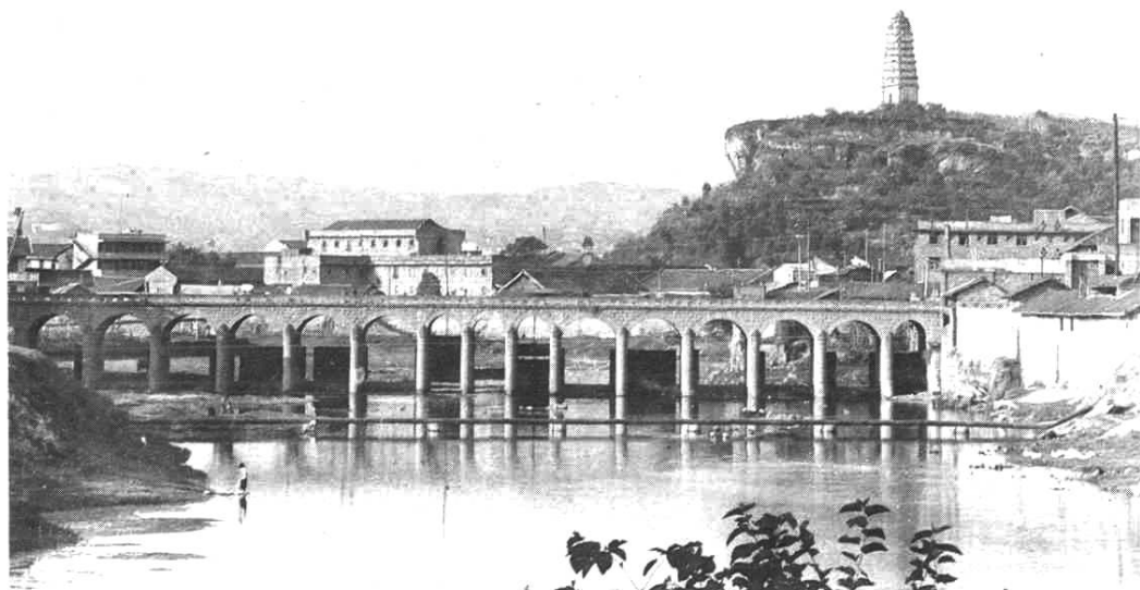
横跨旭水河的荣县锁江桥

荣县以此山得名。每当晴日岚气升腾，远望荣德山，若隐若现有如仙境，美妙动人，因有“荣德晴岚”之美称。