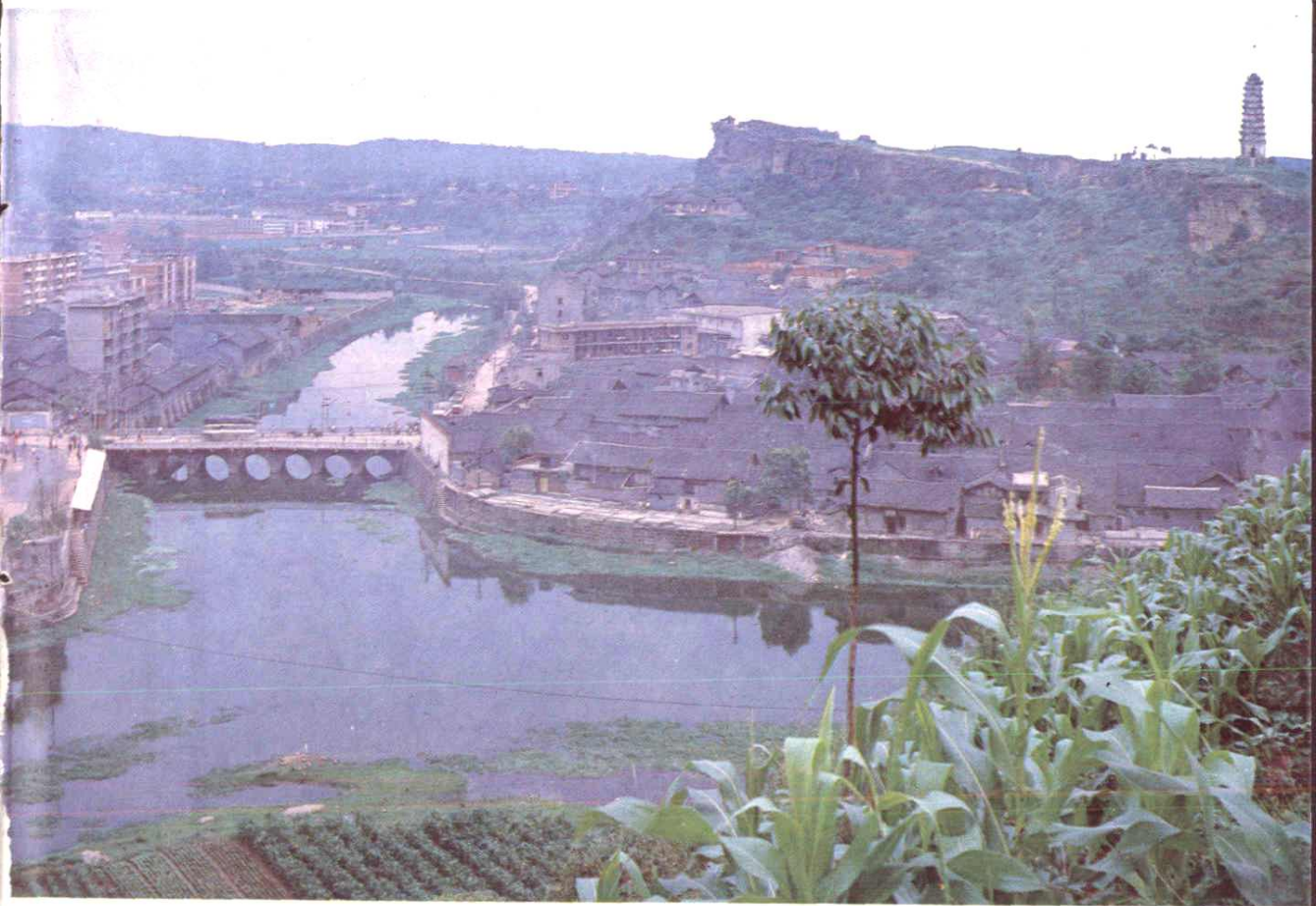
莱县城区东南部景色