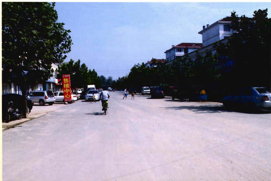
宽畅繁华的商业大街