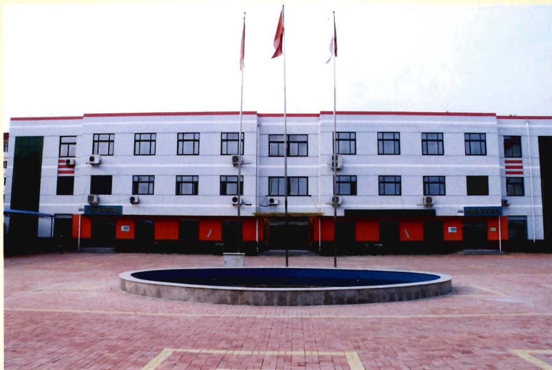
新园社区办公大楼