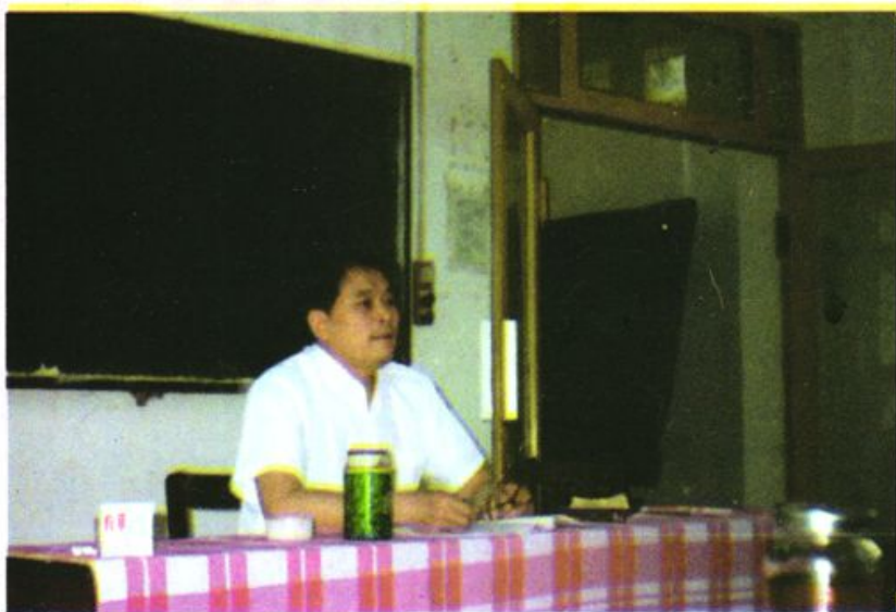
校学员讲课 市委书记敬中春同志为我