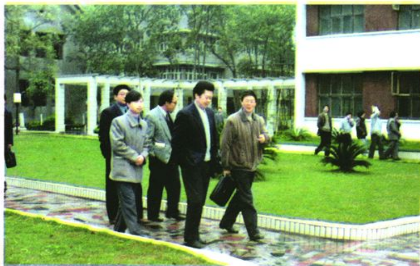
导工作 校长杨安民同志来校检查指 市委副书记、市委党校