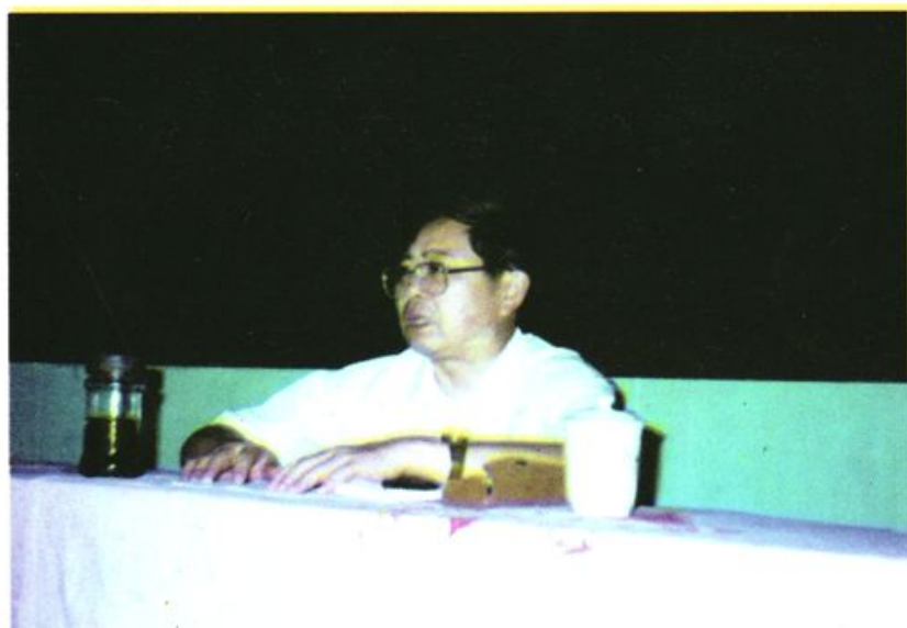
市政协主席蒲显福同志 为我校学员讲课