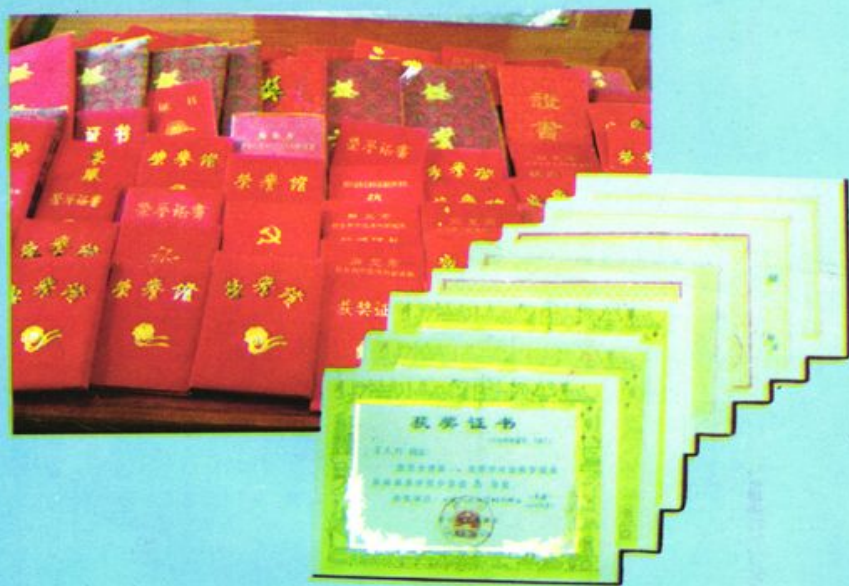
教师部分科研论文获奖证书