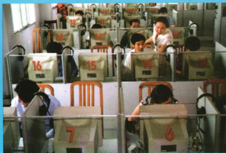
教师辅导学员操作微机