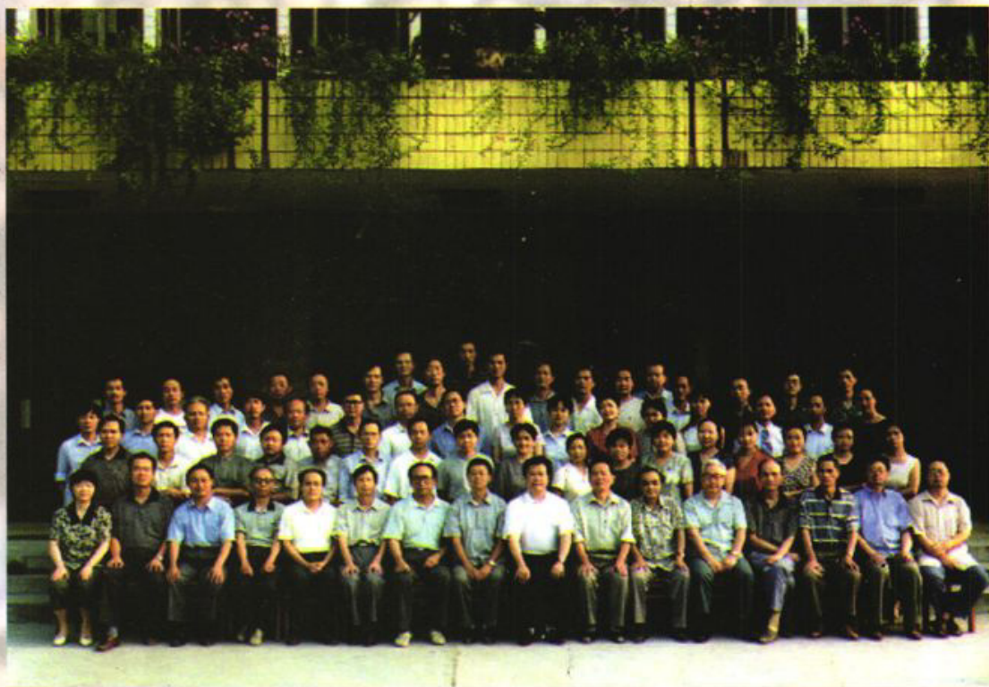
全校在职职工及部分退休职工五十周年校庆合影