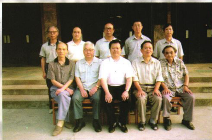
历届部分校领导合影