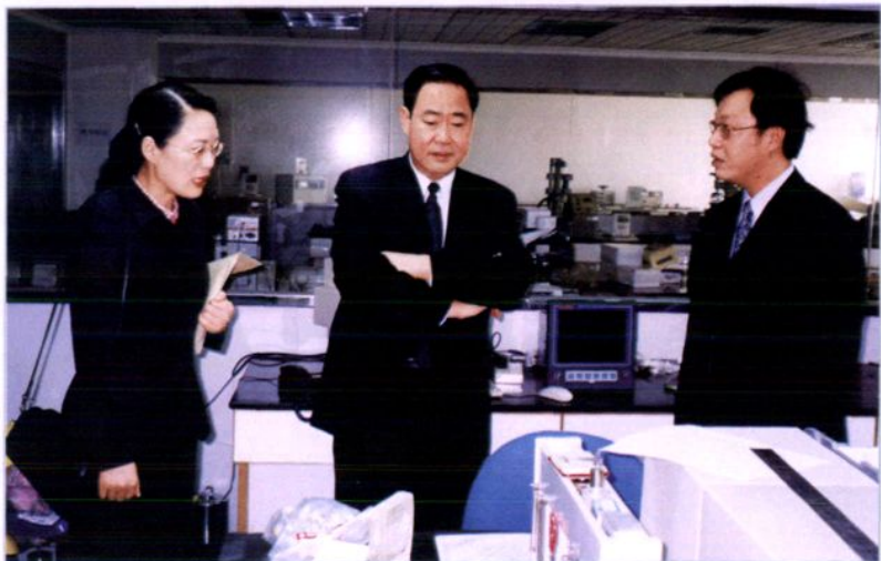
2001年11月10日，东莞市委书记佟星（左二）在东莞检验检疫局局长詹少彤（右一）、副局长程开宇（左一）的陪同下视察检验检疫局实验室