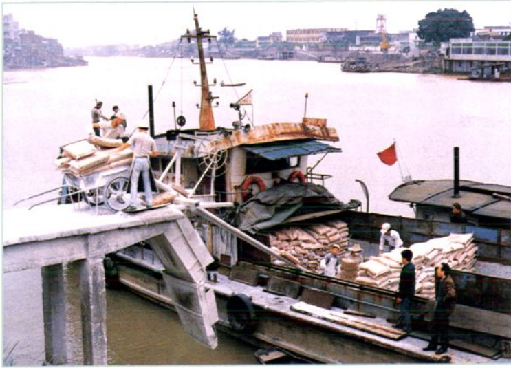
石龙王家山码头（摄于1988年4月）