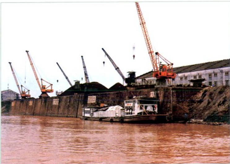
石龙水铁码头（摄于1988年8月）