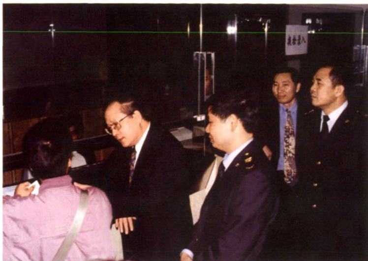
2000年1月16日，国家出入境检验检疫局局长李长江在东莞检验检疫局检务大厅与报检员亲切交谈