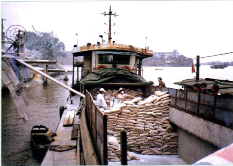
石龙港装卸点（石龙红海新港码头）