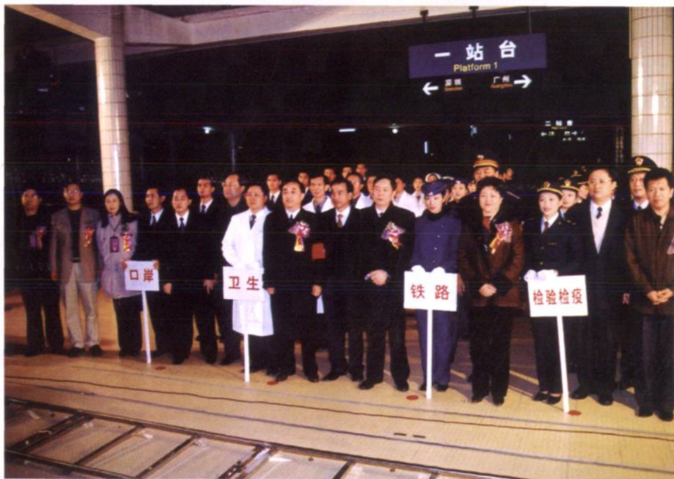
2005年1月14日，国家质检总局、海关总署、卫生部、公安部以及铁道部在东莞常平铁路客运口岸联合举行“京九/沪九直通车运行途中突发公共卫生事件处置演习”。国家质检总局副局长葛志荣（前左七）、广东省政府副省长雷于蓝（前右五）、东莞市政府副市长张顺光（前右二）等领导现场观摩了演习