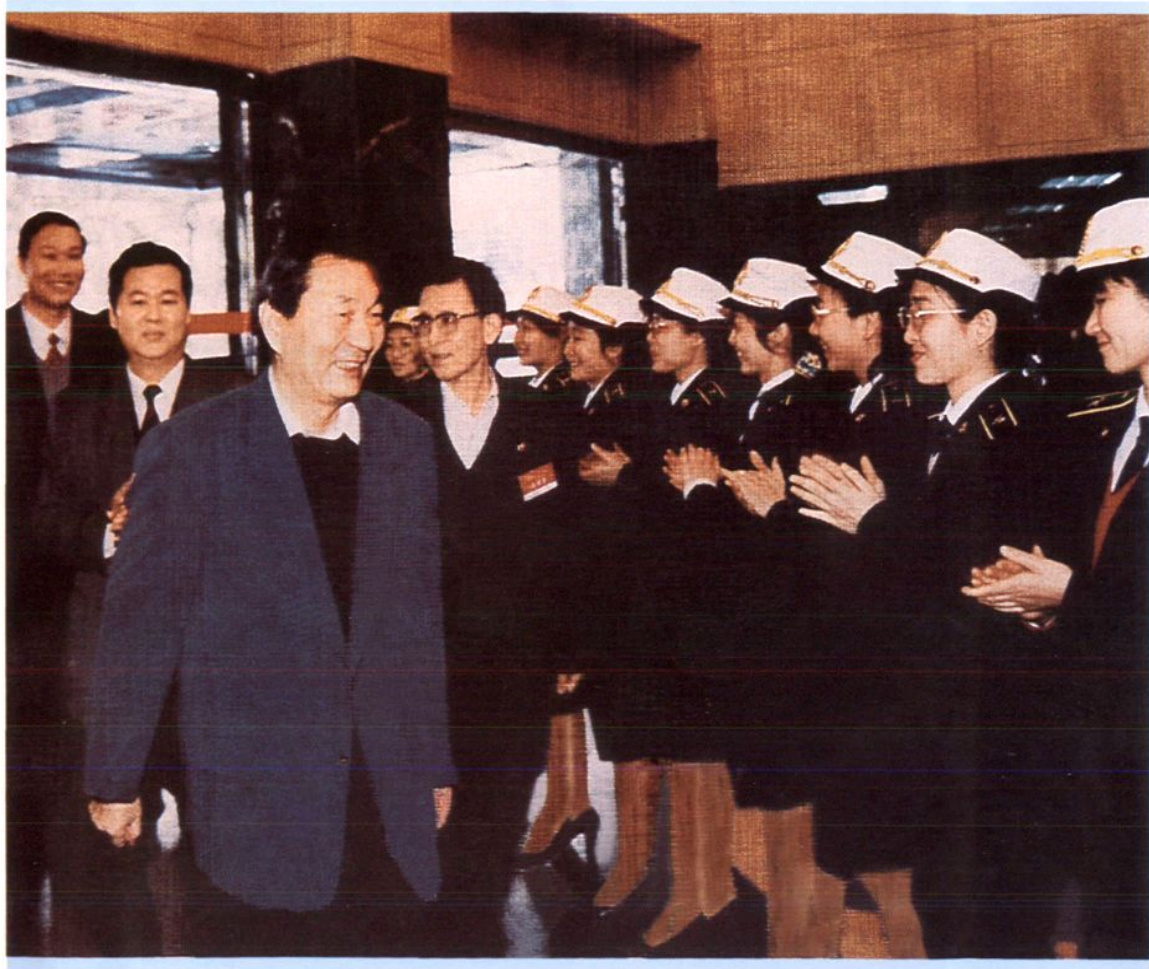
1996年1月19日，国务院副总理朱镕基视察东莞海关