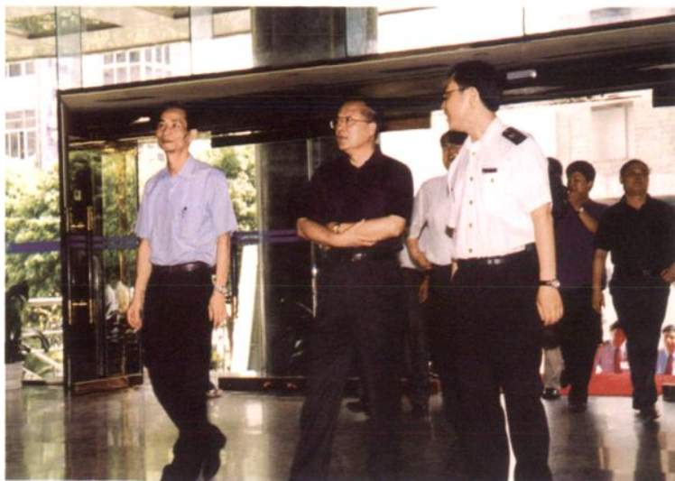
2001年5月29日，国家质检总局局长李长江（左二）在市长黎桂康（左一）、东莞检验检疫局局长詹少彤（右一）的陪同下莅临东莞检验检疫局视察