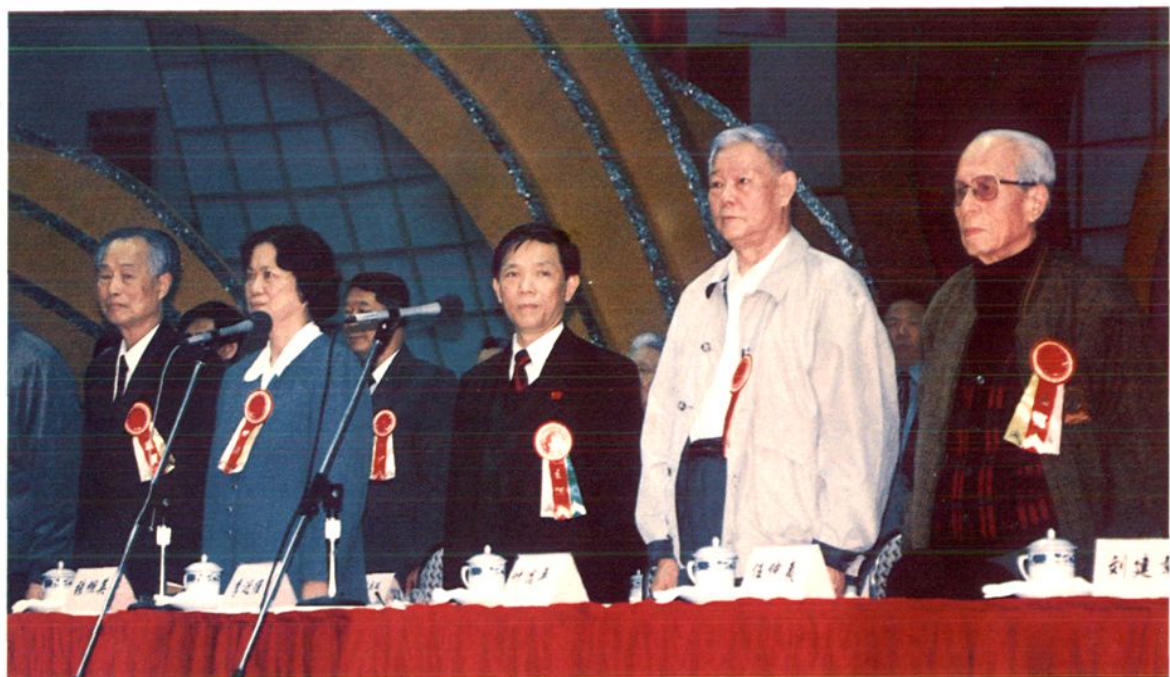
1997年12月31日，全国政协副主席叶选平（右二）、广东省委副书记张帼英（左二）等领导参加东莞市虎门港获国务院批准对外籍船舶开放、常平铁路客运口岸更名为东莞铁路口岸暨百项工程竣工庆典大会