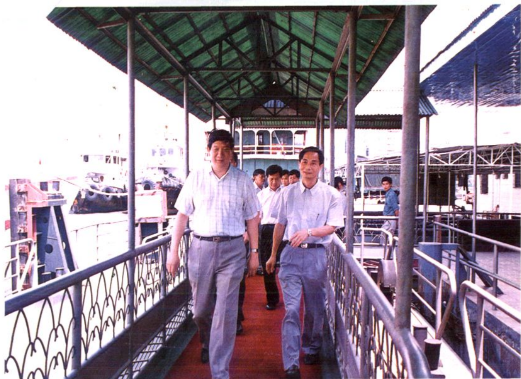
1998年8月9日，海关总署领导叶剑（前左）在黄埔海关关长王祖兴、市委副书记黎桂康（前右）、市口岸办主任李流明的陪同下，到东莞市检查海关贯彻落实国务院打击走私工作会议精神和虎门港建设情况