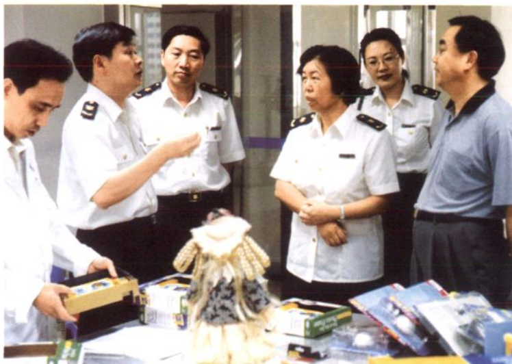
2000年6月14日，国家出入境检验检疫局副局长葛志荣（右一）、广东检验检疫局局长张淑荣（右三）、副局长陈博文（左三）在东莞检验检疫局局长邓旭旗（左二）、副局长程开宇（右二）陪同下，视察东莞检验检疫局实验室