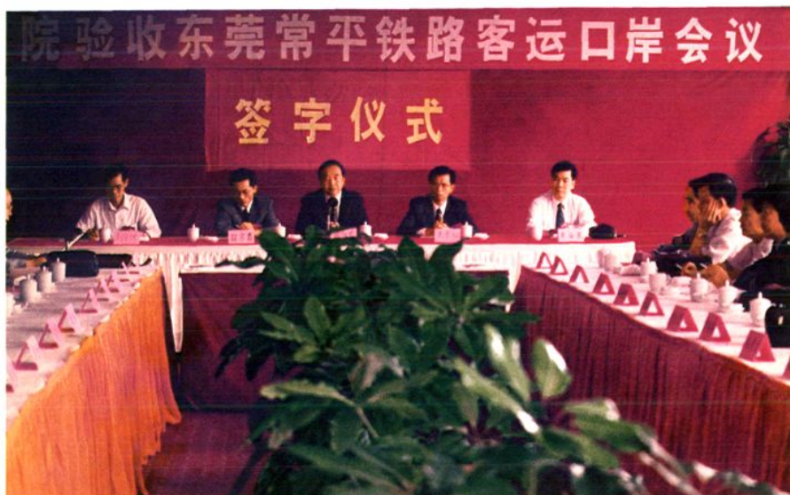
1994年10月19日，国家口岸办副主任胡祖宏出席国务院验收东莞常平铁路客运口岸签字仪式，在台上就座的领导从左到右依次是：市政府副秘书长刘华焯、省口岸办主任翁宗勇、国家口岸办副主任胡祖宏、副市长袁李松、省口岸办副主任黄海泉