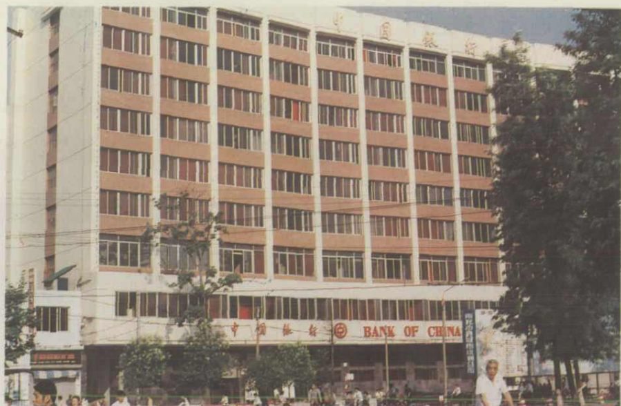
中国银行南充分行