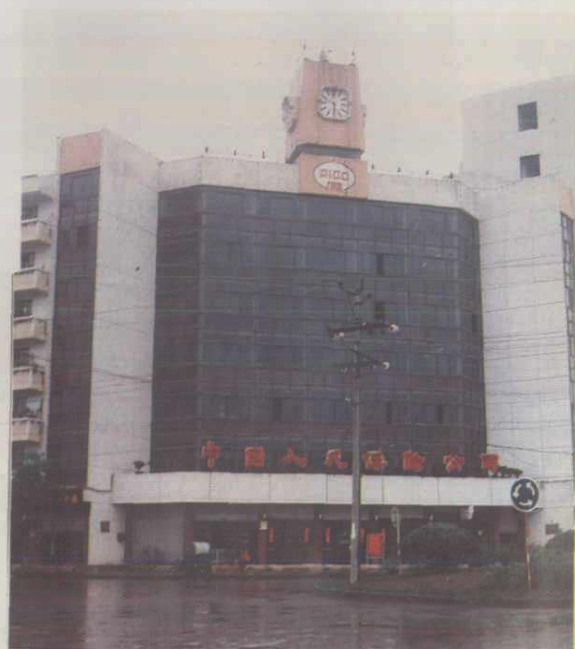
中国人民保险公司南充地区分公司