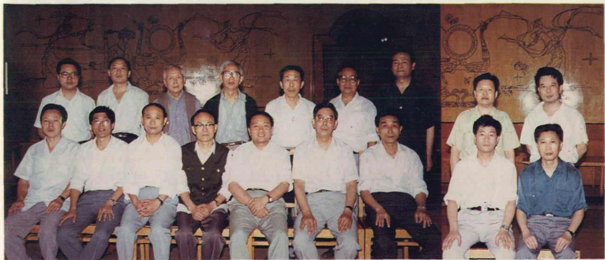
南充地区金融志编审委员会全体委员