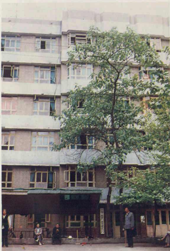
中国工商银行南充地区分行