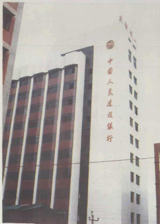
中国人民建设银行南充地区分行