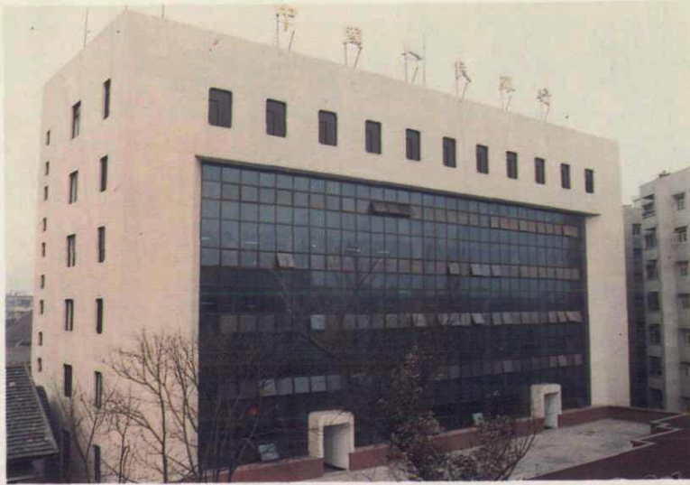
中国人民银行南充地区分行