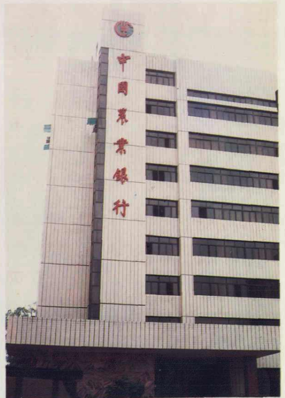
中国农业银行南充地区分行