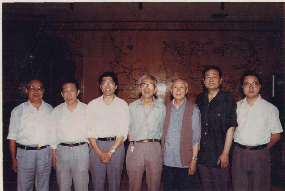
南充地区金融志办公室全体编辑人员