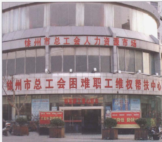
2006年6月,全国总工会副主席、书记处书记苏立清,省人大副主任、省总工会主席张艳,省总工会党组书记李晓布,徐州市委书记徐鸣等为徐州市总工会困难职工维权帮扶中心和爱心超市开业剪彩。