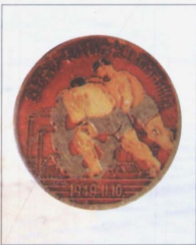
1949年11月10日,徐 州市首届工会会员代表大会 召开,徐州市总工会成立。图 为大会纪念章。