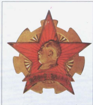
1951年6月,徐州市总工 会颁发的模范工会小组奖章。