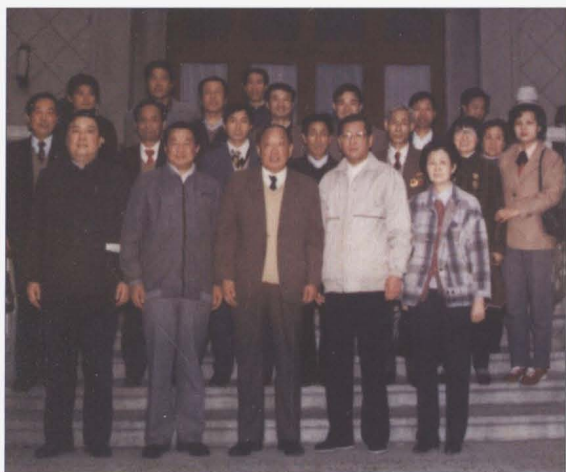
1989年5月,全国总工会主席倪志福 接见徐州矿务局劳模代表。