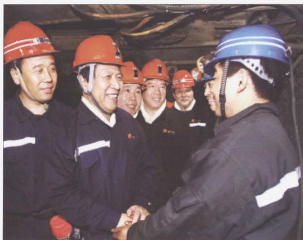
2009年1月15日,江苏省委书记梁保华 慰问旗山煤矿井下职工。