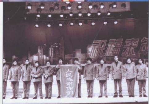
1996年12月28日,在省祝福来年迎97 庆新年联欢会上,中共江苏省委书记陈焕友向 徐州市下水道四班授旗。