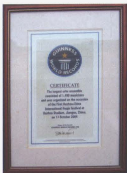
吉尼斯世界纪录证书