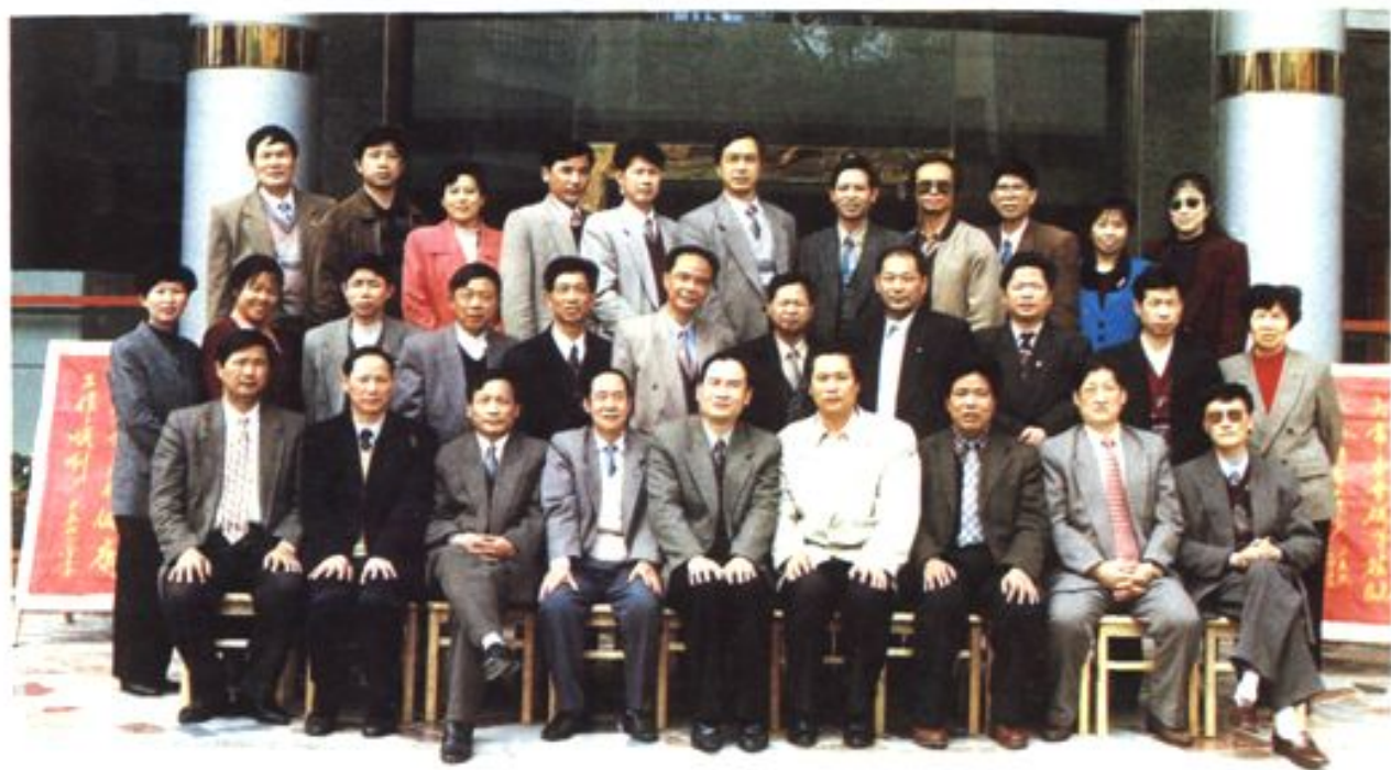
由永泰县人大发起并承办的全国部分县(市)区人大常委会主任第一次工作交流会于 1998 年 3 月 25 日在永泰县举行。图为参加交流会的全体同志合影