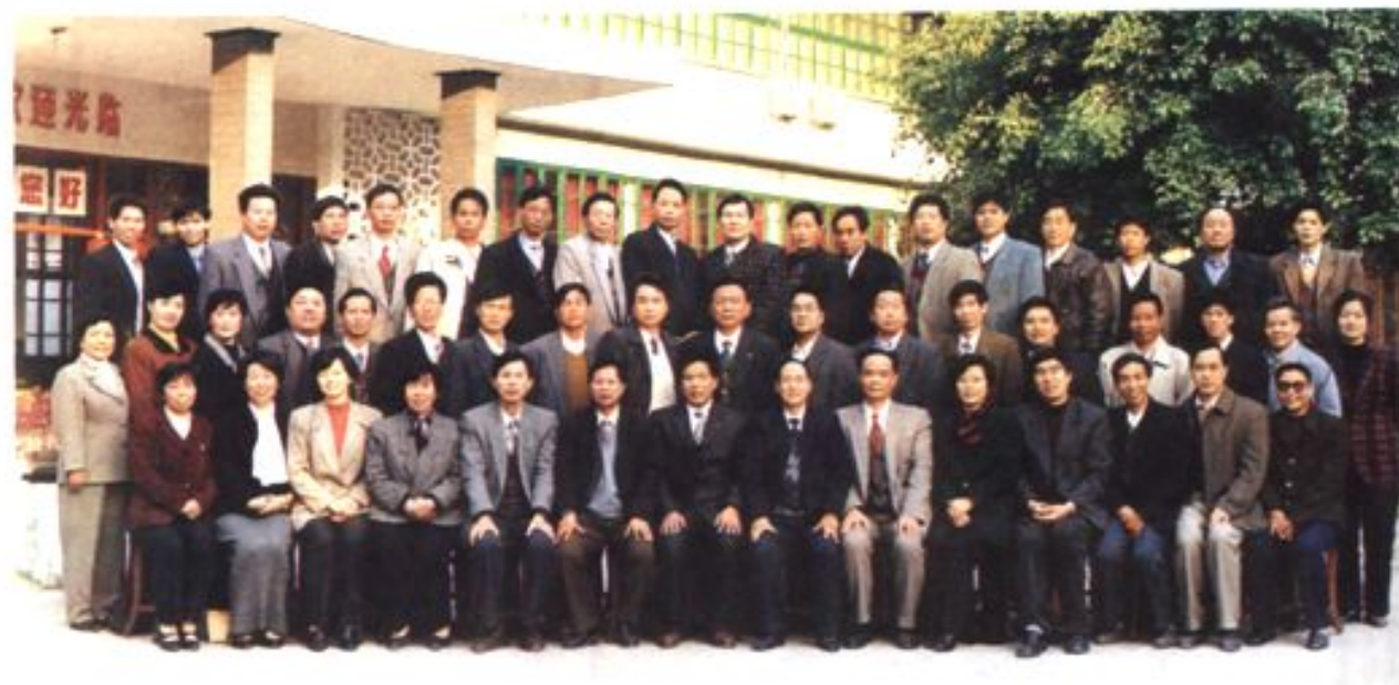
按照地方组织法的规定,县人大常委会会议每两个月至少举行一次。图为 1999 年 1 月 8 日县十二届人大常委会第 40 次会议全体同志合影