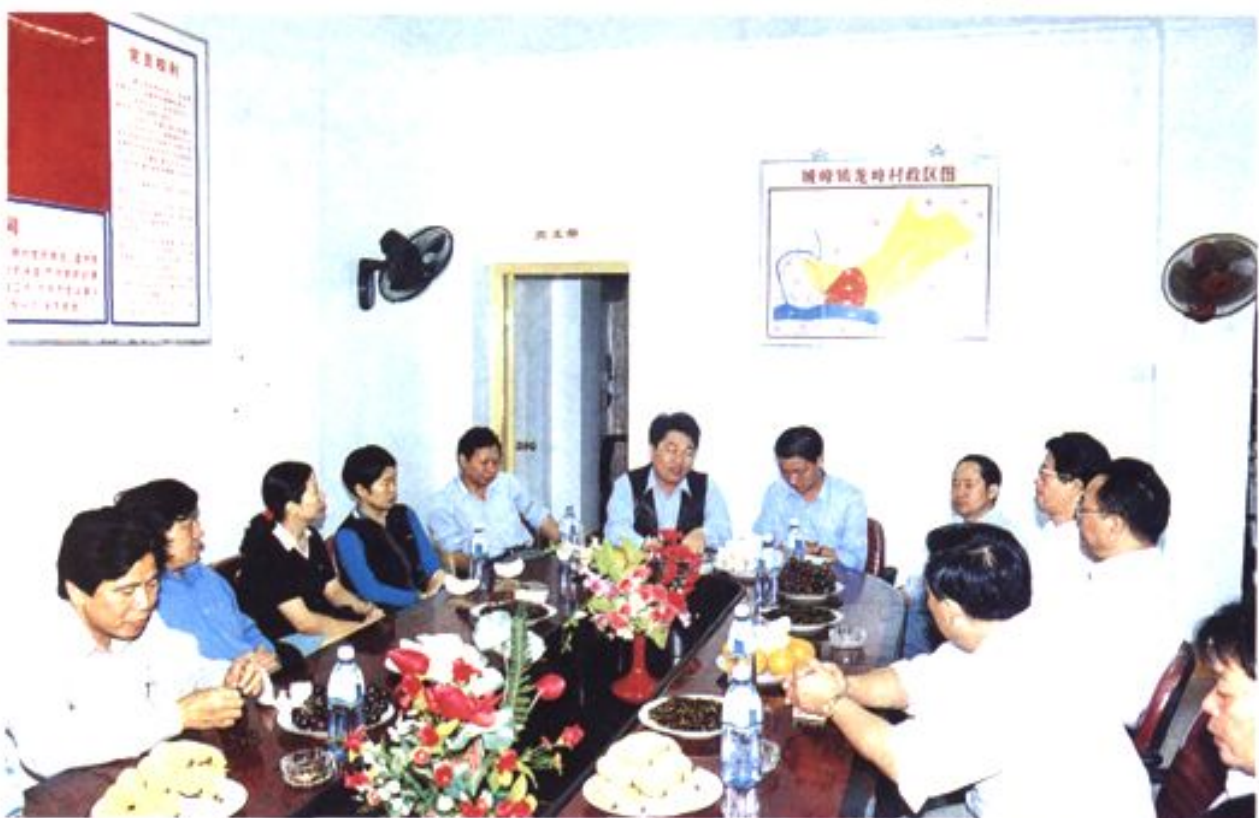
1998年10月30日,省人大代表活动(一)小组全体代表视察永泰县农村工作。图为城峰镇和龙峰村领导向代表介绍村务公开情况