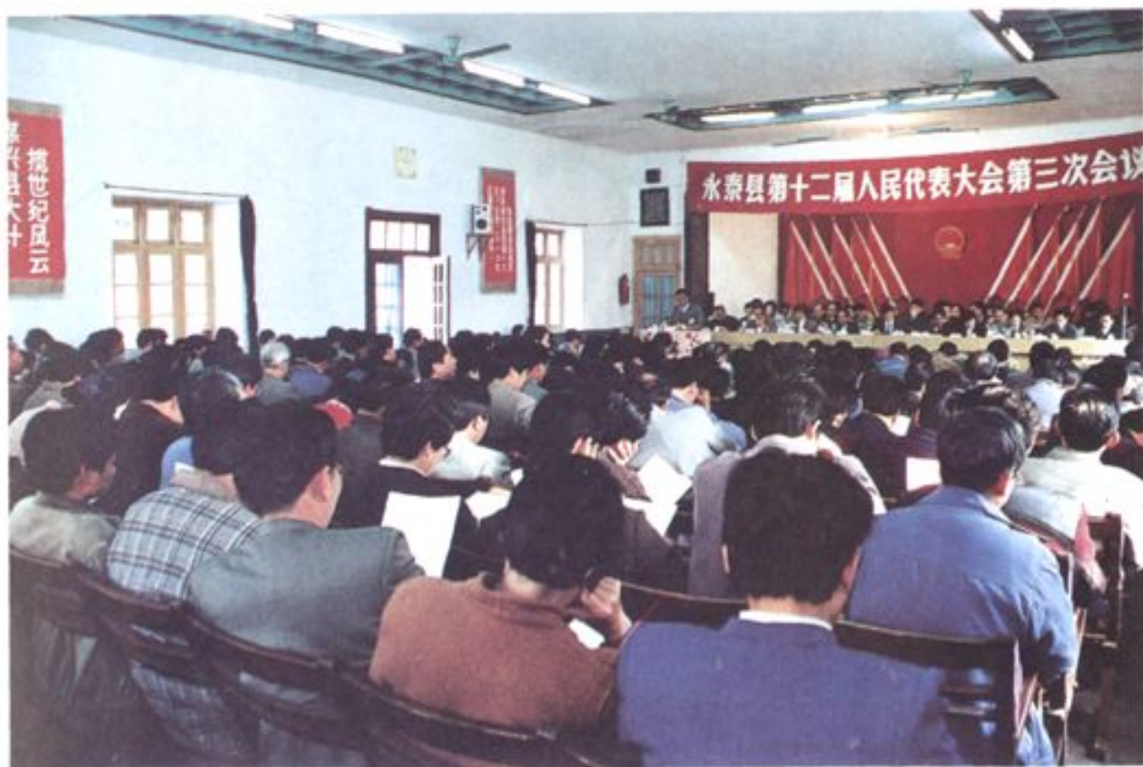
县人民代表大会历次会议会场