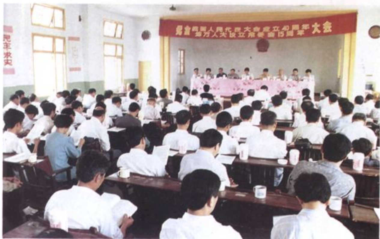
1994年9月，县开展系列活动，纪念我国人大建立40周年和地方人大常委会成立15周年。图为9月26日县委在党校小礼堂举行的纪念大会会场