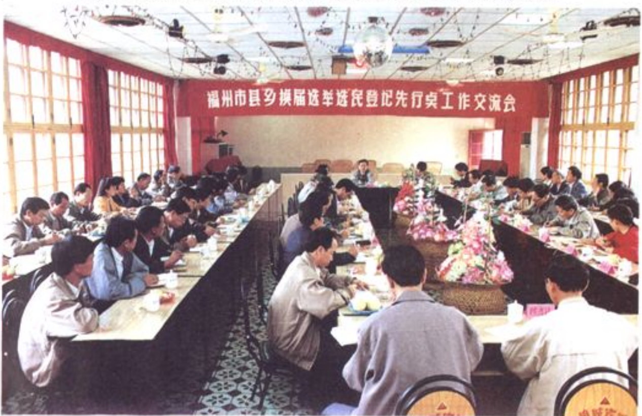
1993年10月26日，在永泰县和同安镇分别召开福州市县乡换届选举选民登记先行点工作交流会