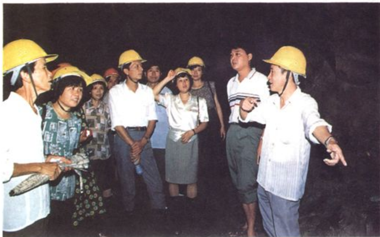
1995年5月下旬,在漳的省、市人大代表视察富泉溪三级水电工程工地