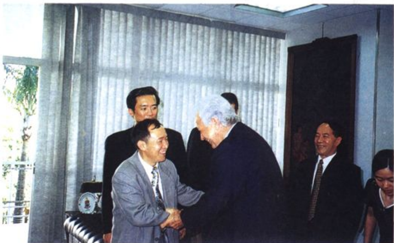
应巴西坎皮纳斯市议会的邀请,福州市人大常委会代表团于1998年11月赴该市访问,受到该市市长、议长接见