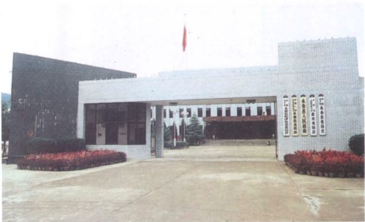
县委、人大、政府、政协、纪委办公大院