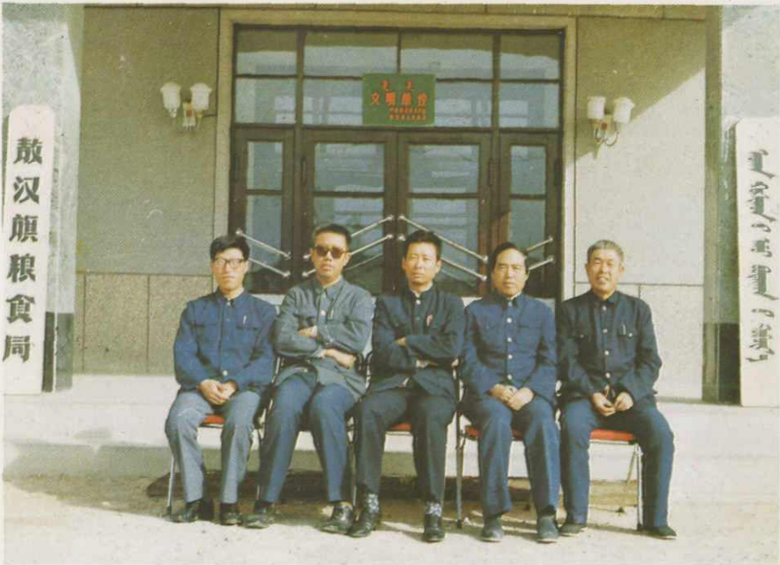
敖汉旗粮食局党总支委员会全体成员合影