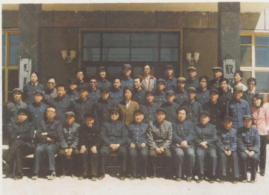
敖汉旗粮食志评审人员全体合影