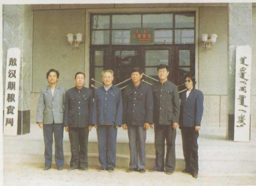
粮食局志编办公室工作人员合影