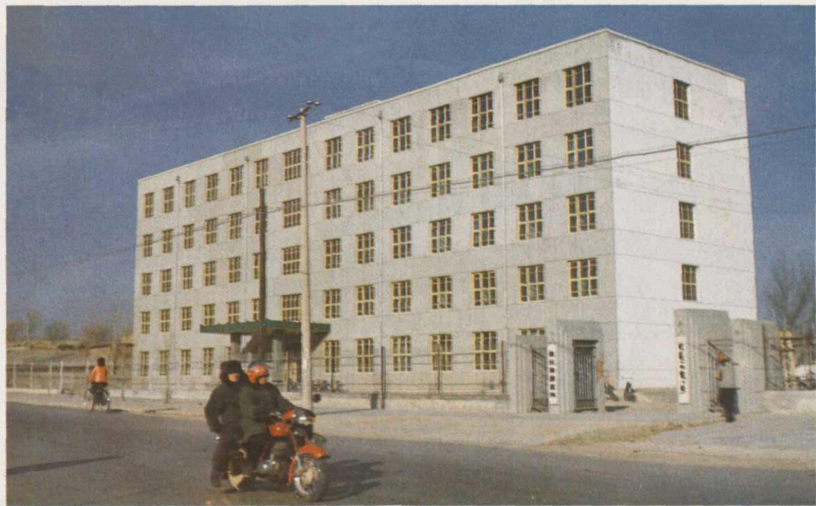
敖汉旗粮食局办公大楼全景