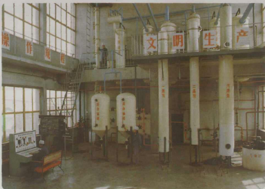
粮油厂油浸车间全景