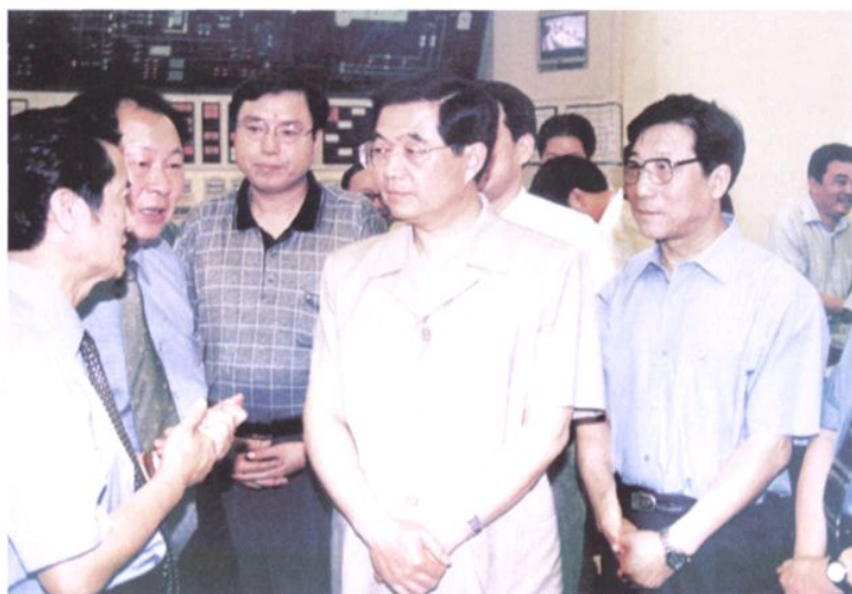
2002年6月23日, 中共中央政治局常委、国家副主席胡锦涛(中)视察秦山核电站二期工程