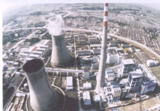
浙江华能长兴发电厂