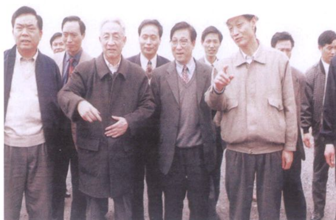
1998年4月10日，全国人大 常委会副委员长邹家华(前左二) 考察天荒坪抽水蓄能电站