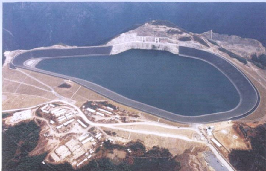
天荒坪抽水蓄能电站上水库