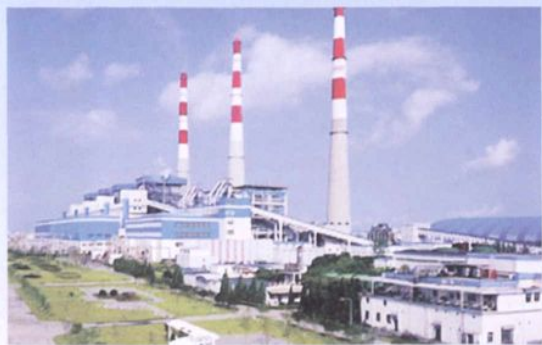
浙江省合资兴建的温州发电厂