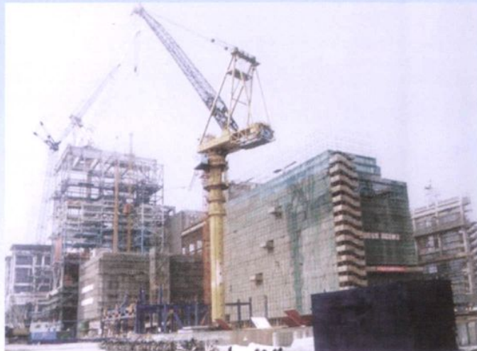
温州发电厂二期(2 × 30 万千瓦)扩建工程施工现场