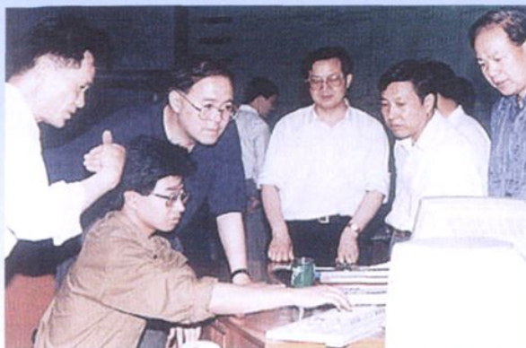
1993年7月，浙江省省长万学远(左三)考察浙江省电力工业局中心调度所