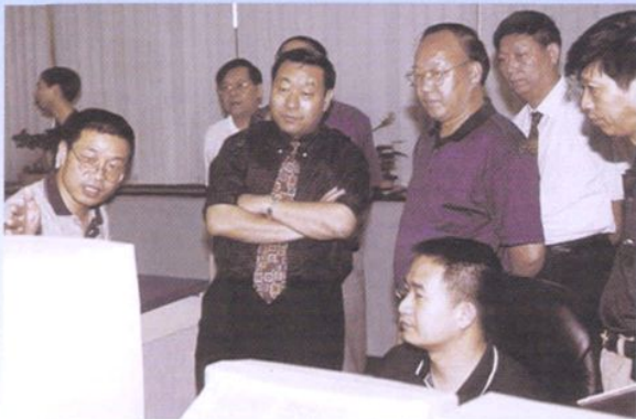
2001年6月，国家 电力公司副总经理刘 振亚(前左二)到浙江省 电力公司指导工作