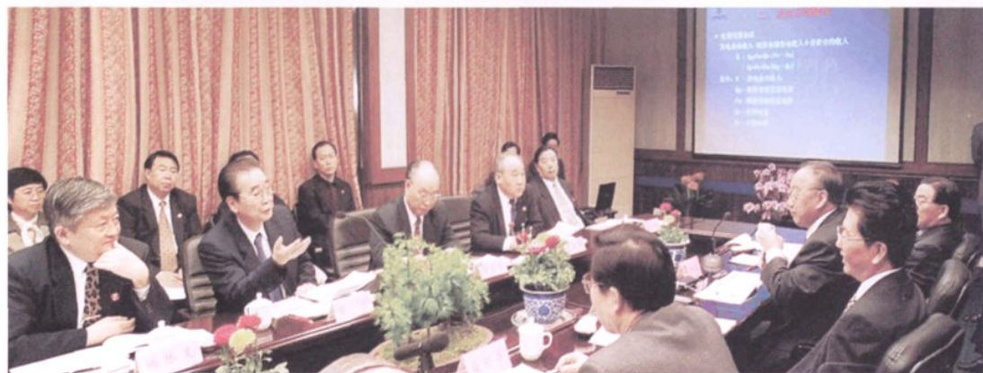
2001年4月10日, 中共中央政治局常委、全国人大常委会委员长李鹏(左二)在浙江作电力改革调研