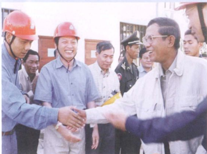
2001年12月17日，柬埔寨首相洪森(右一)视察由浙江省送变电工程公司承建的基里隆输变电工程