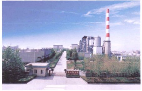
杭州乔司垃圾焚烧发电厂