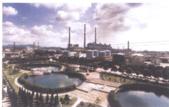
浙江省第一座超百万千瓦的大型港口火力发电厂——镇海发电厂