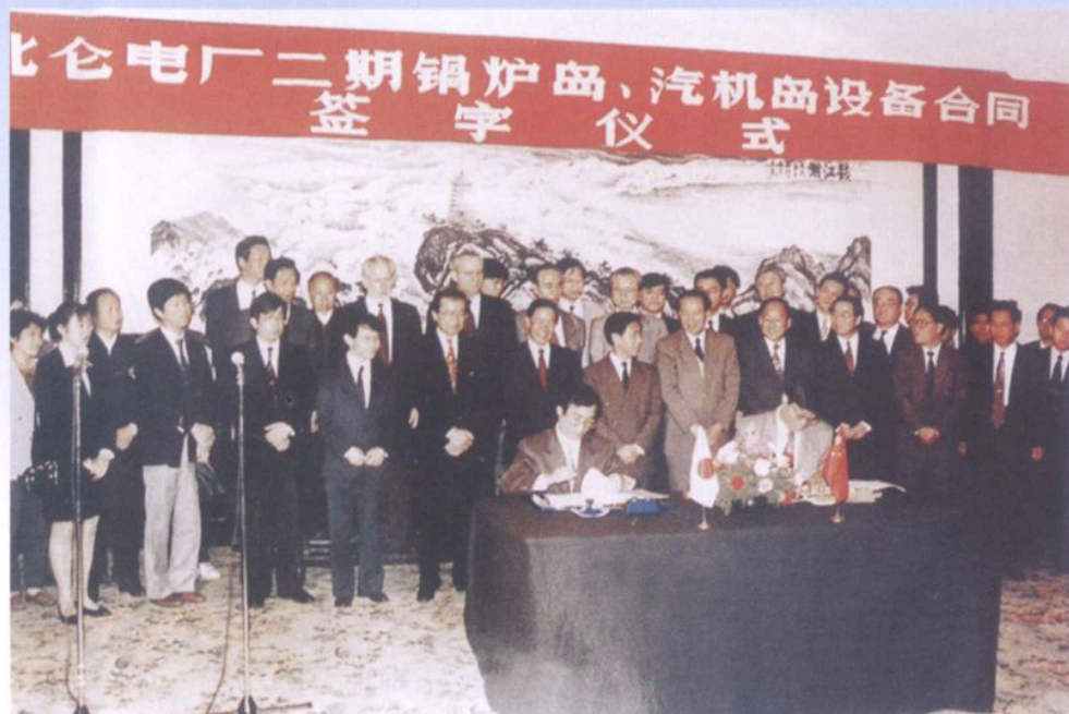
1994年，北仑发电厂二期锅炉岛、汽机岛设备合同签字仪式