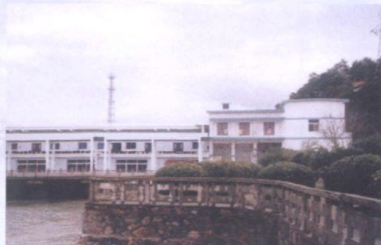
江夏潮汐试验电站