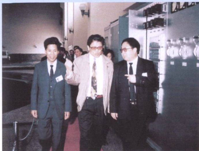
1997年5月15日，国务委员 李铁映(中)视察富春江水电厂