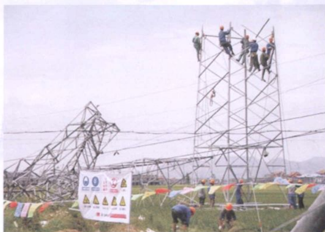
抢建台风受损铁塔