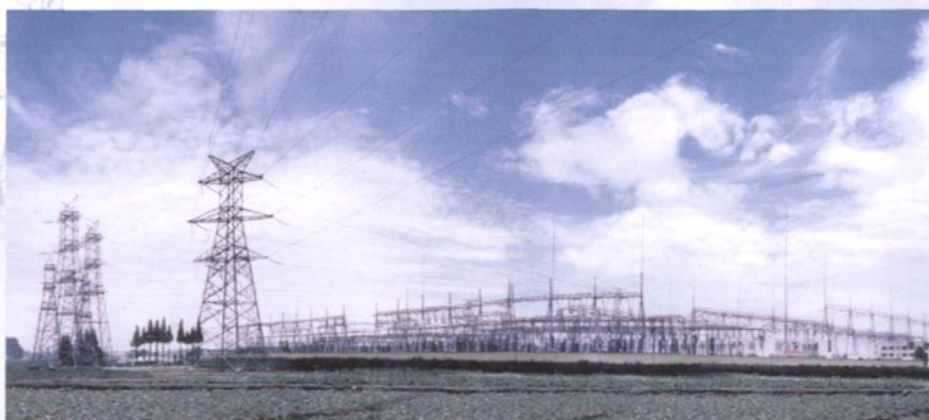
500 千伏 双龙变电所