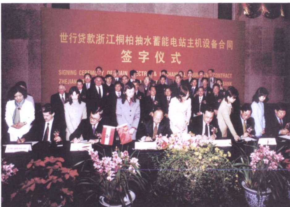
2002年1月14日，世行贷款浙江桐柏抽水蓄能电站主机设备合同签订仪式