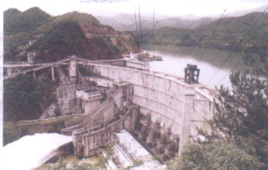
浙江电网主要调频、调峰电厂——紧水滩水电厂