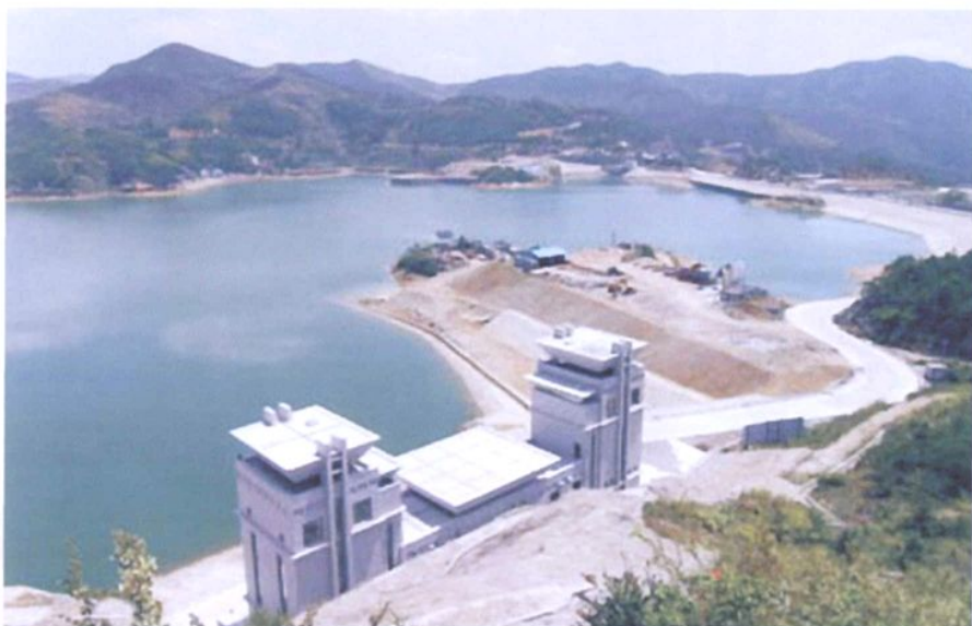
浙江桐柏抽水蓄能电站