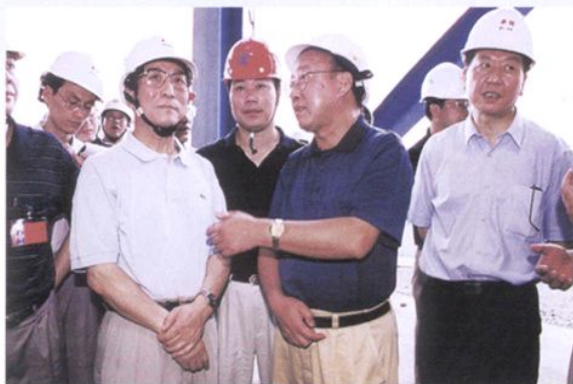
2001年7月25 日，浙江省省长柴 松岳(前左一)考察 长兴发电厂二期工 程建设