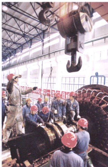
镇海发电厂工人检修汽轮发电机组