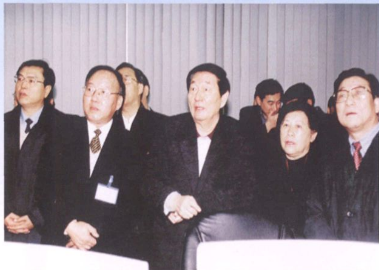
2000年12月, 中共中央政治局常委、国务院总理朱镕基(中)视察浙江电力调度通信中心