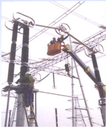
500 千伏温州瓯海变电所安装建设