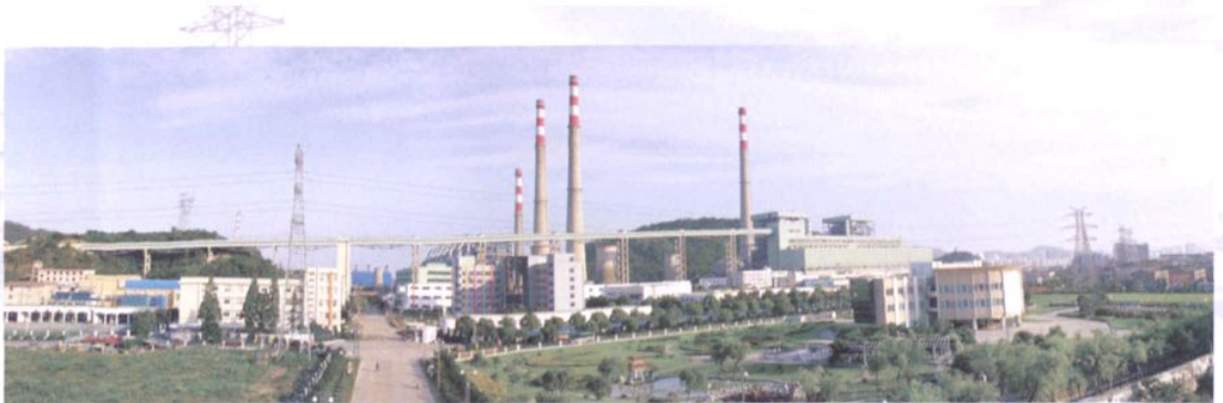
浙江省第一座股份制发电厂——台州发电厂