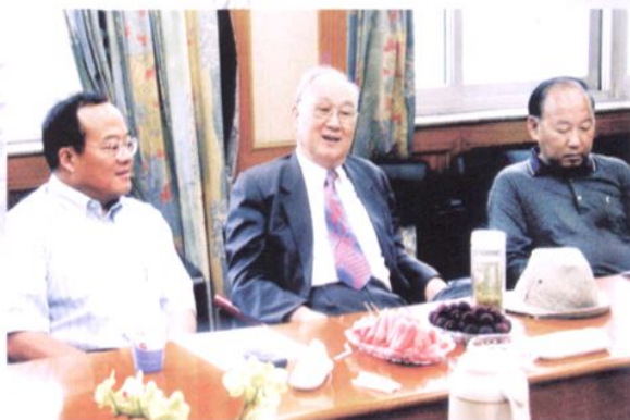
2000年7月，原能 源部部长黄毅诚(中) 在浙江省电力公司总经 理陈积民(右)、副总经 理庄虎卿(左)陪同下 视察工作