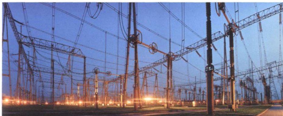
500 千伏 王店变电所