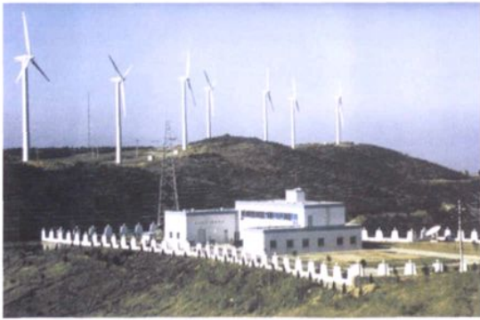
1998年12月竣工的苍南鹤顶山风力发电场