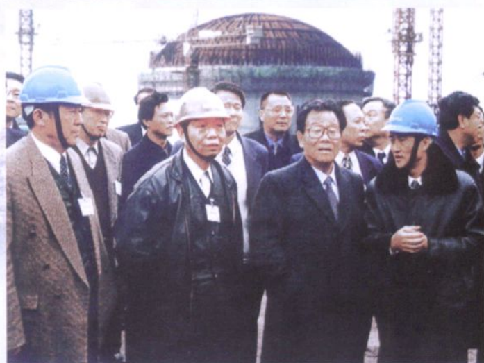
2000年2月，全国政协主席 李瑞环(前右二)视察秦山核电站