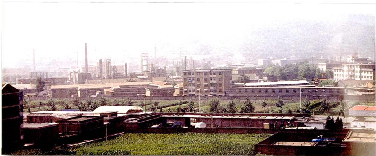
平定县化肥厂远眺