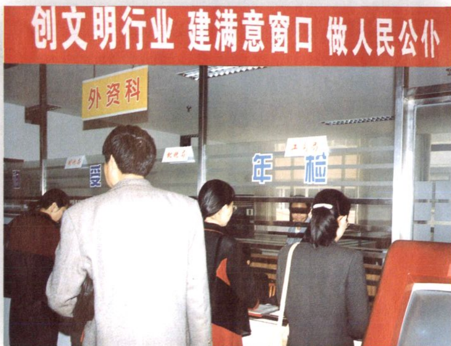
▲ 注册大厅建人民满意“窗口”