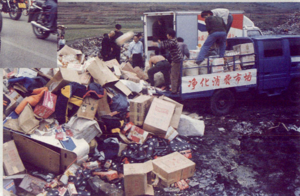
▲ 销毁假冒伪劣商品净化市场