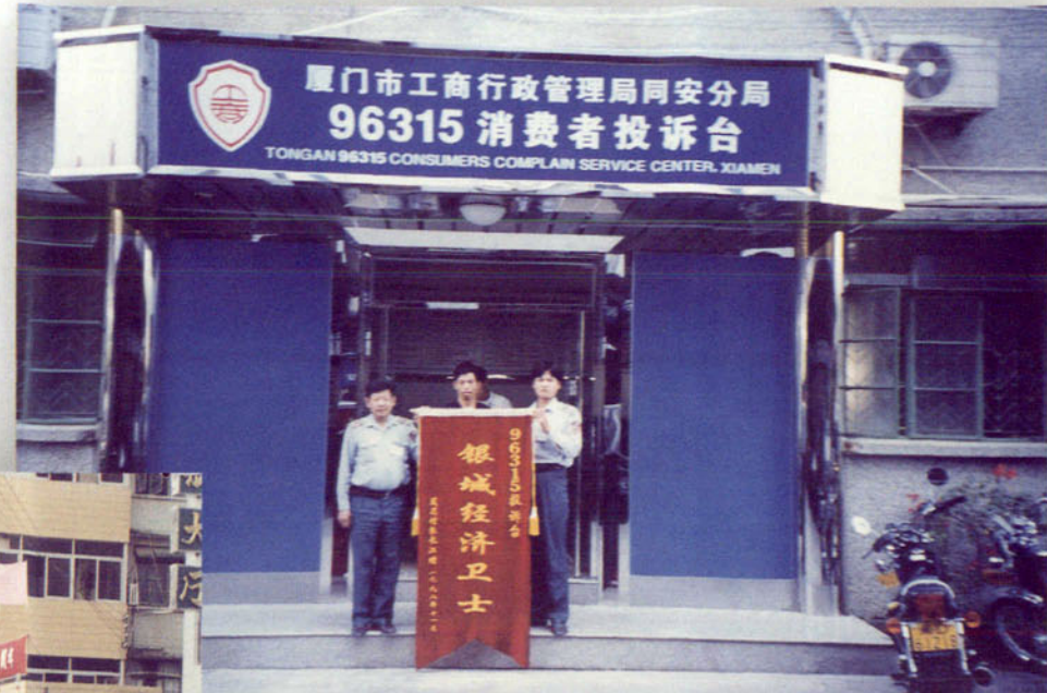
▲ “96315” 消费者投诉台为民排忧解难