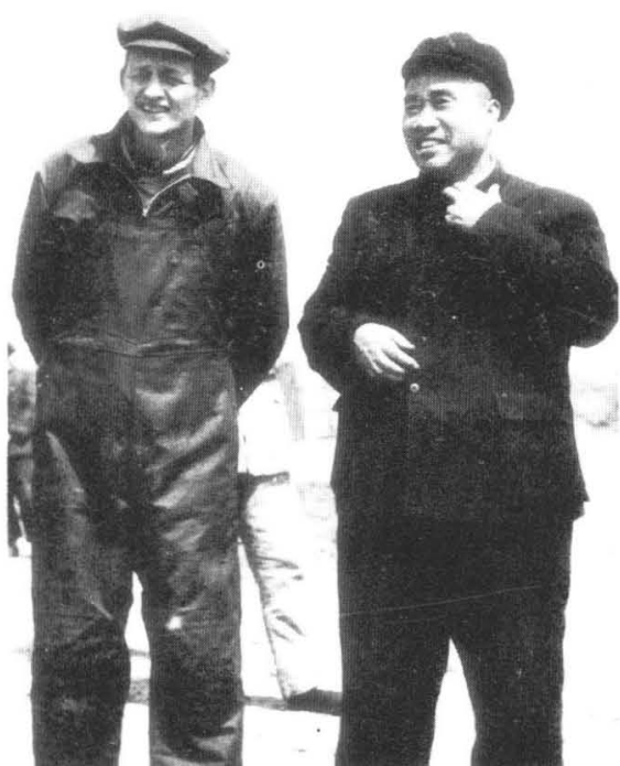
朱德同志到东北旺农场视察 与拖拉机手交谈(1963年)