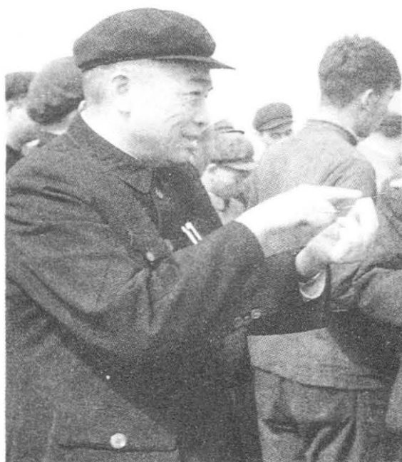
彭德怀同志与 农场工人交谈(1963年)