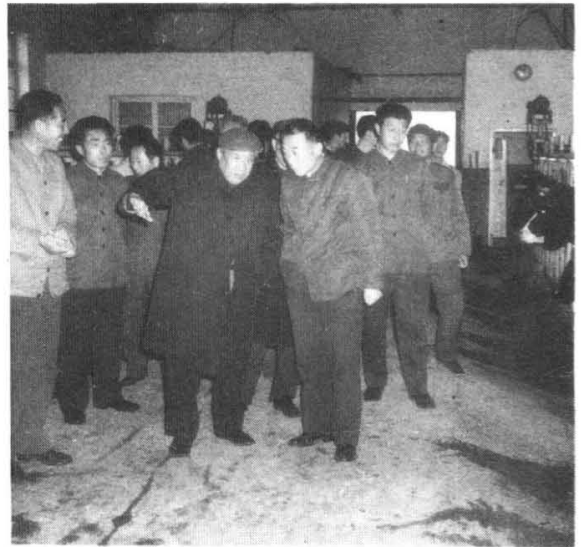
聂荣臻同志到农场 视察农田基本建设(1950年)