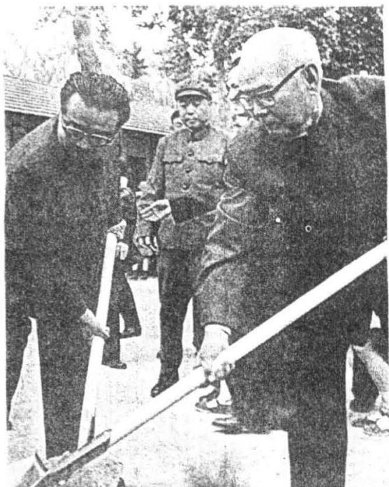
叶剑英同志与金日成主席 在南郊共栽中朝友谊树(1975年)