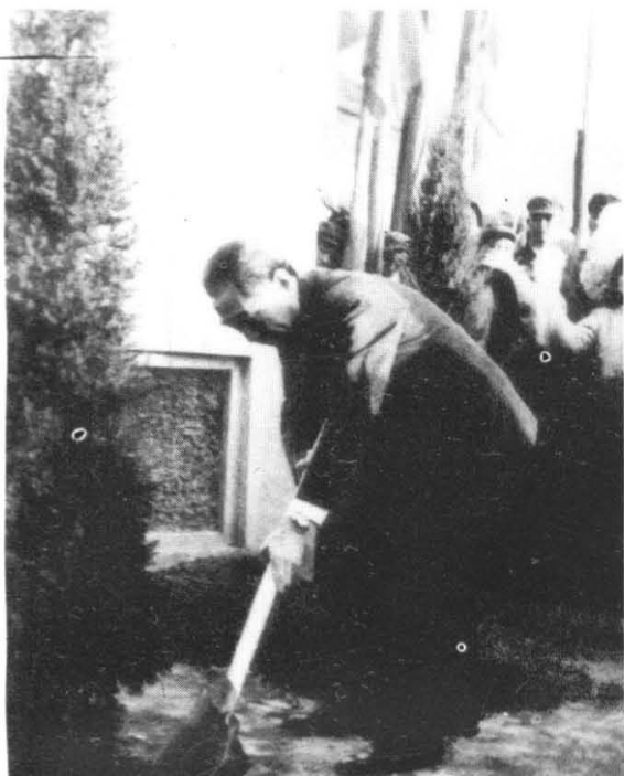
周恩来同志在 长阳农场(1971年)