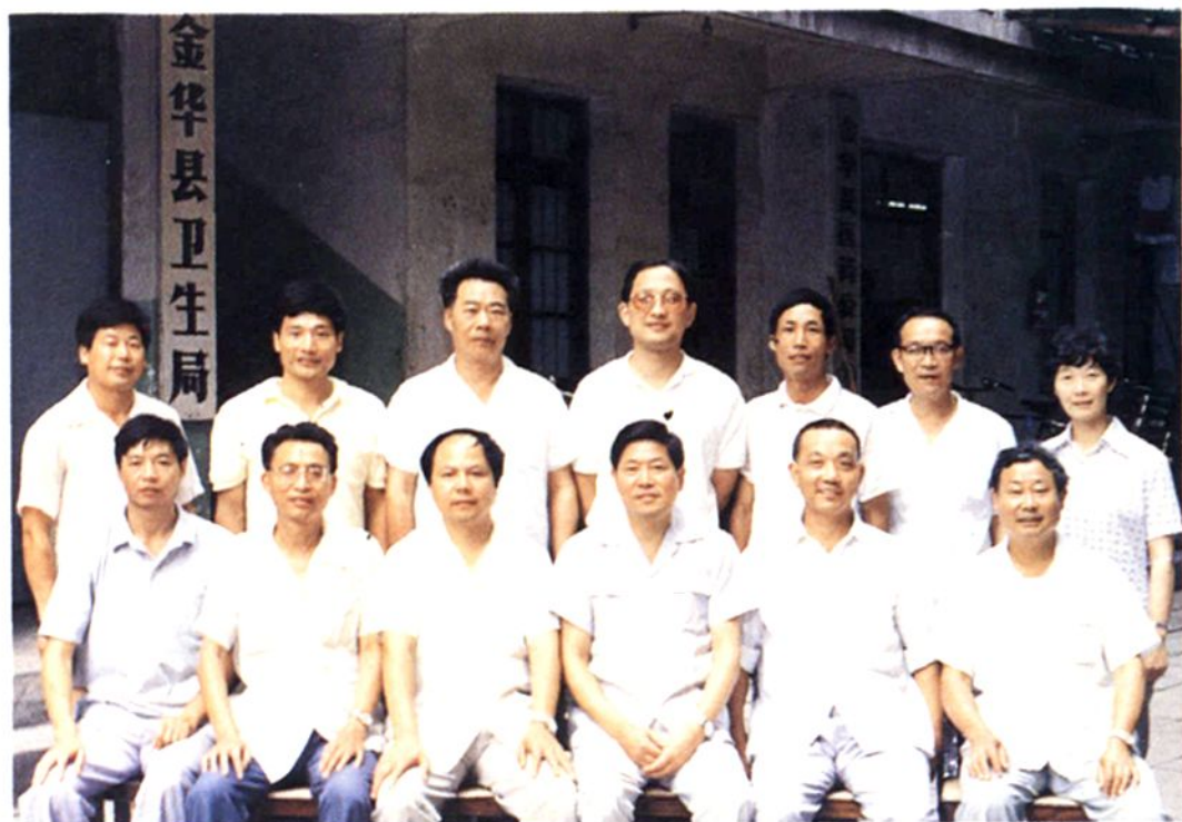
省、市卫生厅(局)领导检查金华卫生工作