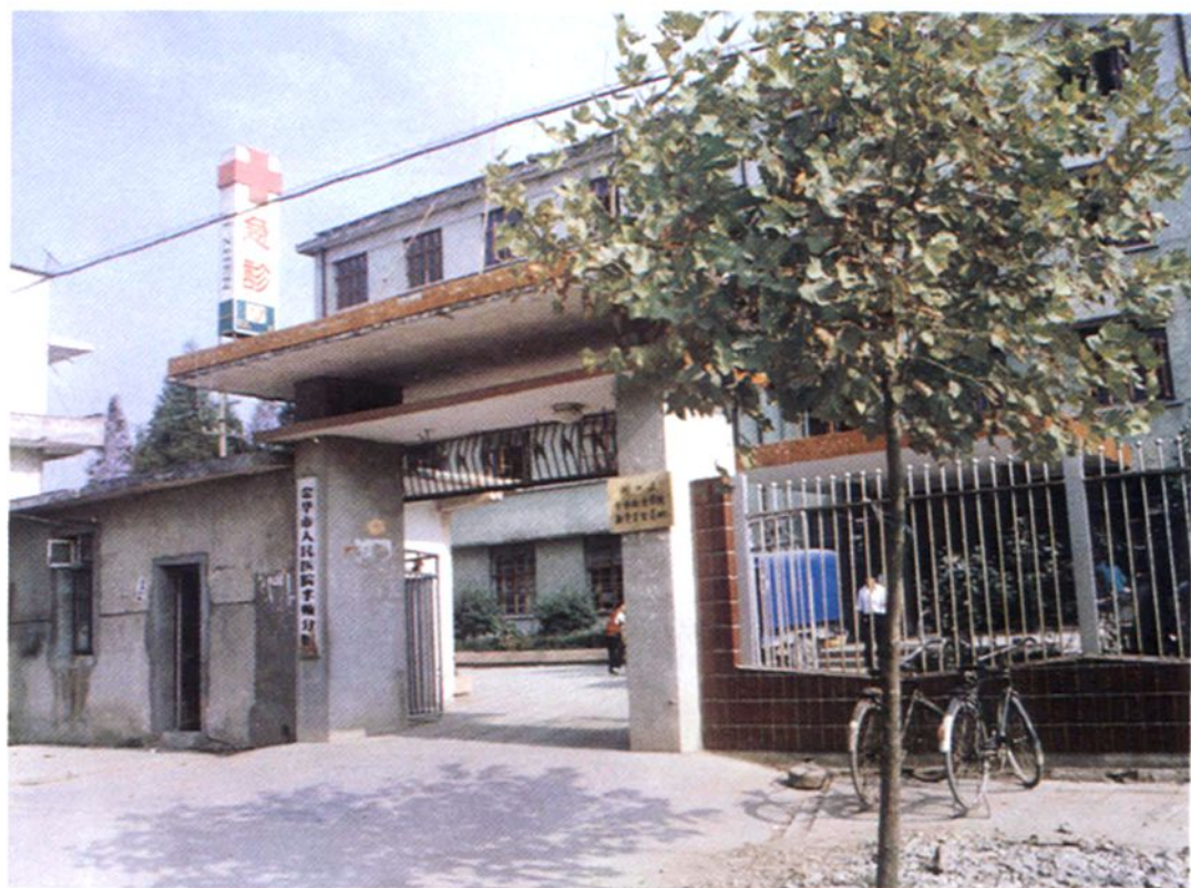
金华市人民医院孝顺分院门诊楼