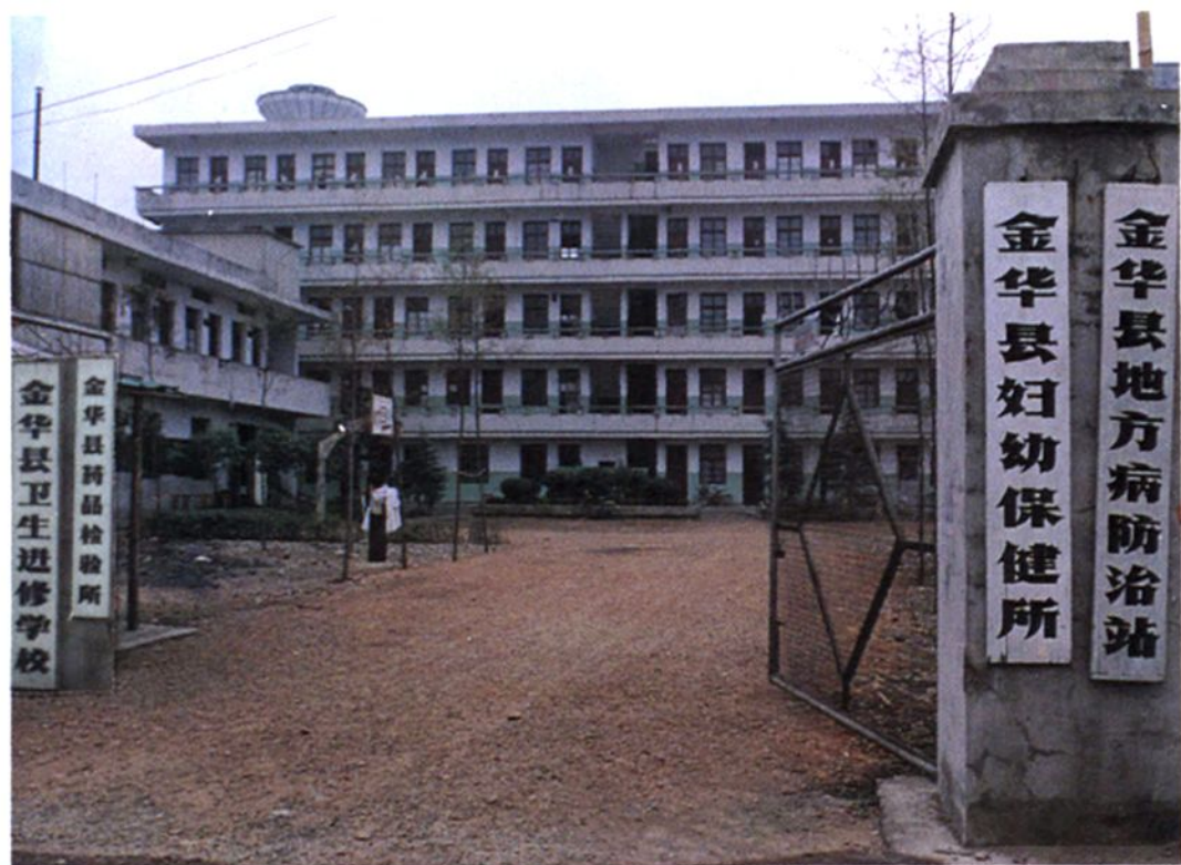
金华市卫生进修学校、地方病防治站、药物检验所业务教学、工作用房