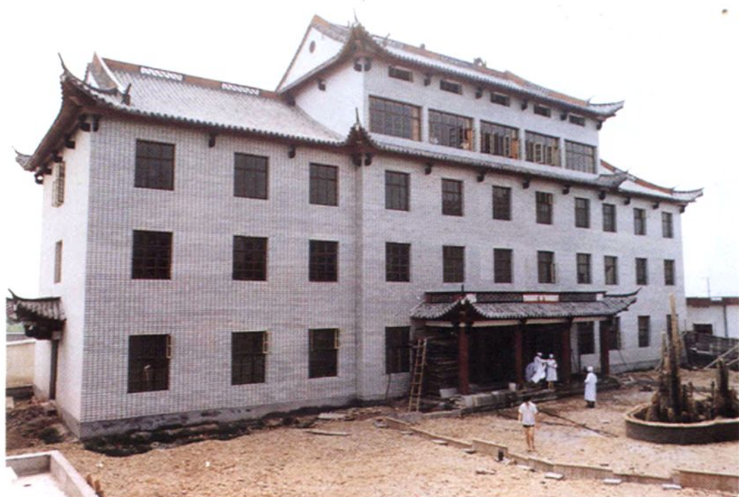
罗埠镇中心卫生院门诊楼