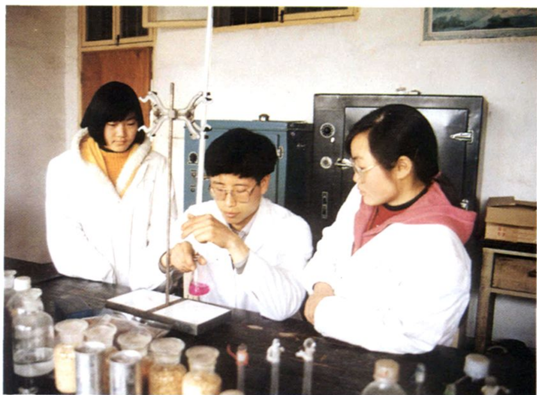
金华市卫生防疫站检验科人员在工作