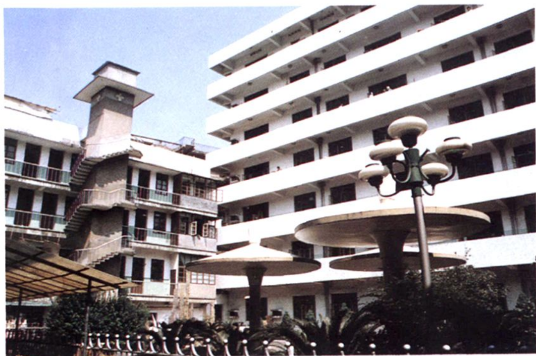
金华市人民医院住院楼一角