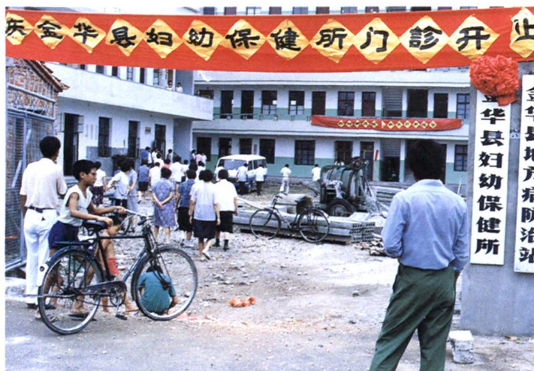
金华市妇保所门诊开业