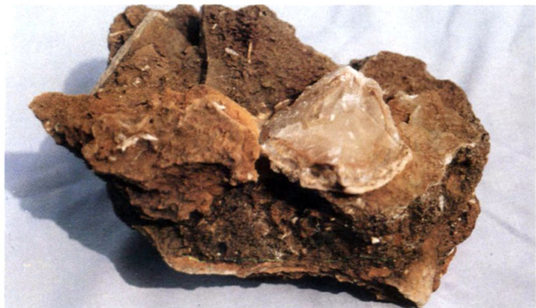
1983年在山桥乡洞殿下村发现丁螺化石，经南京大学地理系兼 ^{14}\text{C} 实验室测定，为丁钙螺胶结层。距今已有3680年左右的历史。