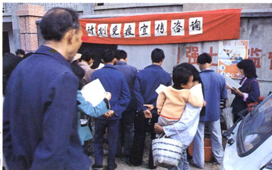
卫生防疫人员深入农村开展计划免疫宣传咨询活动