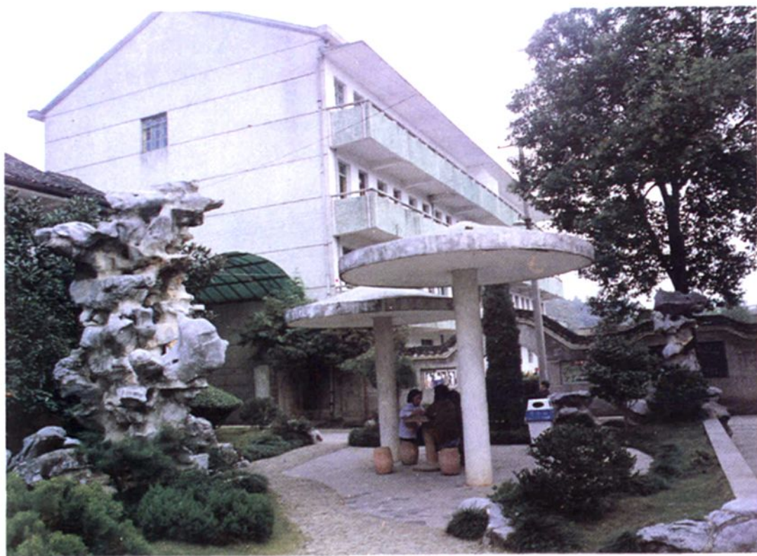
金华县第二人民医院住院楼