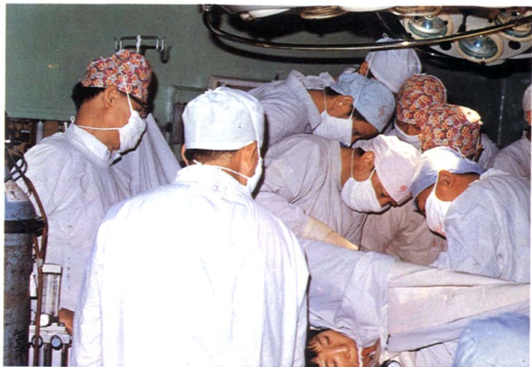
人民医院外科医务人员在手术室抢救病人