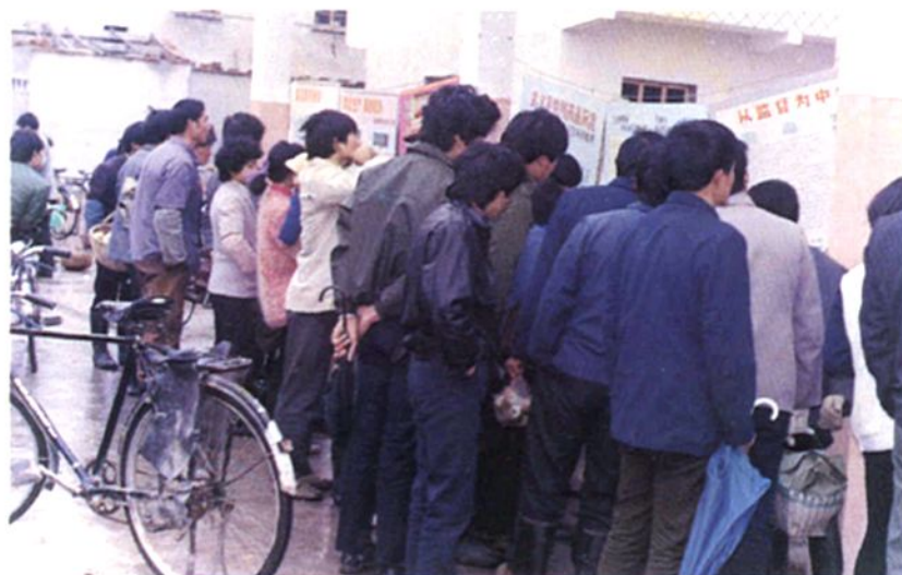
金华县药检所药检人员深入基层开展真假伪劣药品鉴别咨询服务