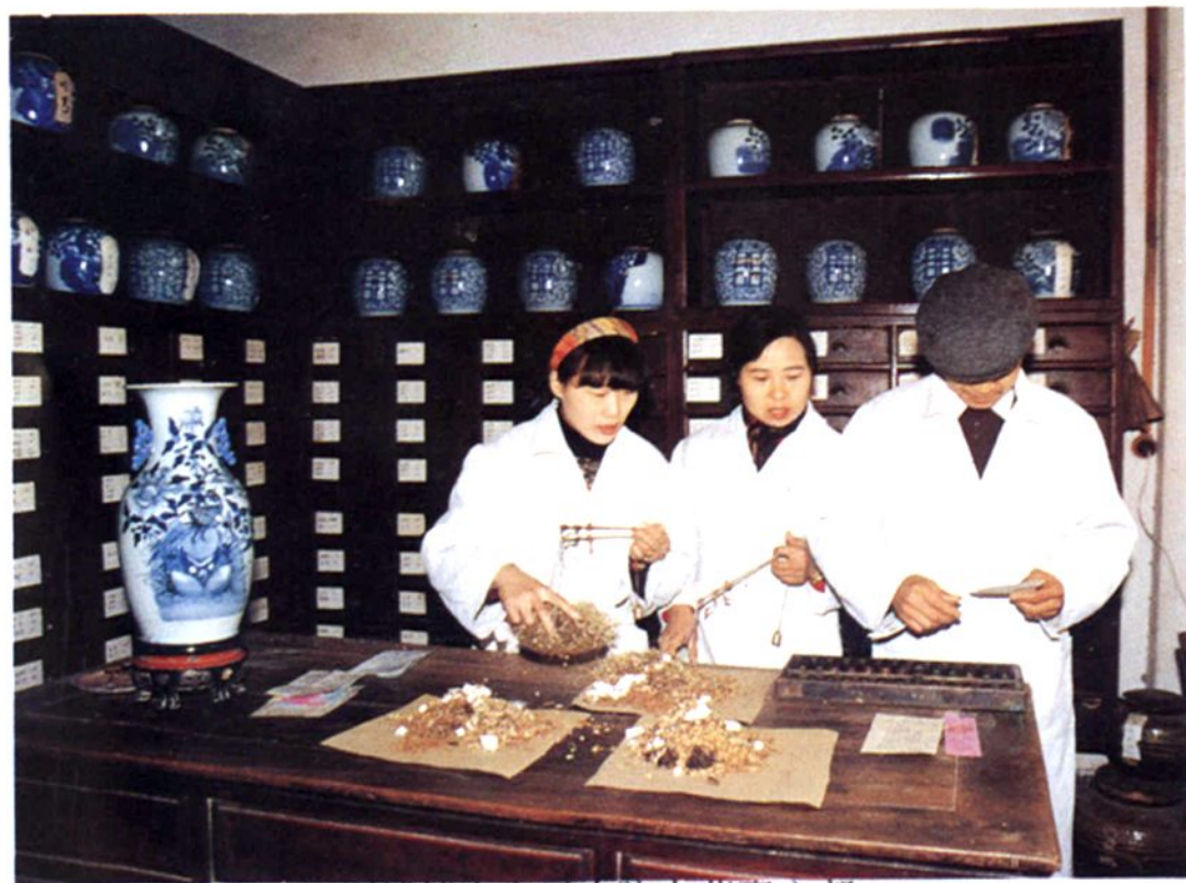
湮浦镇中心卫生院中药配方部