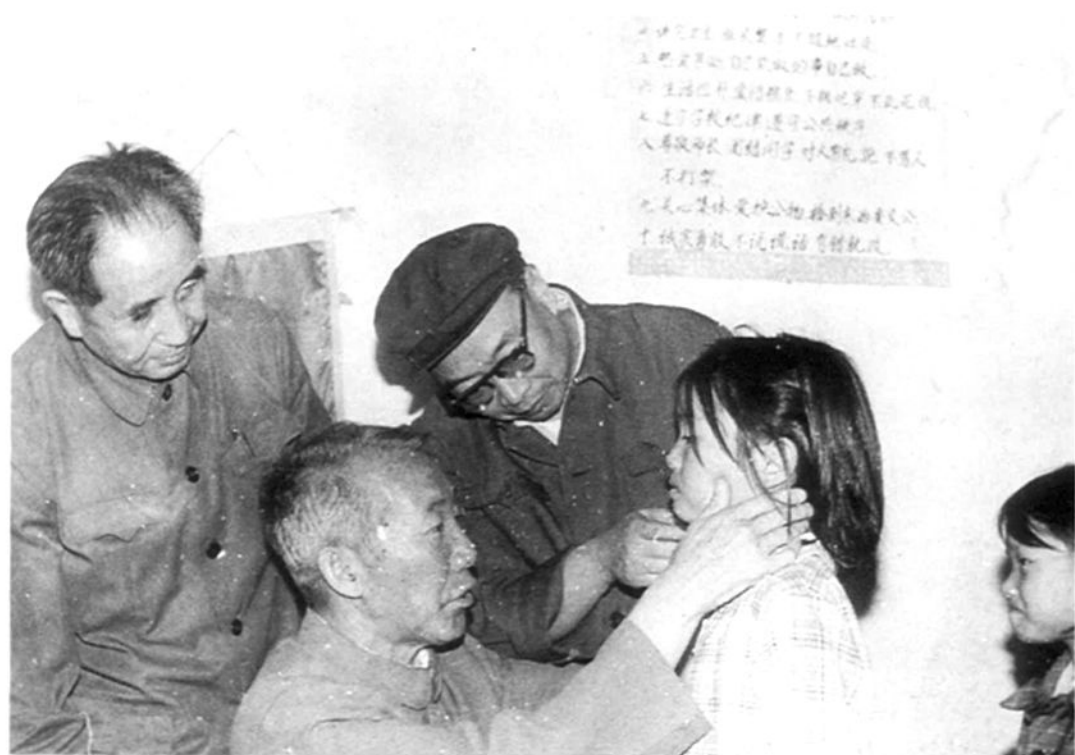
专家组成员、河北医学院于志恒教授给学生检查地甲病