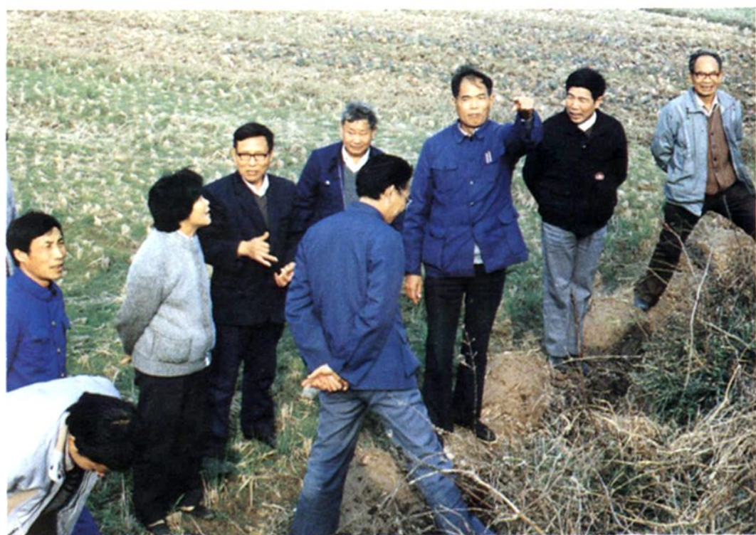
省、市、县、镇四级领导在雅畈镇南干村钉螺现场研究灭螺对策