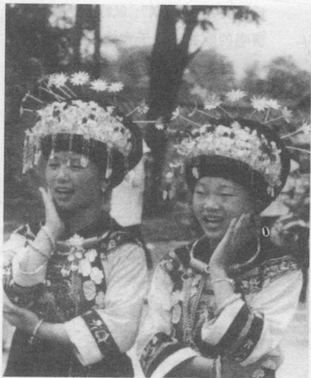
图 36 苗族姑娘唱游方歌

我们来游方， 还不见月亮， 月儿已西沉， 离别吧姑娘。 爹妈砍荆棘， 把菜园围上， 不拦妹游方，