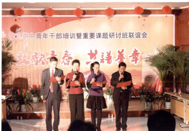
第九期中青班自编自演的联谊会。