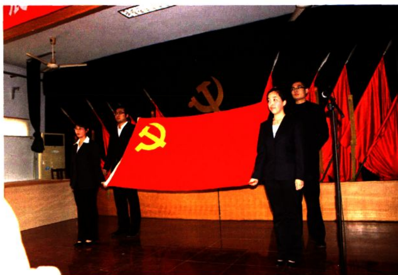
入党积极分子培训班上，学员举行向党宣誓活动。