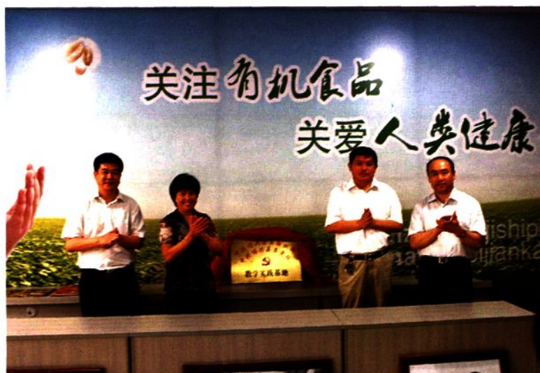
博兴县委党校确定龙升集团为教学实践基地。图为挂牌仪式。