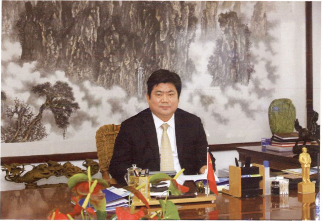
中共博兴县委书记、博兴县人大常委会主任、中共博兴县委党校校长李家良