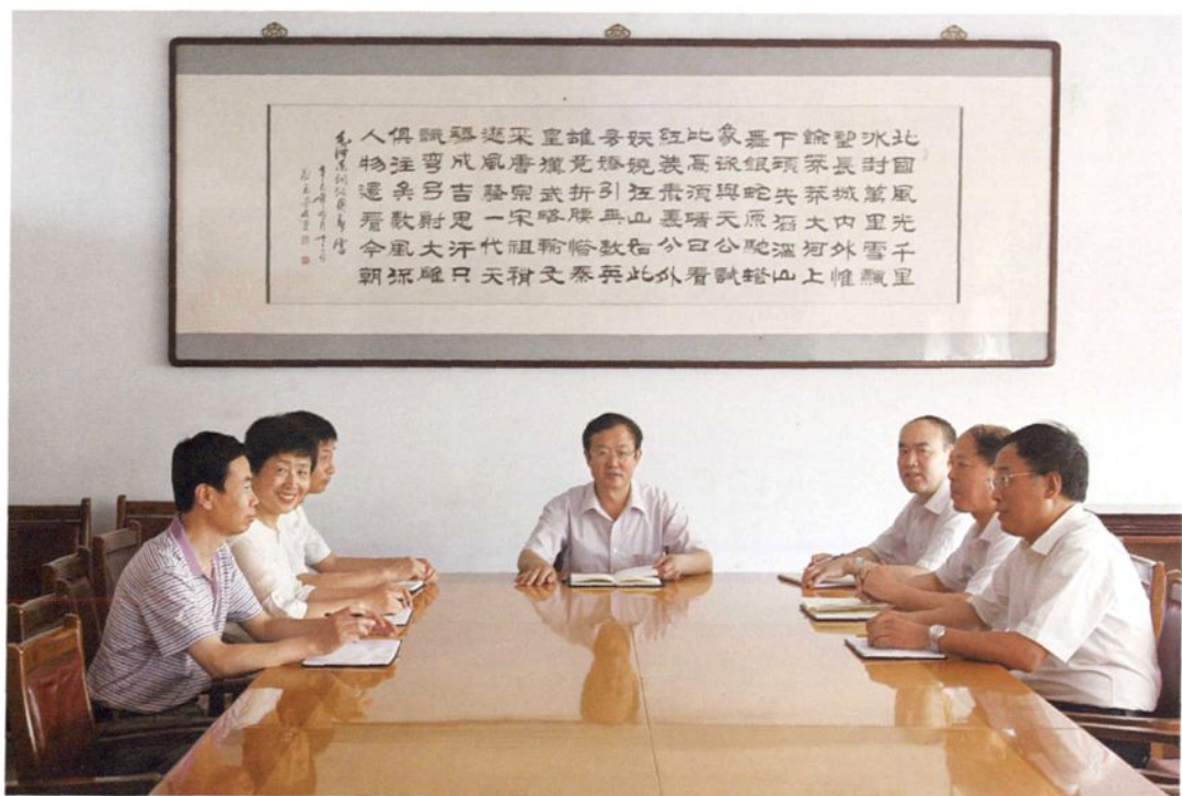
2011年6月29日，博兴县委党校领导班子研究工作。