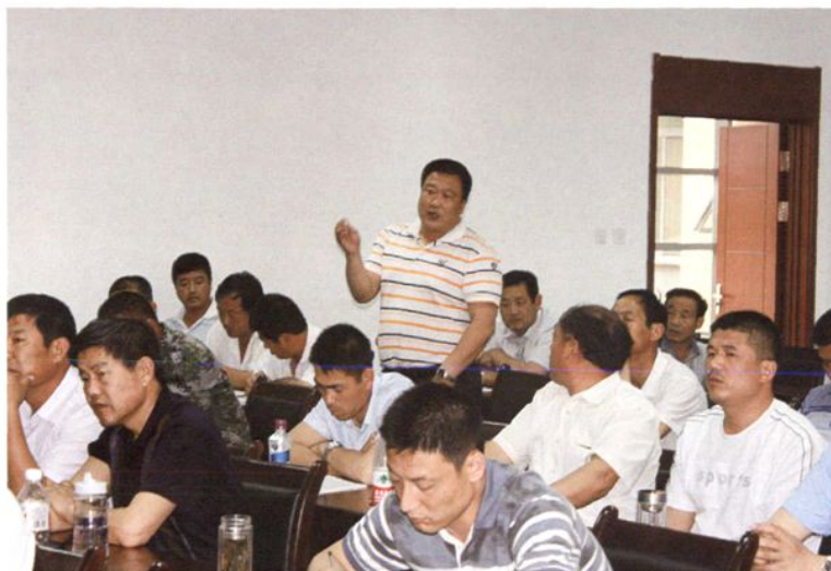
2011年5月29日，博兴县农村主职干部培训班按照不同类型赴苏州、潍坊等地培训。图为在潍坊培训班上，学员与老师交流情景。