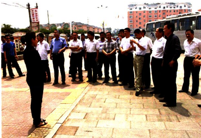
2011年5月31日，博兴县农村主职干部在潍坊市诸城土墙社区参观农村社区建设。