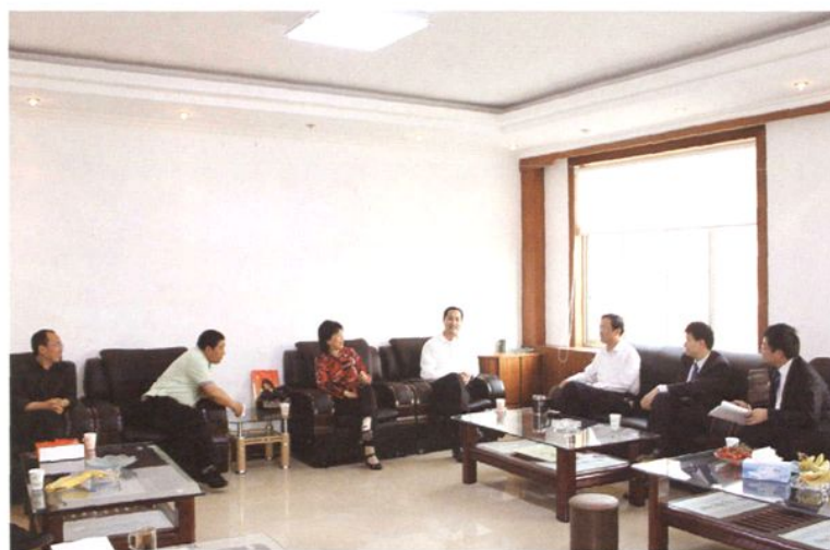
上海交大教授跟博兴县企业家座谈。