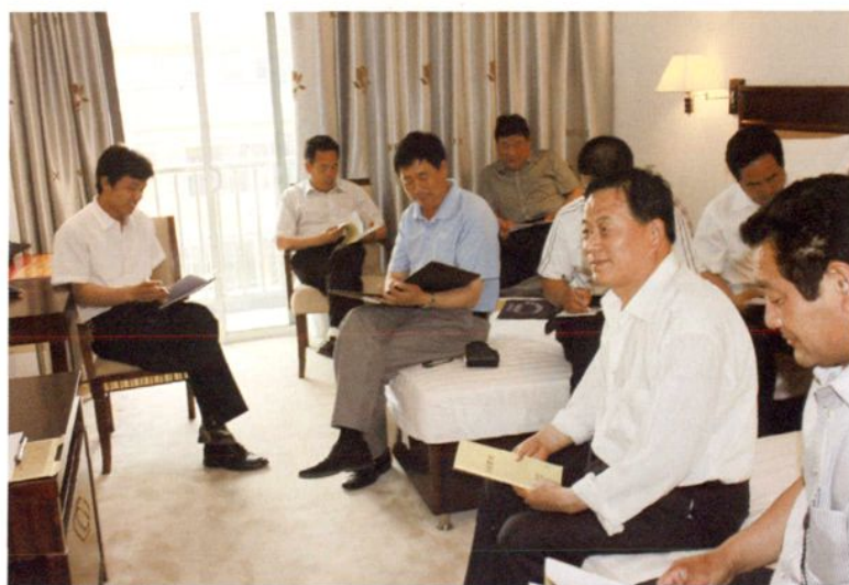
2011年5月30日，农村两委主职干部在潍坊市委党校封闭培训。图为学员利用晚上时间在宿舍讨论。