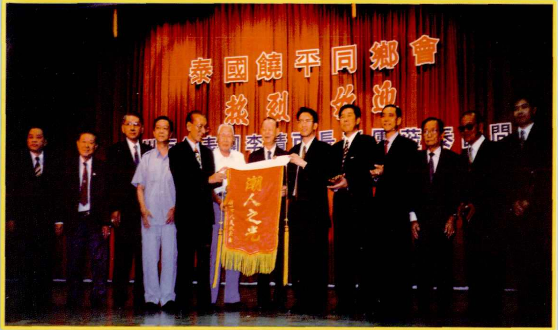
1998年7月，泰國饒平同鄉會舉行歡迎會，歡迎并宴請潮州市市長李清率領的代表團赴泰訪問。左起第五歐史里、六吳文韋、七金崇儒、八李清、九陳浩文