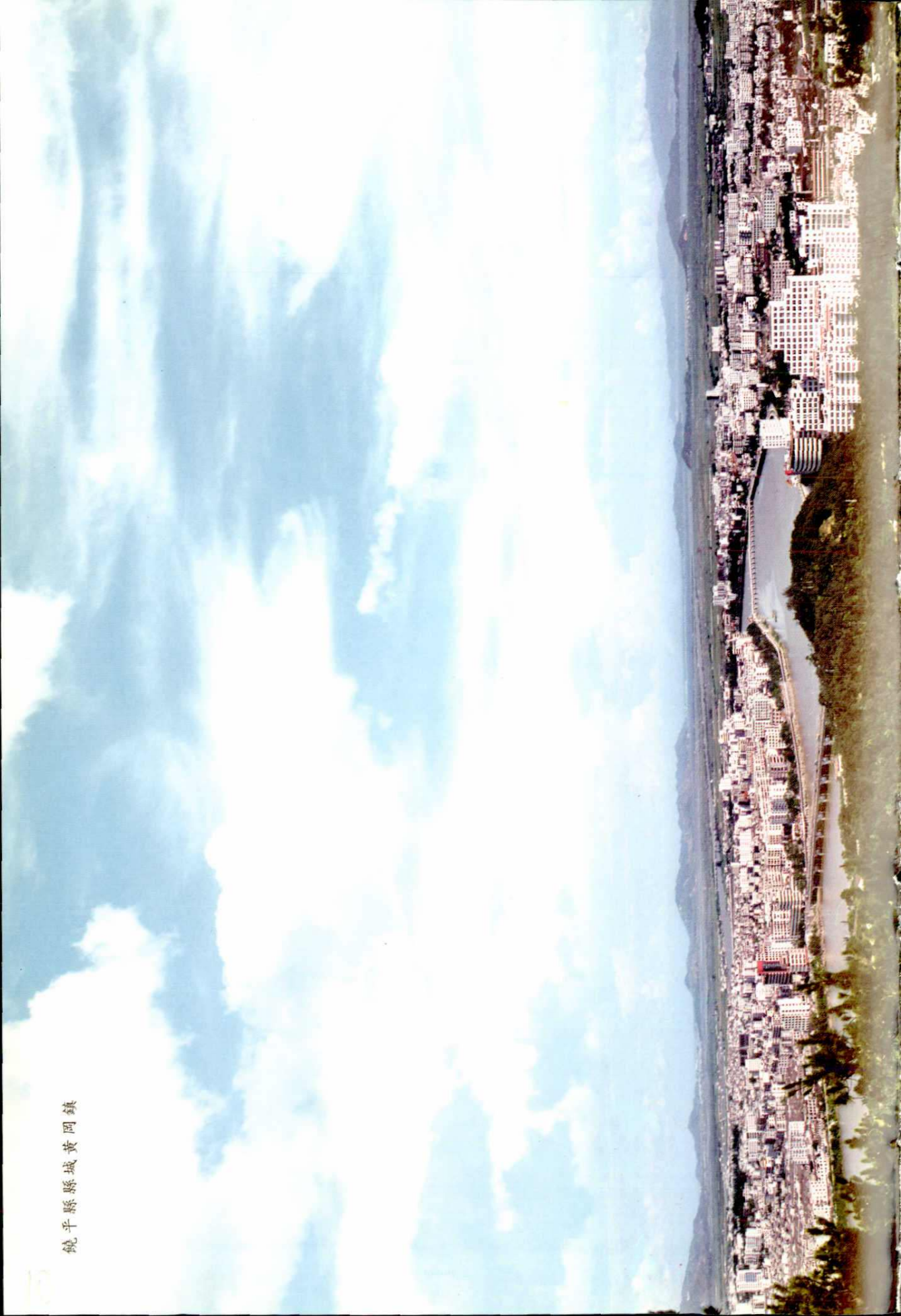
觀平縣縣城黃岡鎮