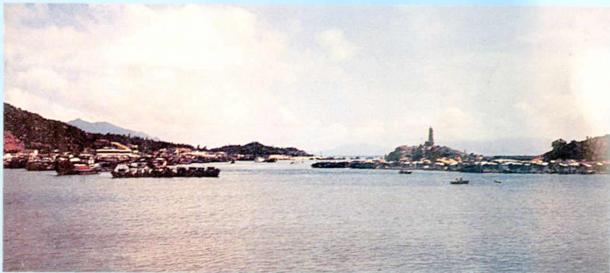
明清時期饒平旅外華僑出海口——柘林港