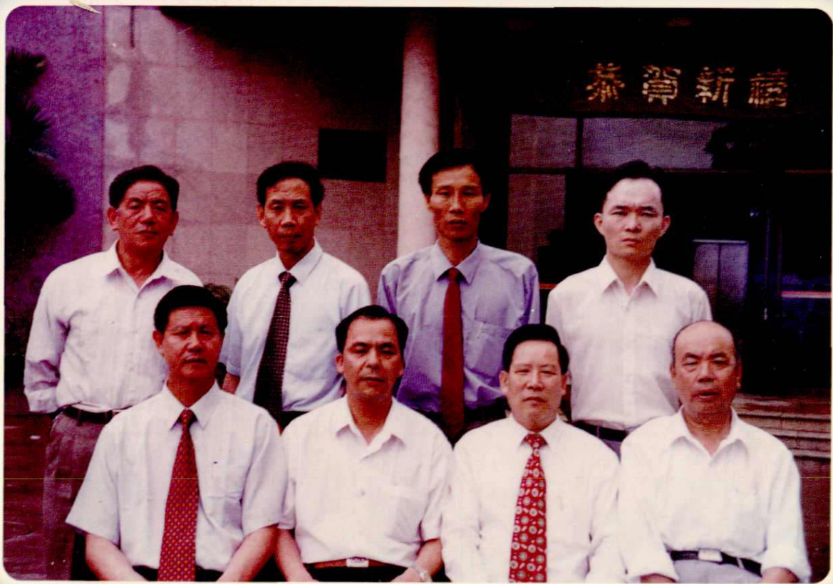
饒平縣僑聯領導與本書編輯人員合影