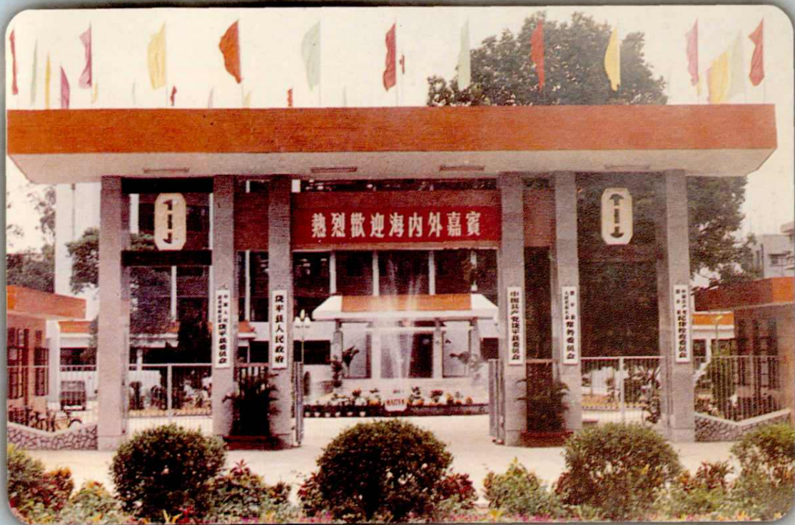
饒平縣人民政府大院