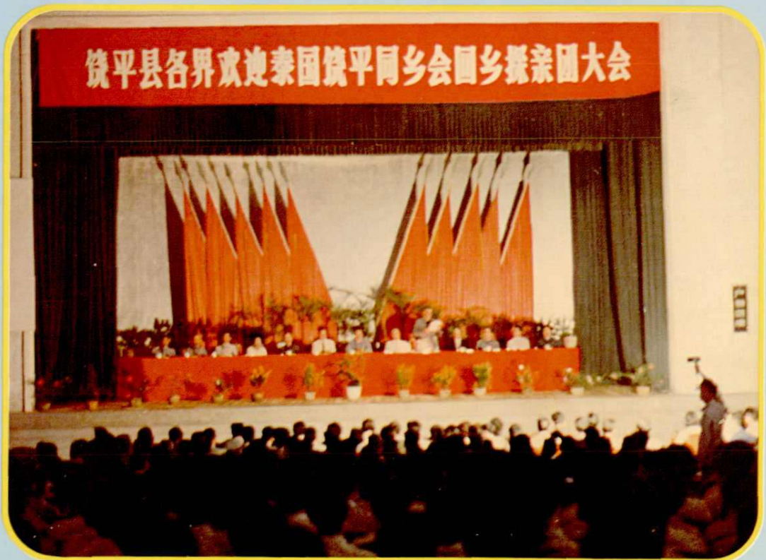
1984年4月，饒平各界1000餘人在黃岡紅星影劇院集會，熱烈歡迎泰國饒平同鄉會探親團