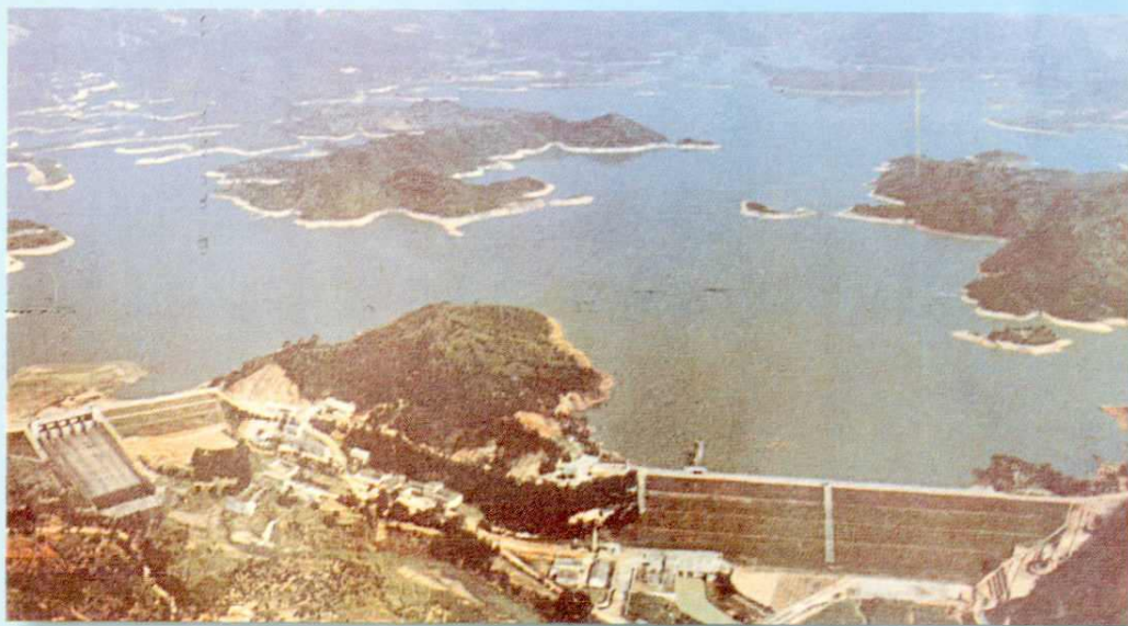
1959年建成庫容量三億八千萬立方米的湯溪水庫