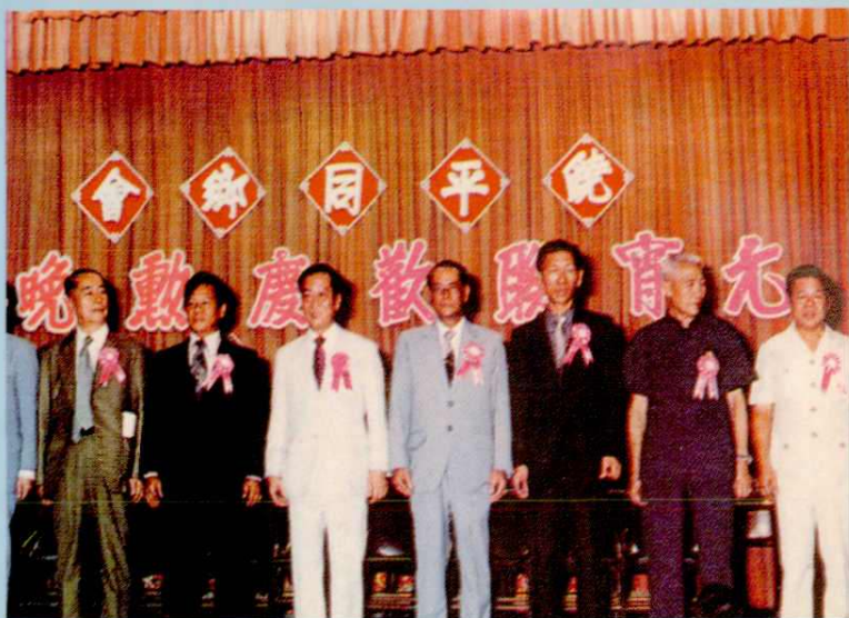
第十屆理事會正副理事長登臺向鄉親們祝賀春禧