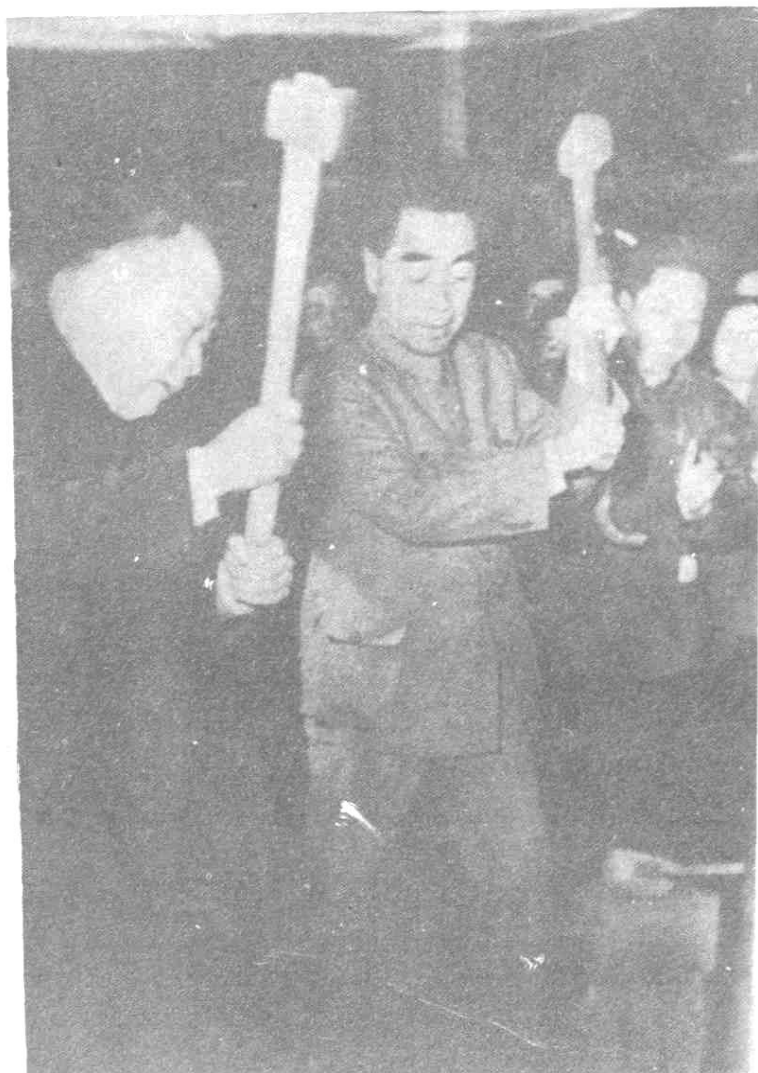
1958年12月13日，国务院总理周恩来，副总理陈毅在麻城凤凰窝钢铁厂挥锤打铁