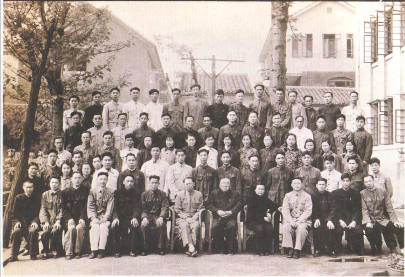
1958年春,內務部部長謝覺哉來渝視察工作與市民政局機關幹部及局屬單位負責人合影