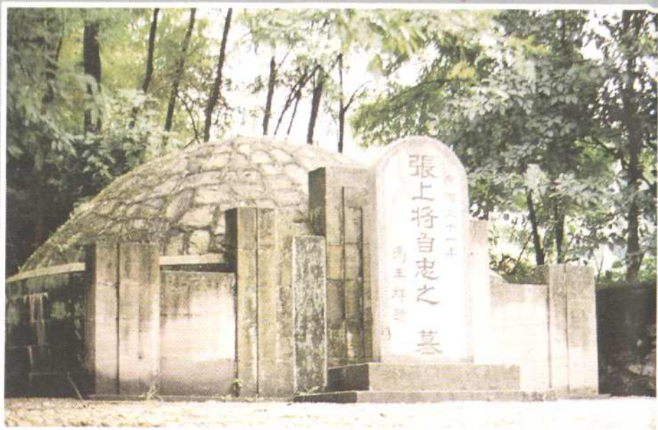
▶著名抗日将领张自忠烈士墓