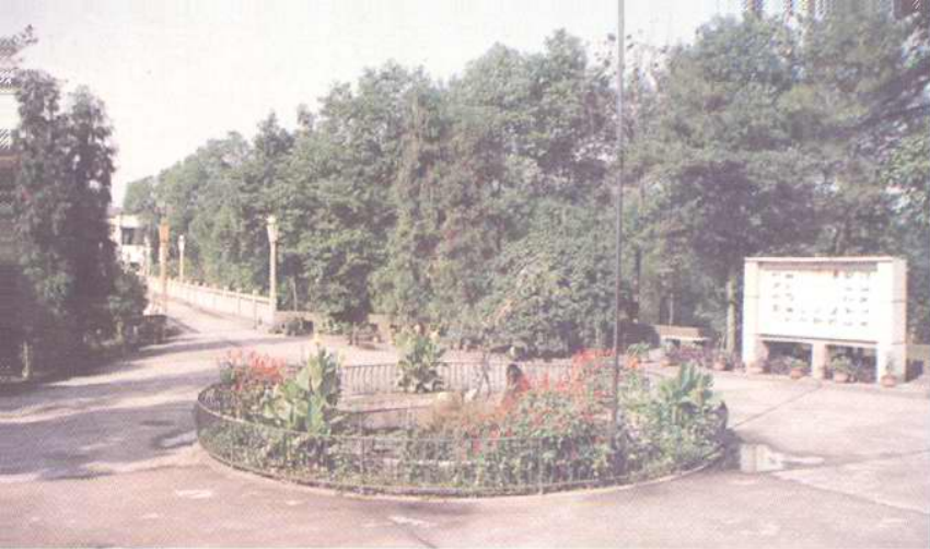
▼重庆市第一社会福利院老人休养区