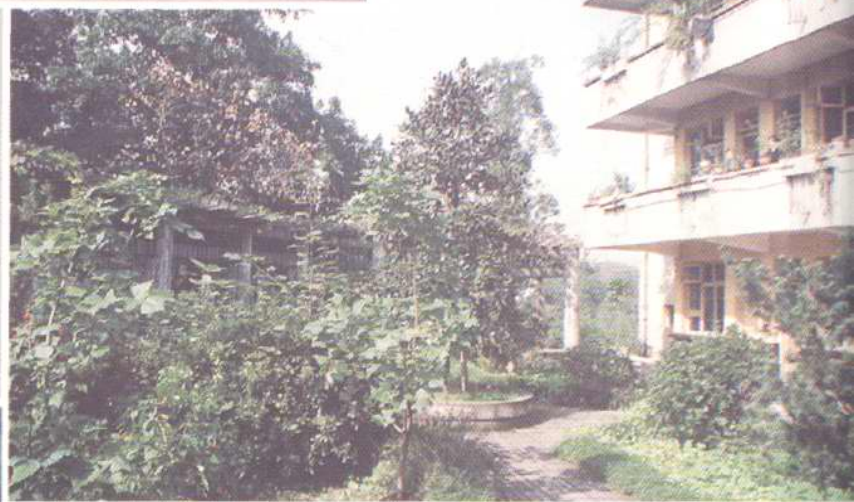
▲重庆市第一社会福利院