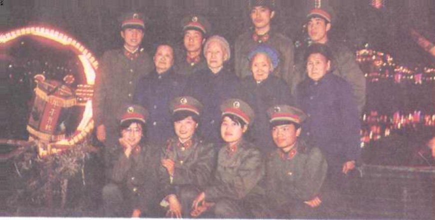
▲第三军医大学包护组陪同孤寡老人观看《重庆与世界》灯会