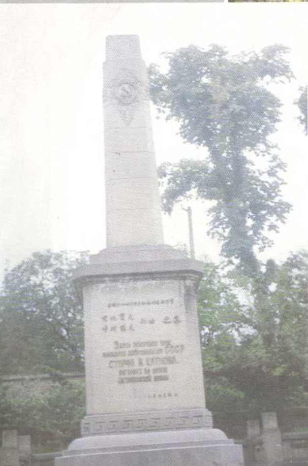
◀ 抗日战争时期志愿援华苏军烈士墓