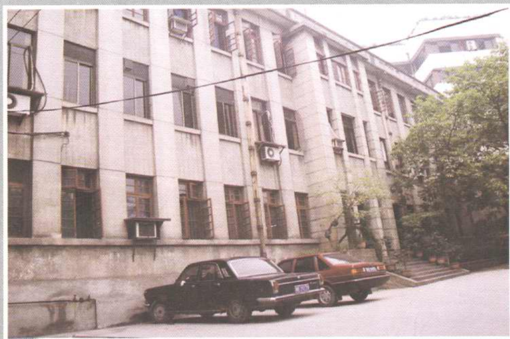
重慶市民政局辦公樓