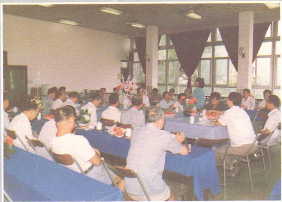
◀慰问军队离退休干部座谈会