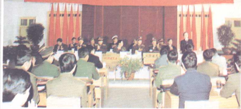
重庆市拥军优属拥政爱民工作会