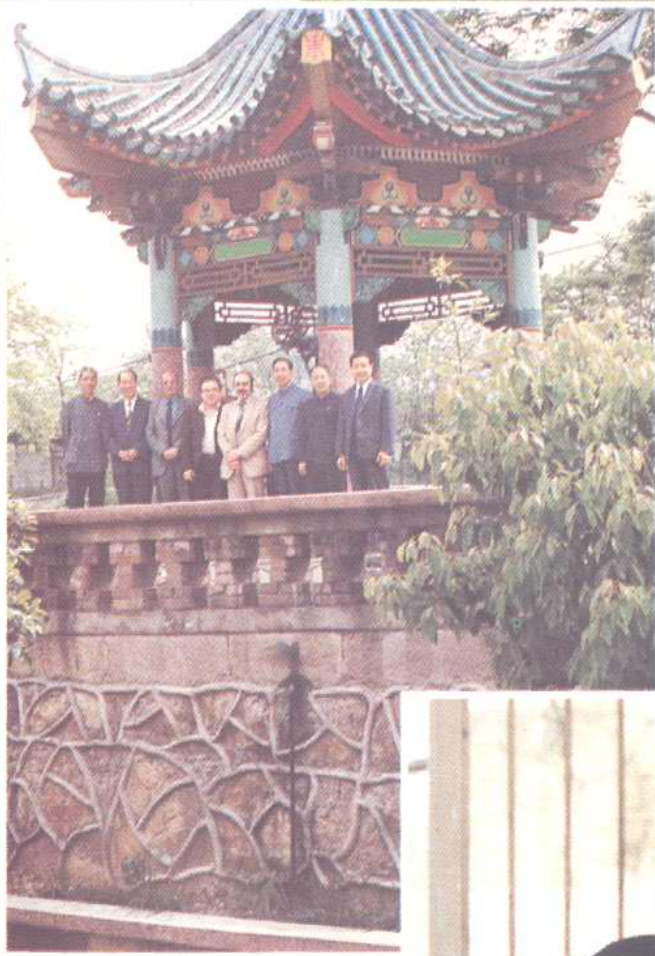
◀1985年7月马耳他共和国秘书长一行参观市第三社会福利院