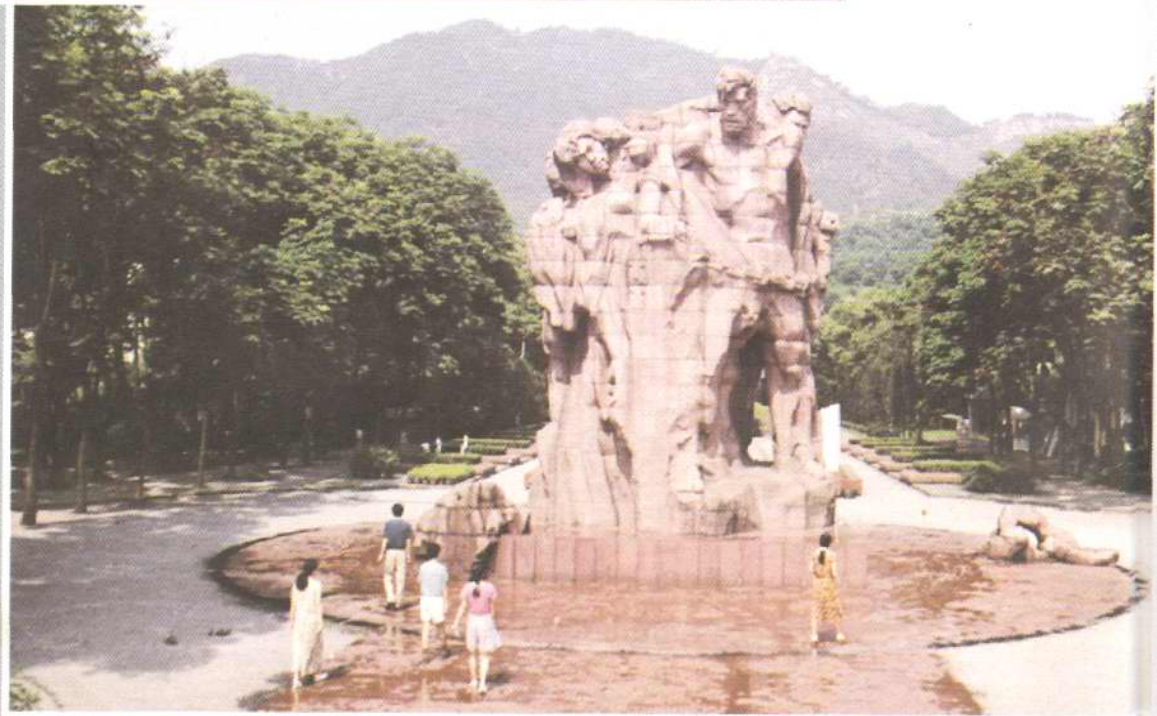
▶宁死不屈——「一一·二七」烈士群雕