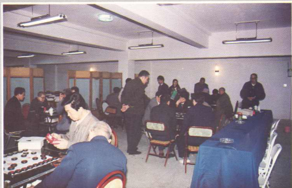
▶干部所文娛活动室