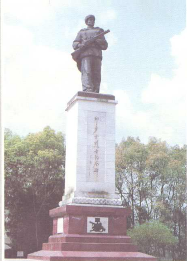
▲邱少云烈士纪念碑