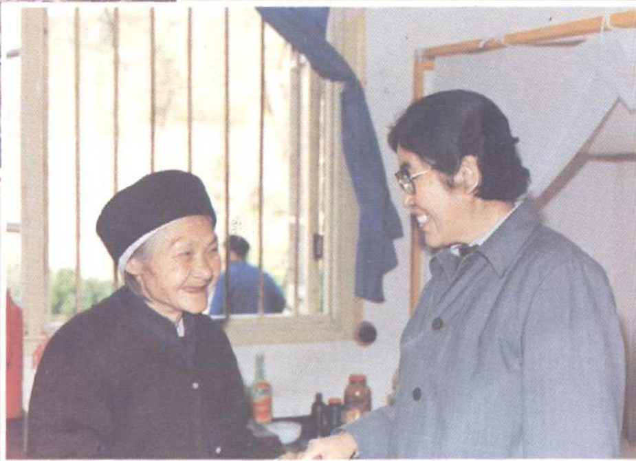
▼民政部副部长章明在市第三社会福利院与老人亲切交谈