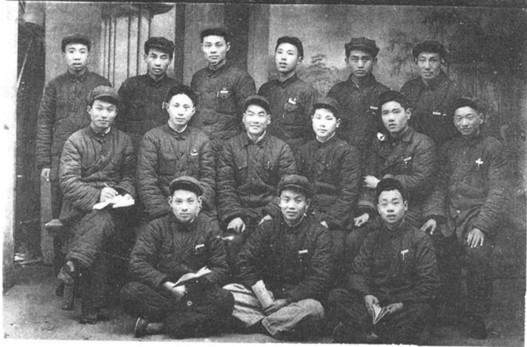
淮安縣助稅委員會城北分會評模合影紀念 1952.3.28 攝