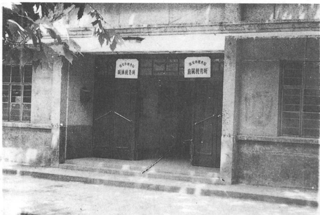
直属税务所、城镇税务所