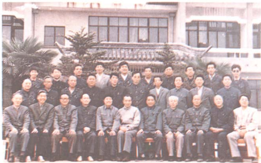
参加《淮安税务志》座谈会人员合影