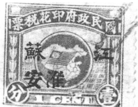
民國十五年（1926年）印花稅票