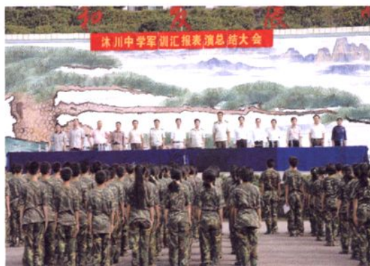
新生军训表彰总结会