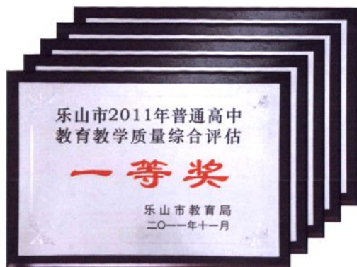
2007—2012年连续五年获乐山市普通高中教育教学质量综合评估一等奖