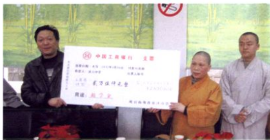
峨嵋山佛教协会捐资助学