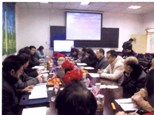
办学水平督导评估