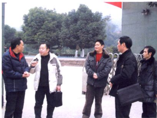
市政府教育督导室副主任汪泽云（左二） 指导学校工作