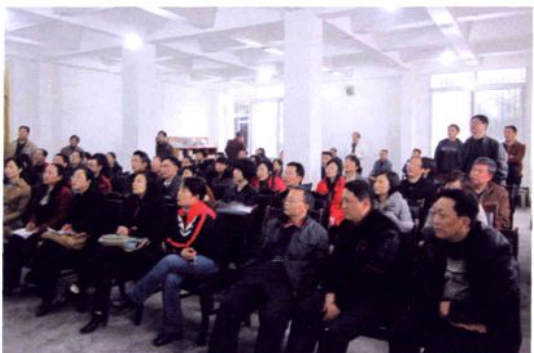
教师参加教学技能培训