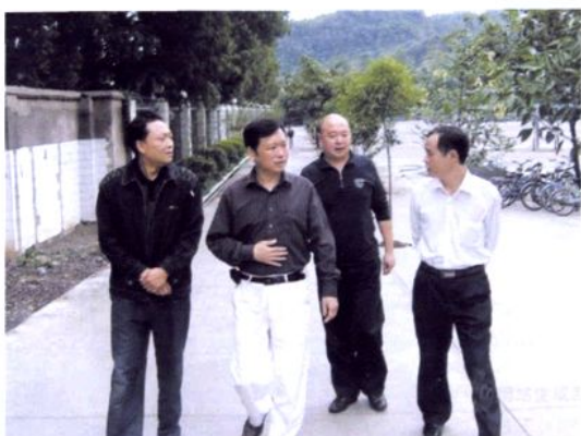
市教育局局长刘建丹（左二） 到沐川中学检查工作