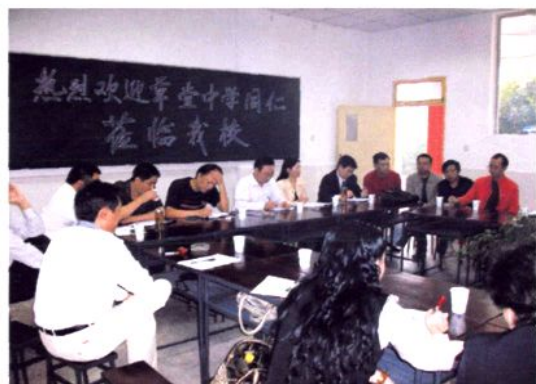
沐川中学与草堂高中开展校际交流