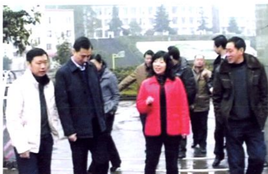
副市长徐建群（左三）来校调研