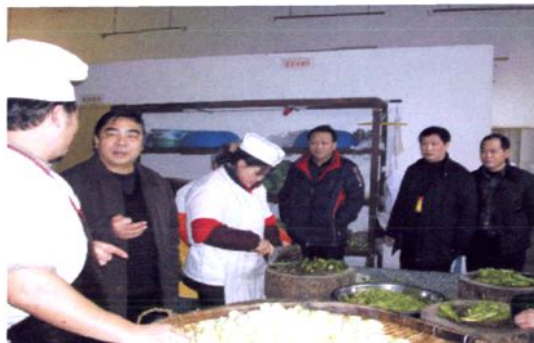
市人大副主任李永畅（左二） 到校关心学生饮食卫生