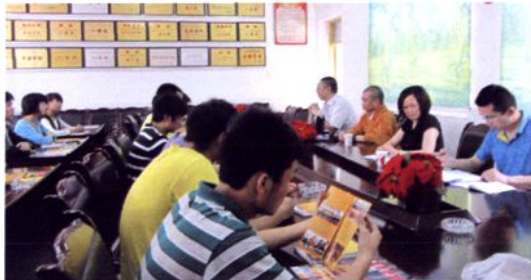
乐山大佛佛教协会助学活动