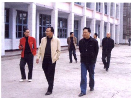
县委副书记、县长周明德到校调研