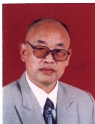
校长：李鑫 （1992.7—1997.7任副校长主持学校工作， 1997.8—1998.7任校长）