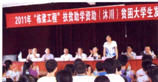
栋梁工程资助大学新生