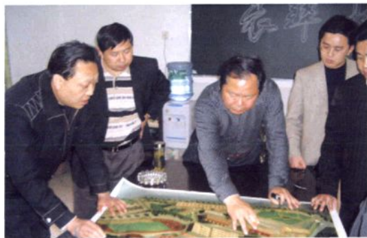
市计委主任李泽宗（左三）来校指导工作