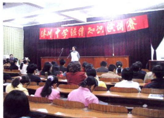
法律知识演讲比赛