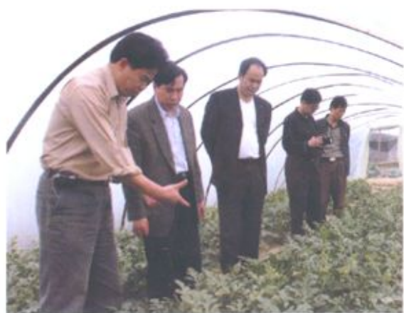
▲▼自治区农业厅副厅长韦祖汉到合浦县检查指导农业生产工作。