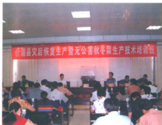
合浦县农业局举办“三高”农业的各种技术培训班。