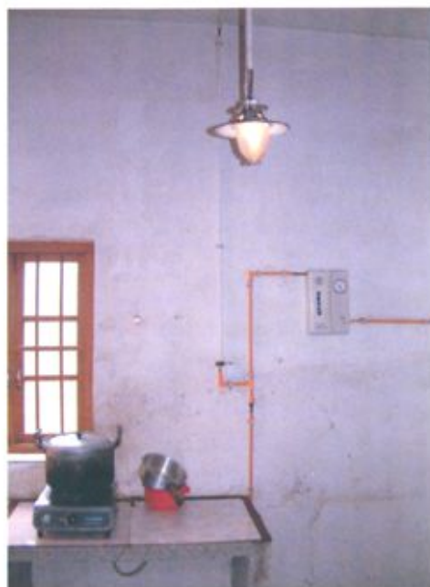
合浦县实施“一池三改沼气建设工程”，让广大农民过好日子。