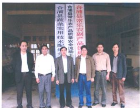
各级领导考察合浦“三高”农业时合影