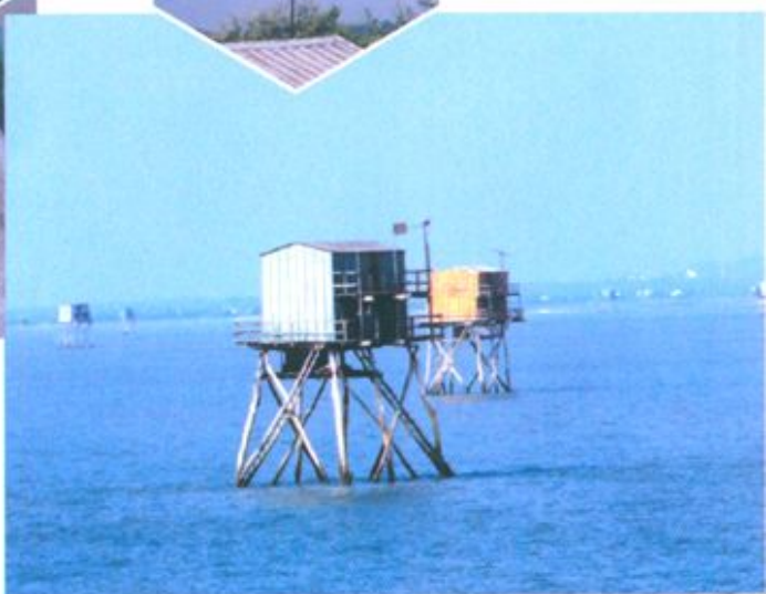
合浦县农村能源办在上级部门的支持下，于1989年建成了广西合浦南珠牌风力发电机厂，生产的南珠牌风力发电机价平、好用，图为合浦在陆上、海上安装风力发电机发电的情景。