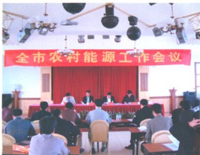
2005年12月28日，北海市农村能源工作会议在合浦召开。