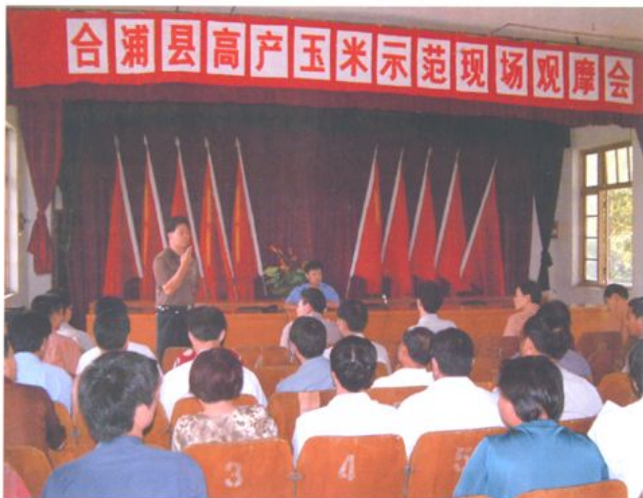
合浦县农业局建立“三高”农业示范区，图为高产玉米示范推广现场会