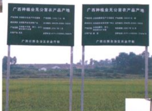
▲▼► 合浦县农业“三高”农业的各种示范区