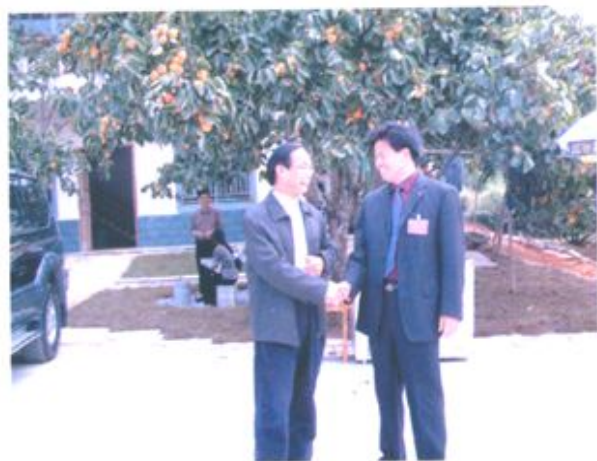
农业厅张明沛厅长要求合浦以生态建设为纽带建设社会主义新农村。