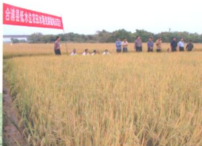
合浦县免耕水稻栽培技术试验成功