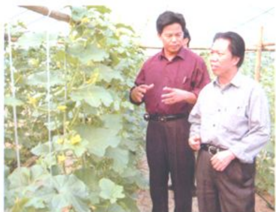
区农业厅韦仕鹏巡视员在合浦农科所检查大棚生产情况。