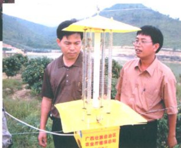
局领导和植保技术人员检查振频式灯杀虫效果。