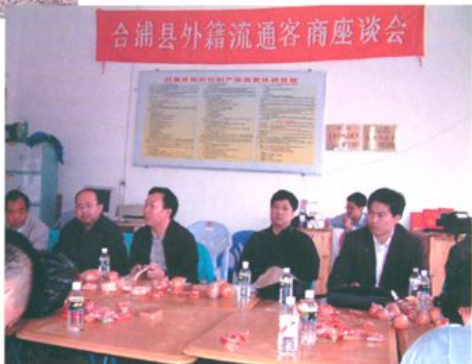
合浦县召开外籍流通客商座谈会