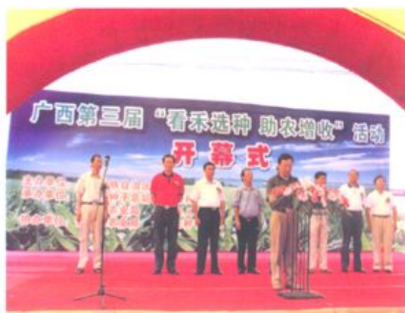
2006年6月22日自治区第三届“看禾选种、助农增收”活动现场会议在合浦召开。