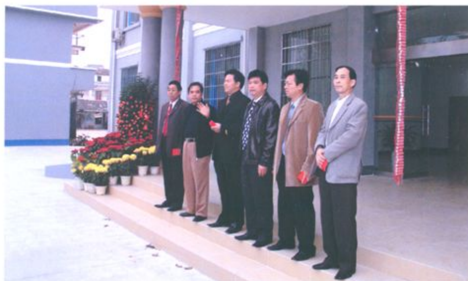
农业局领导班子合影