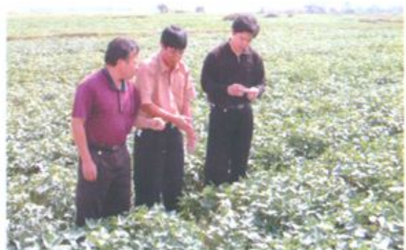
市、县、局领导深入田间和种植试验基地检查指导生产情景。