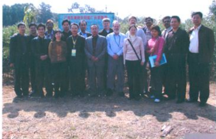
澳大利亚、印尼农业专家在合浦考察合影