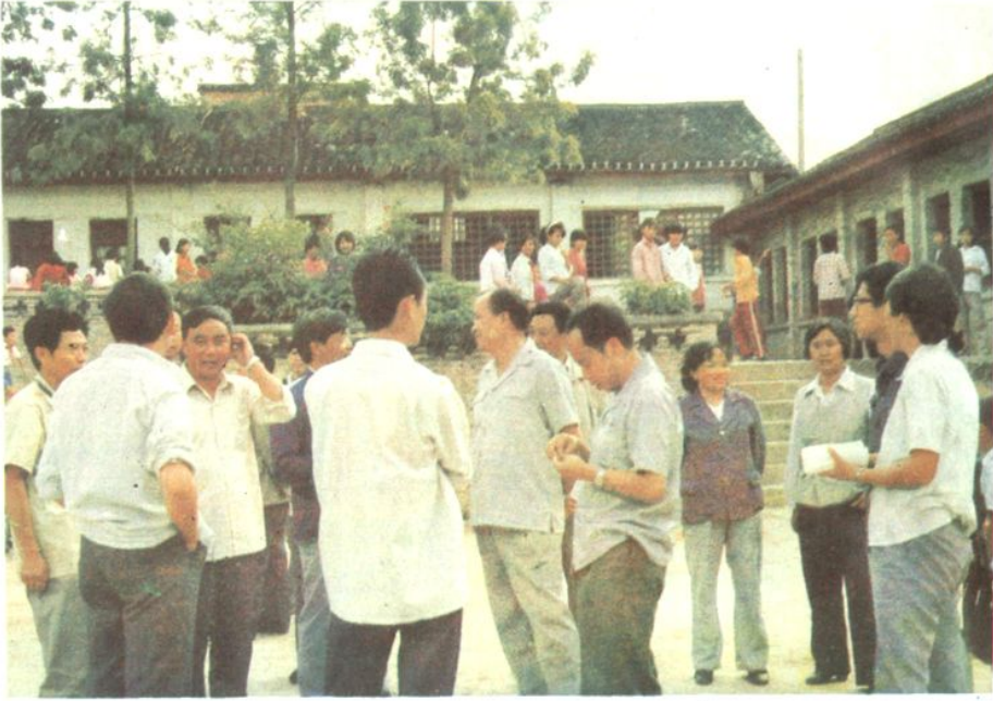
1985年云南省教育厅厅长，文山州副州长，州教育局副局长， 由广南县委副书记和教育局局长陪同看望城区二小师生