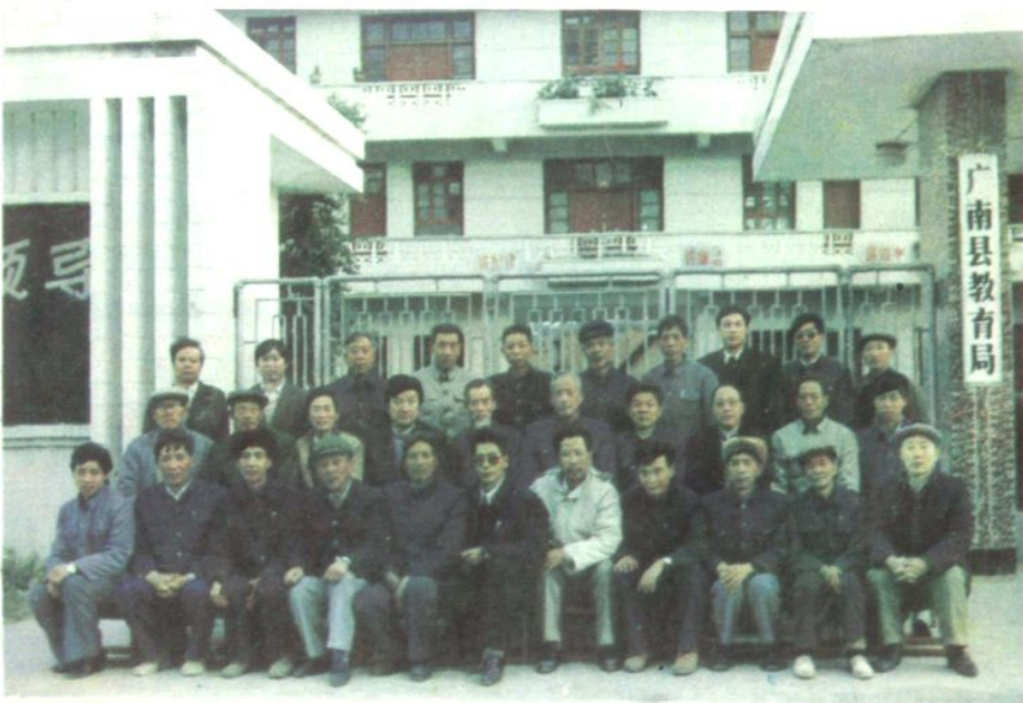
文山州八县评审《广南县教育志》参审人员合影