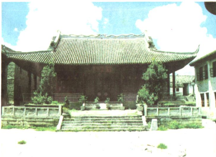
一中阅览室(原孔庙大成殿)