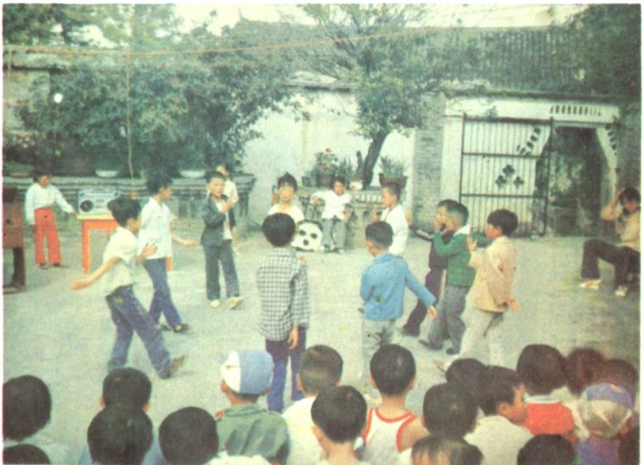
县幼儿园小朋友在教师指导下活动