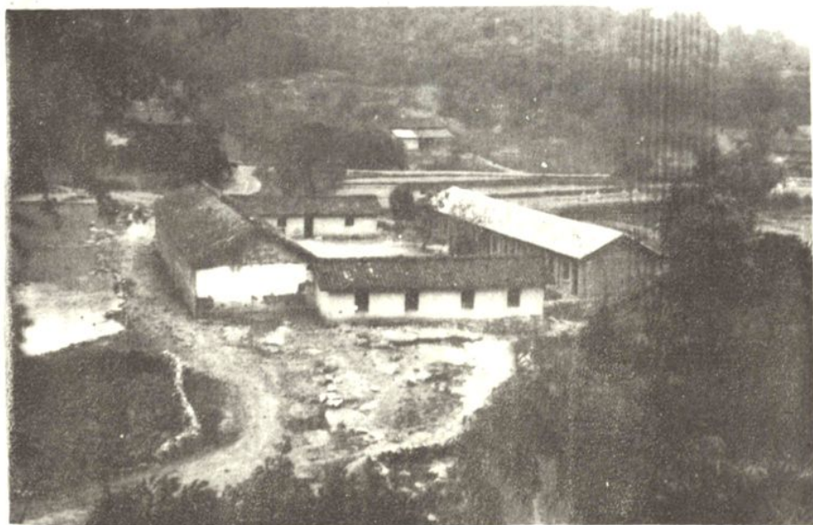
珠琳镇新寨村群众集资新建的校舍