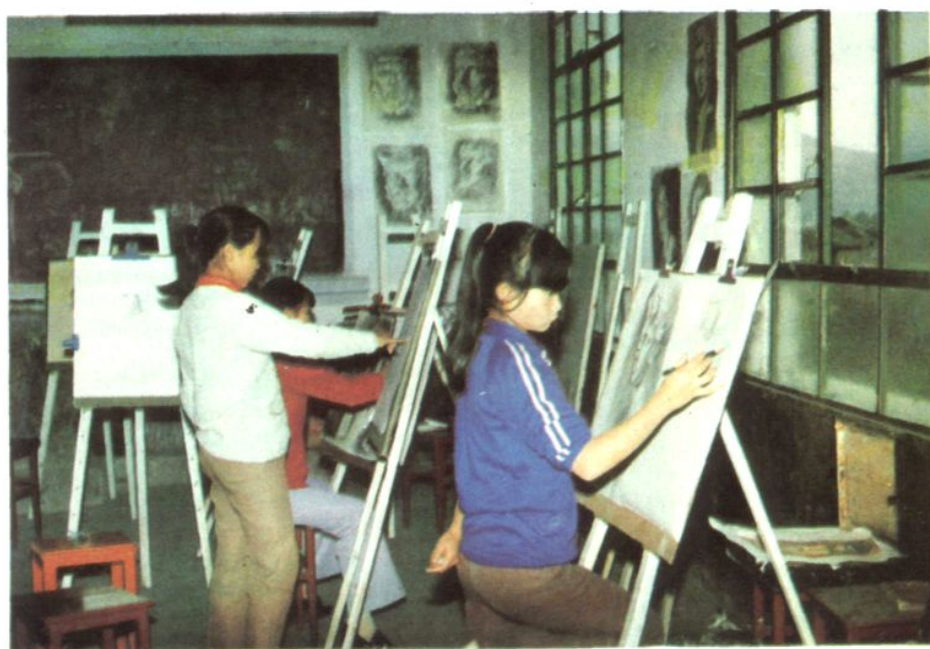
一中美术兴趣小组活动室一瞥