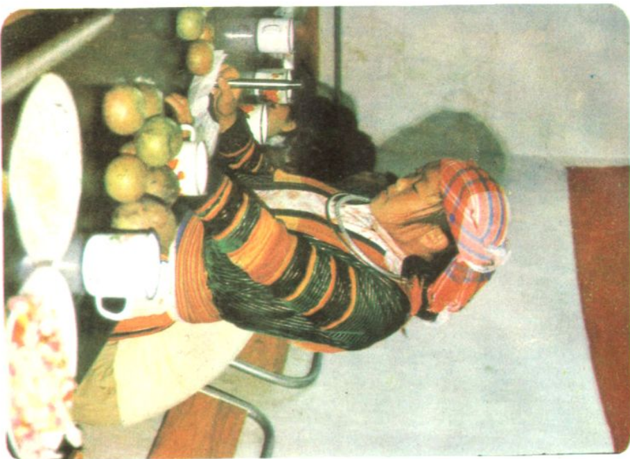
苗族教师在第一个教师节庆祝会上发言