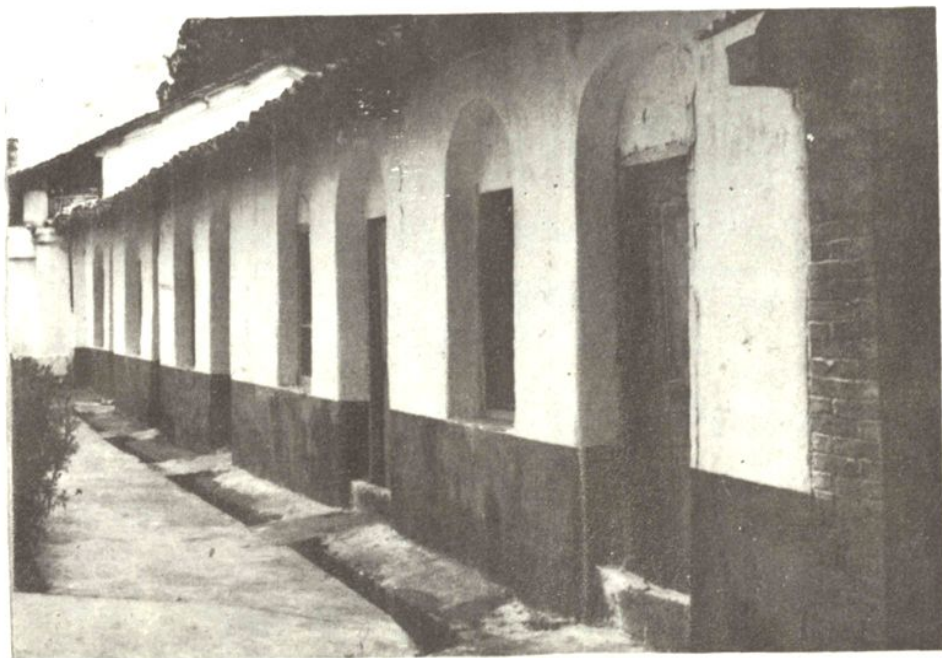
民国时期县城莲花小学教室（现为县医院所用曾多次整修）