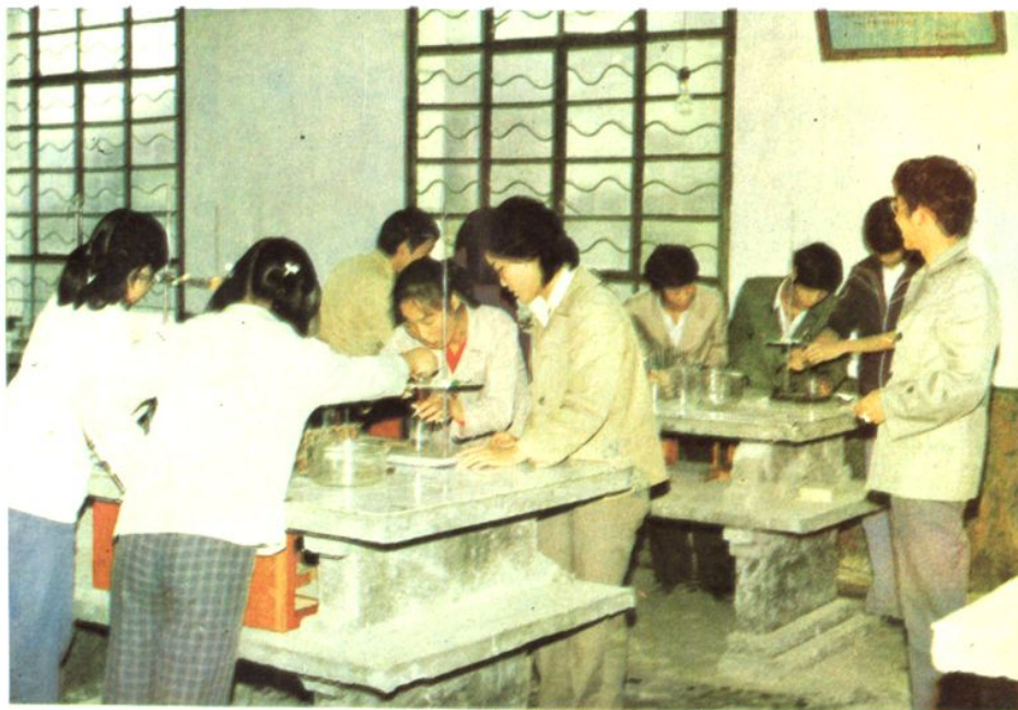
一中学生化学分组实验