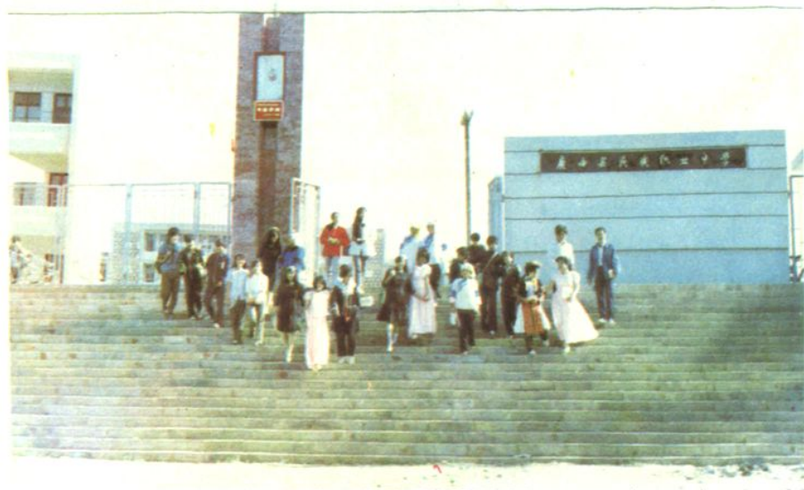
新建的民族职业中学