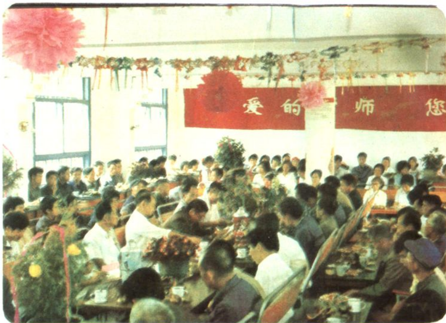
第一个教师节，县党政领导和优秀教师座谈