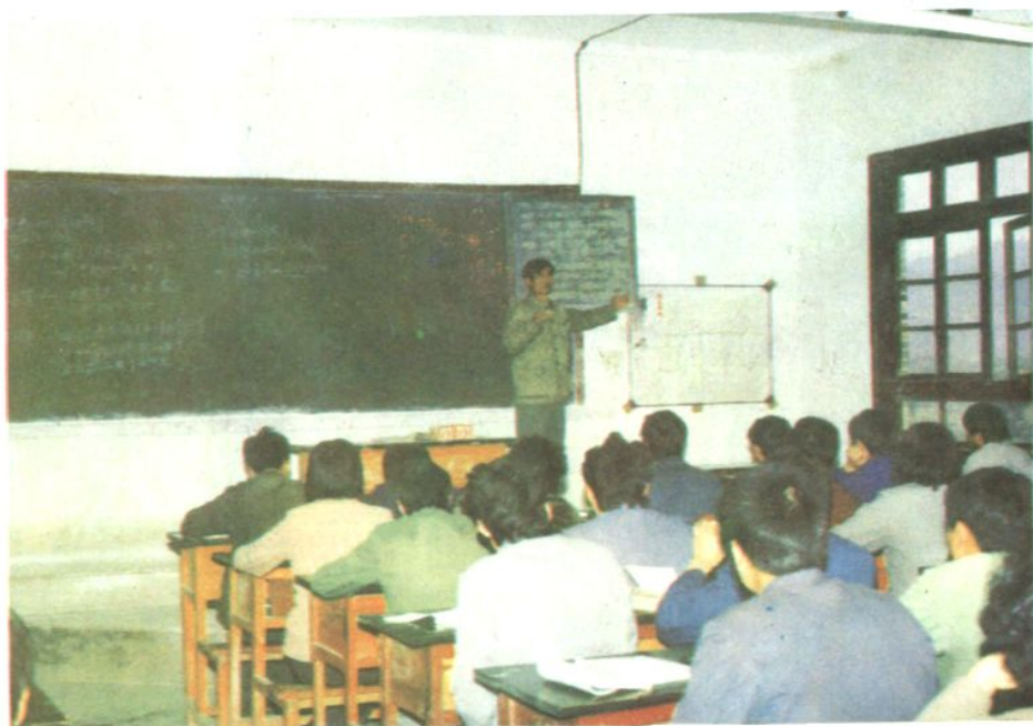
文山州教师进修学校数学校际教研活动在广南举行