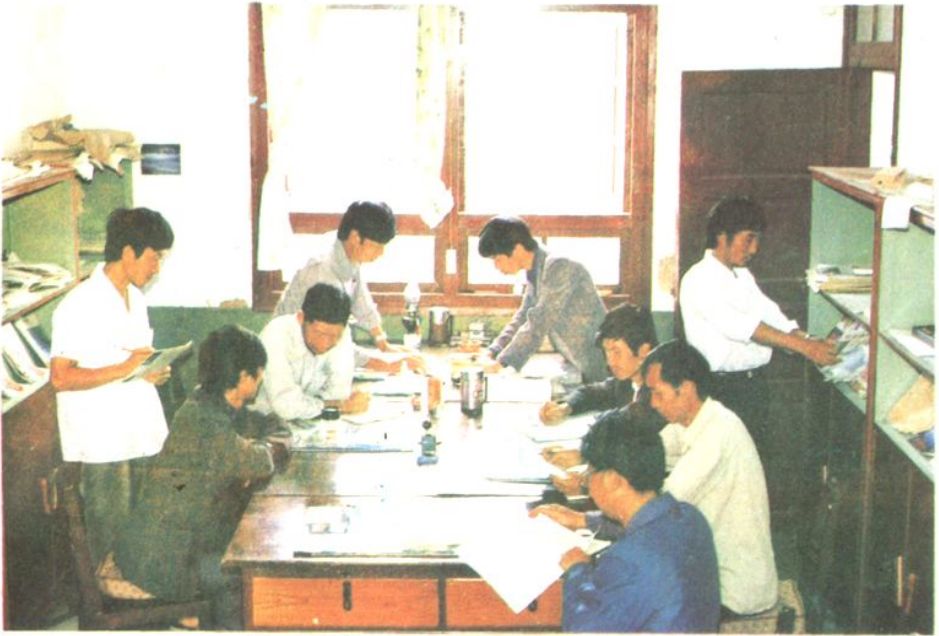
县教研员在紧张工作