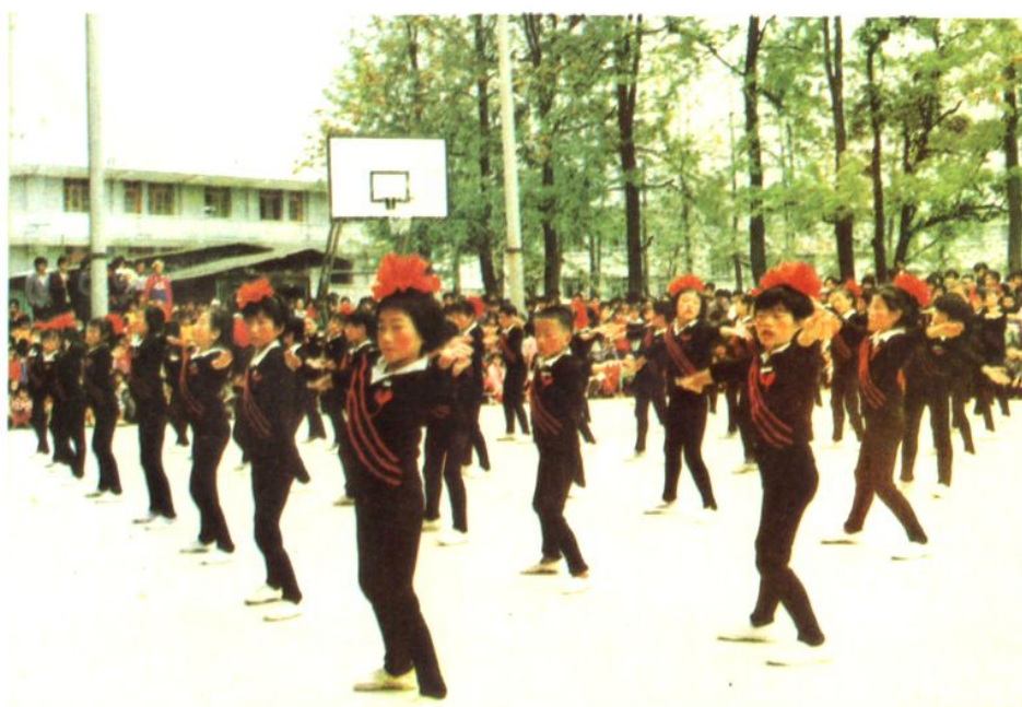
教育局具体委组织的少年集体操比赛